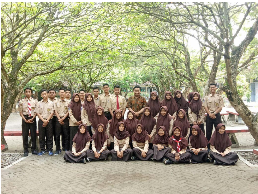
Gambar 6: Foto setelah mengajar pertemuan terakhir di XI MIPA 2