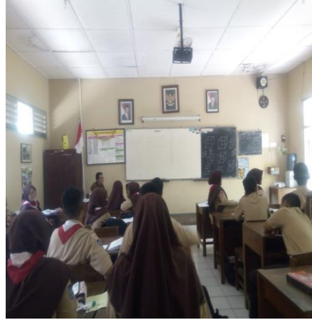
Gambar 2: Mengajar di kelas