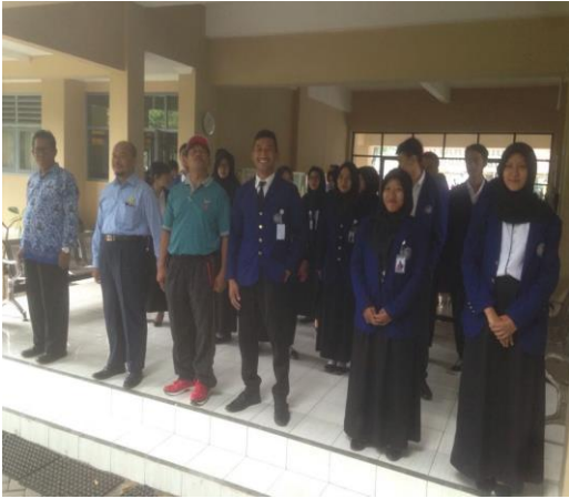
Gambar 1: Piket lobby