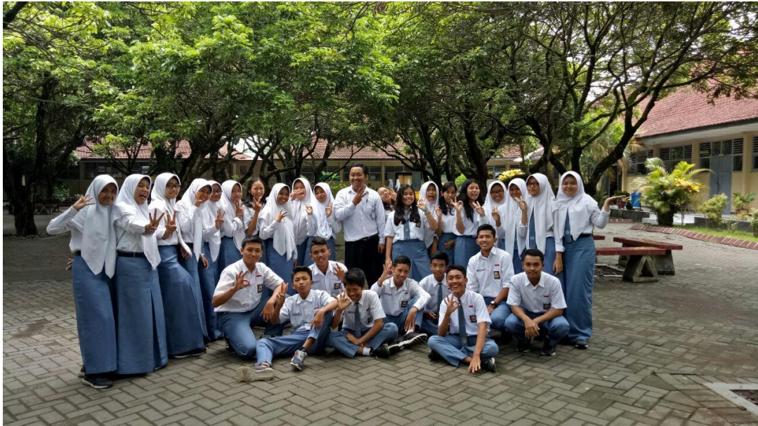
Gambar 3: Foto setelah mengajar pertemuan terakhir di XI IPS 3