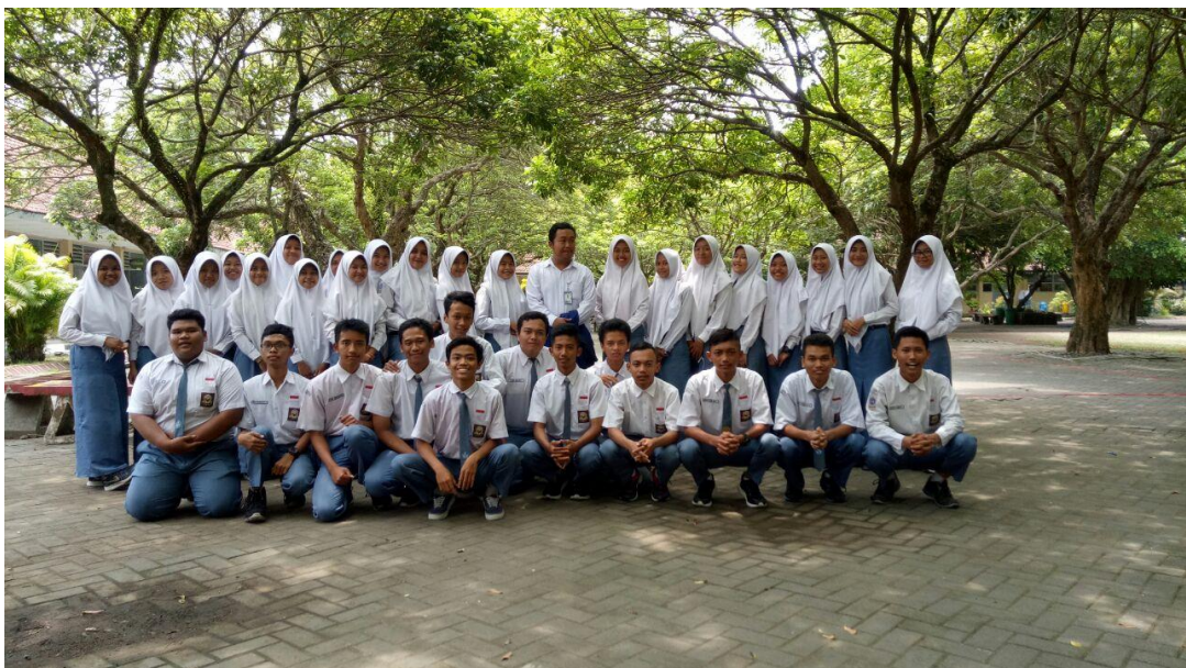
Gambar 4: Foto setelah mengajar pertemuan terakhir di XI MIPA 4