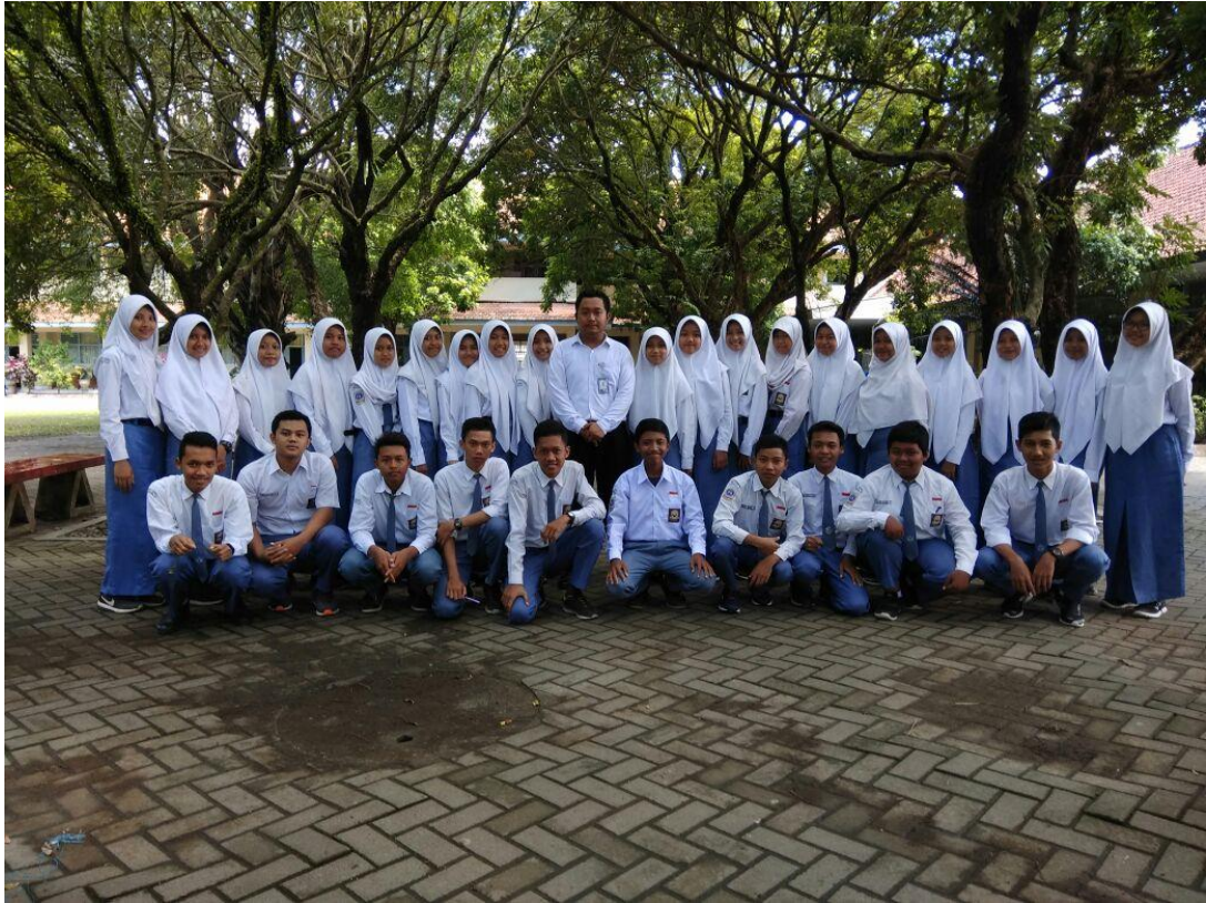
Gambar 5: Foto setelah mengajar pertemuan terakhir di XI IPS 1