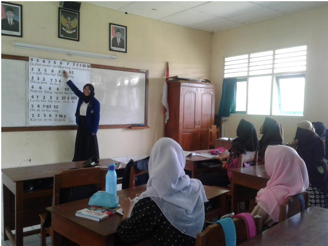
Mengajar Tembang Macapat