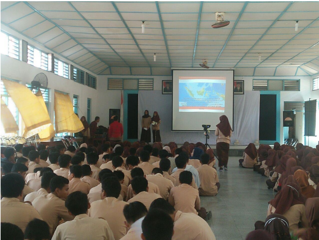
Nobar G30S/ PKI