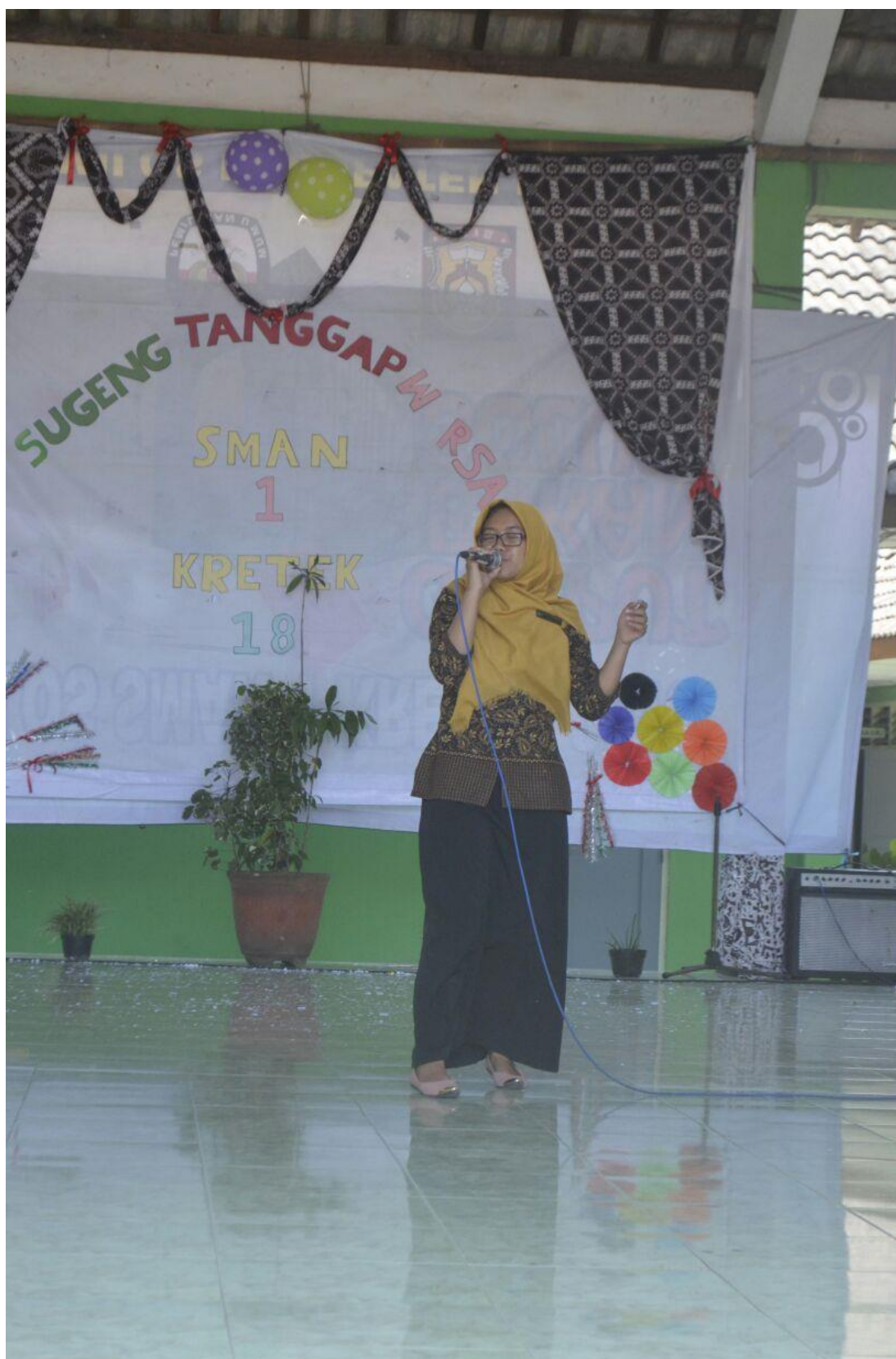
Mengisi Acara HUT SMA N 1 Kretek