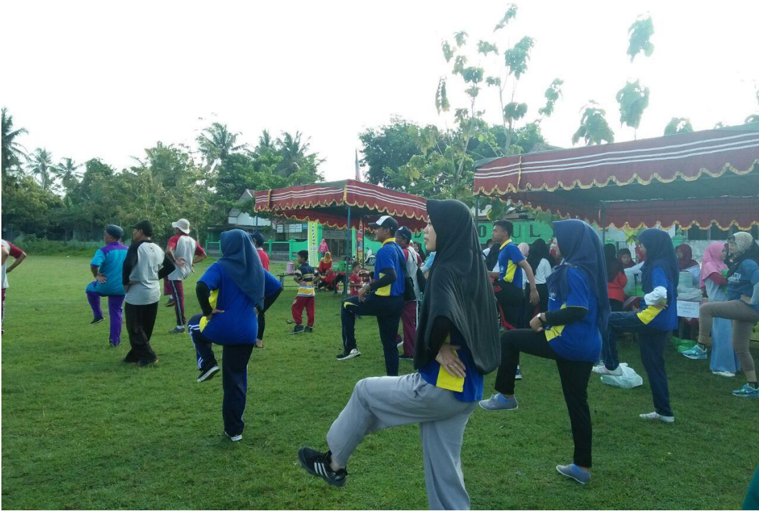
HUT SMAN 1 Kretek