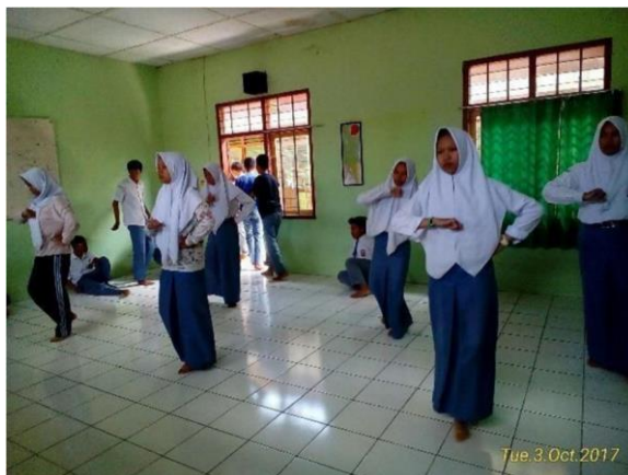
Proses Pembelajaran Praktek Tari Zapin