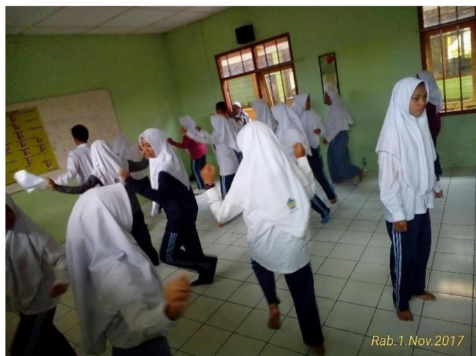
Proses Praktek Pola Lantai Tari Zapin Berkelompok