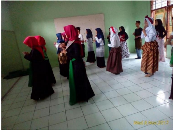
Latihan Sebelum Ujian Kelompok Tari Zapin