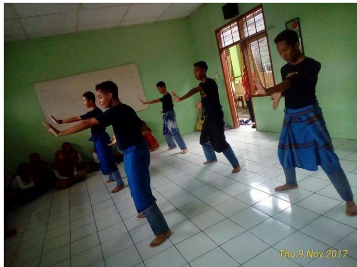
Ujian Kelompok Tari Zapin