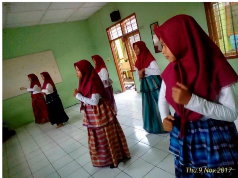
Ujian Kelompok Tari Zapin