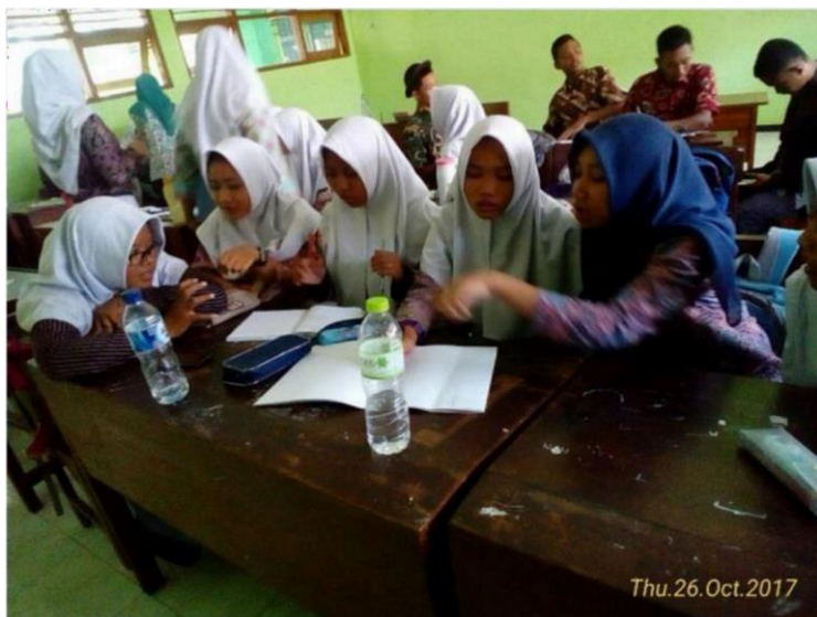
Proses Mengerjakan Tugas Danceskrip Secara Berkelompok