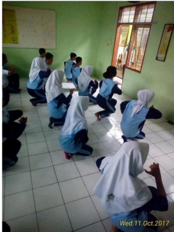
Pendalaman Tari Zapin Sebelum Ujian Individu