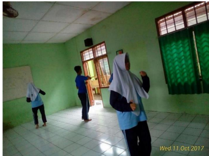
Ujian Individu Tari Zapin