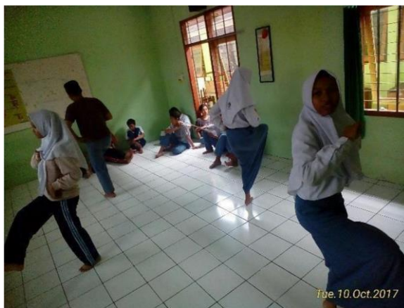
Pendalaman Tari Zapin