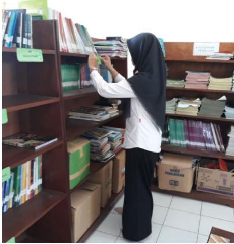
Gambar . Pemasangan Katalog Buku