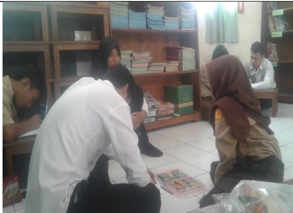
Gambar . Pendampingan Peserta Lomba MTQ