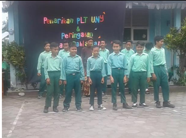
Gambar . Penampilan Menyanyi Lagu Wajib Nasional dan Daerah