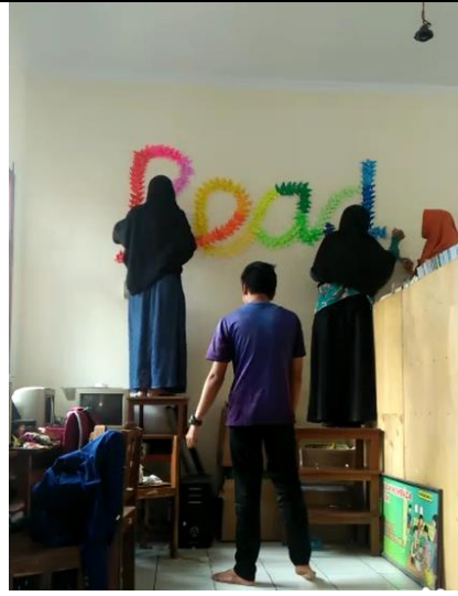
Gambar . Pemasangan Hiasan Kupu-kupu