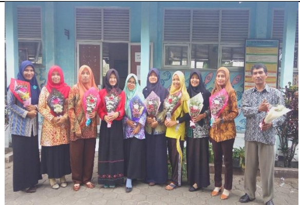
Gambar . Hari Guru Internasional