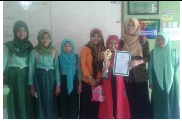
Gambar . Juara 2 Cabang Lomba Pidato