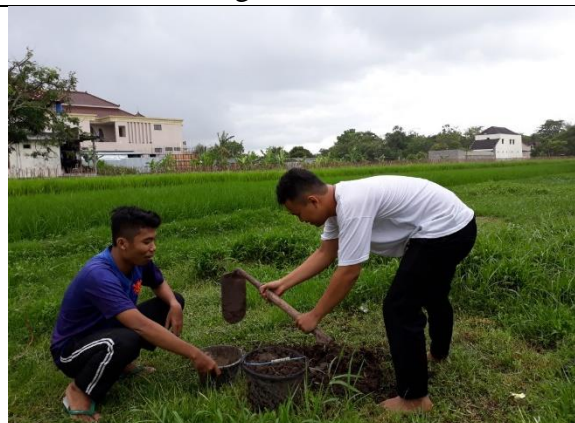
Gambar . Persiapan Tanah untuk Menanam