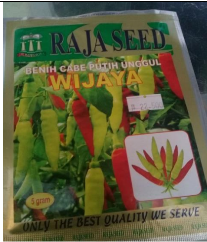
Gambar . Benih Tanaman Cabai