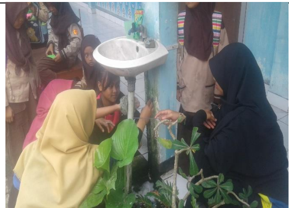
Gambar . Kerja Bakti