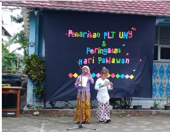
Gambar . Peserta Duta Pahlawan Kelas 2