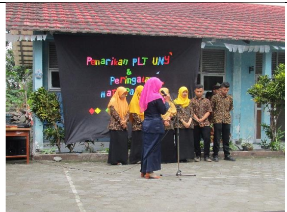
Gambar . Tanggapan dari Koordinator Guru Pendamping PLT