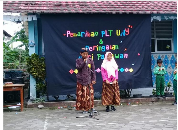
Gambar . Peserta Duta Pahlawan Kelas 6