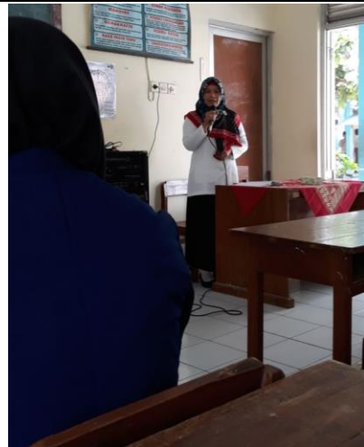
Gambar 2. Penerimaan Mahasiswa PLT dari Pihak Sekolah