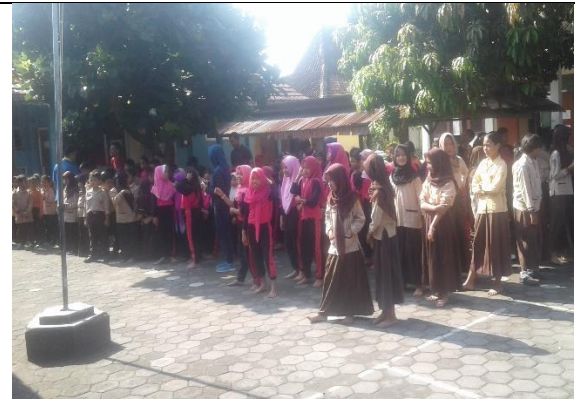
Gambar. Siswa Bersiap Melakukan Sikat Gigi Bersama