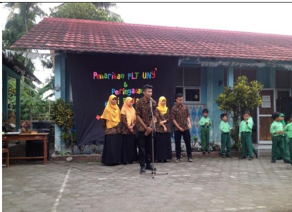
Gambar . Pamitan Mahasiswa PLT