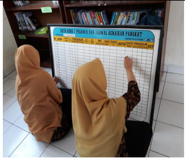
Gambar . Penulisan Ulang Data Guru dan Pegawai