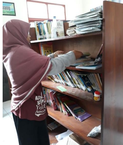
Gambar . Penataan Ulang Buku Perpustakaan