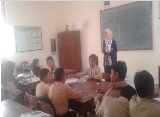
Gambar . Praktik Mengajar Terbimbing