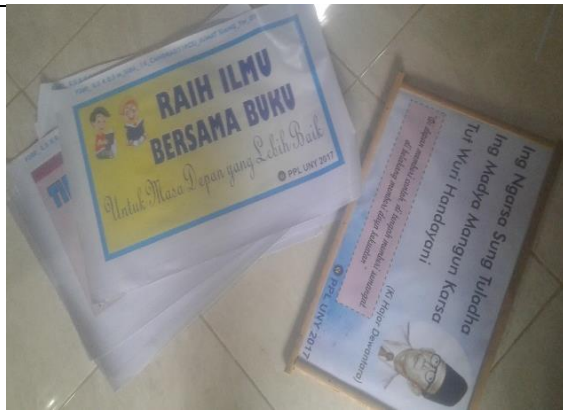
Gambar . Pembuatan Banner Slogan