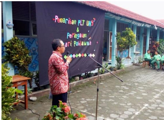
Gambar . Penarikan Mahasiswa PLT oleh DPL