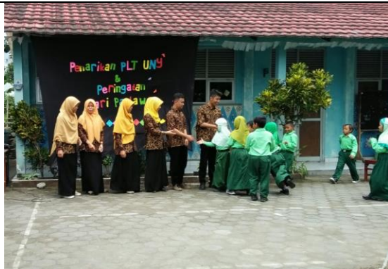
Gambar . Jabat Tangan dengan Siswa