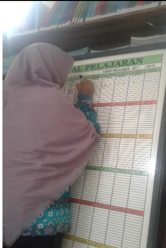
Gambar . Penulisan Ulang Jadwal Pelajaran