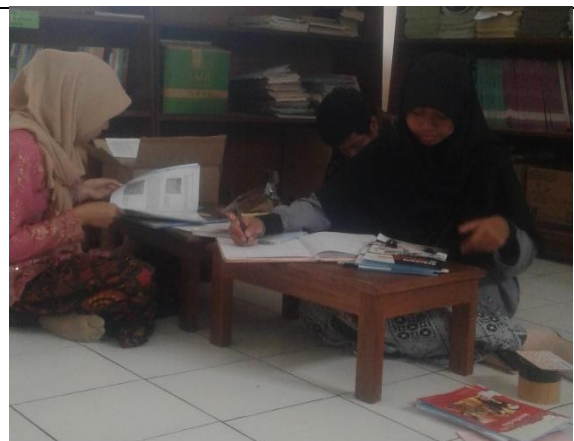
Gambar . Pendataan Buku Perpustakaan