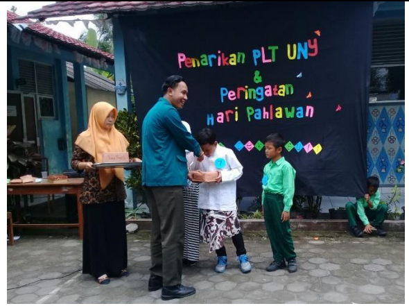
Gambar . Pembagian Hadiah Pemenang Duta Pahlawan