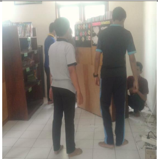
Gambar . Penataan Ulang Perpustakaan