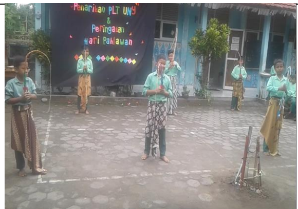
Gambar . Penampilan Tari Pong-pongan