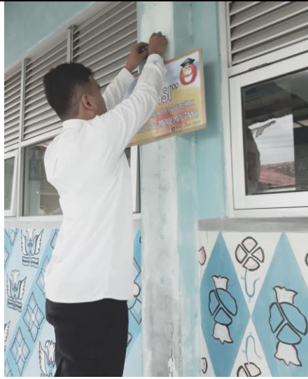
Gambar . Pemasangan Banner Slogan