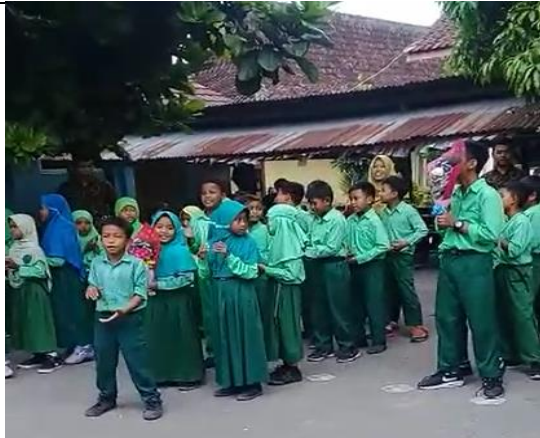
Gambar . Siswa Menyanyikan Lagu “Guruku Tersayang” dalam Rangka Hari Guru Internasional