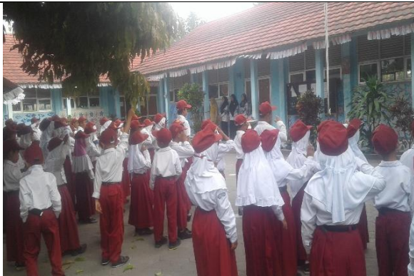
Gambar . Upacara Bendera Setiap Hari Senin