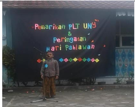
Gambar . Peserta Duta Pahlawan Kelas 1