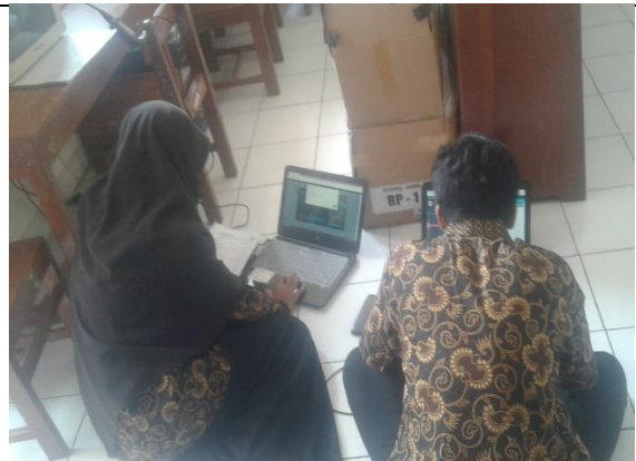
Gambar . Pengisian Data Dapodik