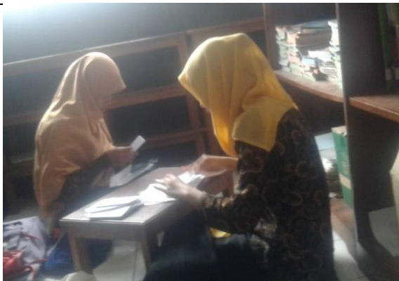
Gambar . Pembuatan Kantong Buku Perpustakaan