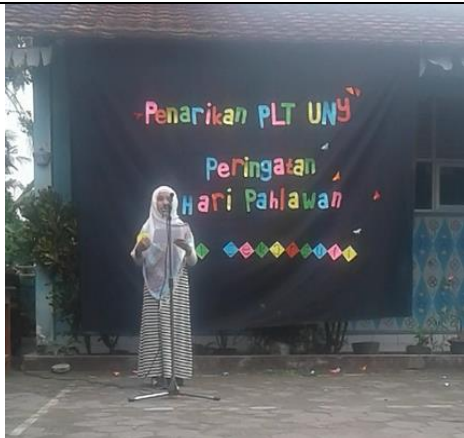
Gambar . Peserta Duta Pahlawan Kelas 5