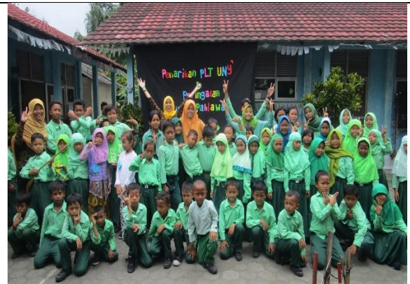
Gambar . Foto Bersama Siswa SDN 1 Sekarsuli