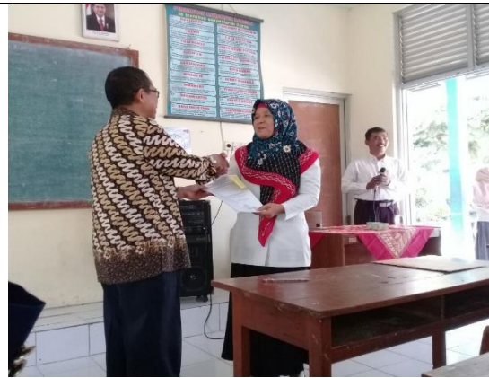
Gambar 4. Serah Terima Mahasiswa PLT