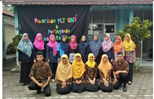
Gambar . Foto Bersama Guru SDN 1 Sekarsuli