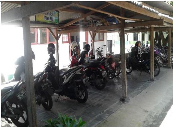
Gambar . Observasi Lingkungan Sekolah