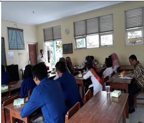
Gambar 3. Penerimaan Mahasiswa PLT