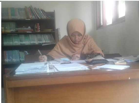
Gambar . Rekapitulasi Surat Masuk