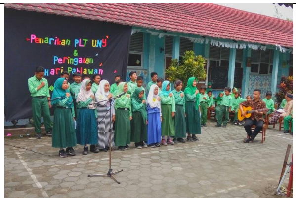
Gambar . Penampilan Musikalisasi Puisi dan Menyanyi Lagu Daerah