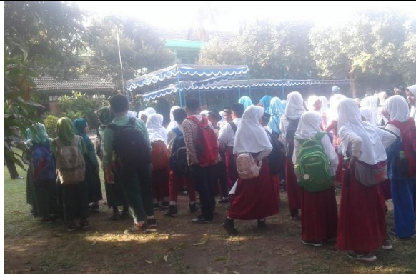
Gambar . Pendampingan Lomba MTQ