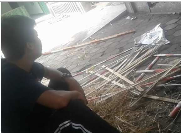
Gambar . Pembuatan Kerangka Taman dari Bambu