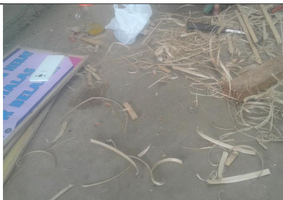
Gambar . Pembuatan Bingkai Slogan