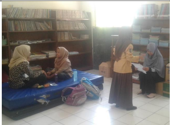
Gambar . Pendampingan Latihan Lomba MTQ