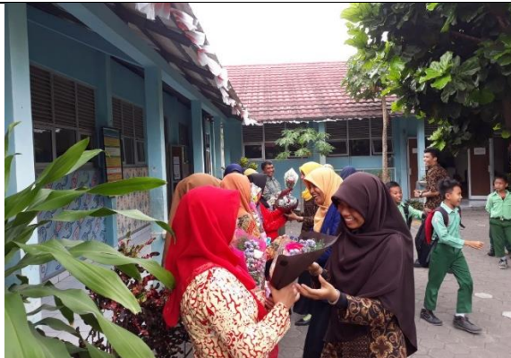
Gambar . Pemberian Buket Bunga dalam Rangka Hari Guru Internasional