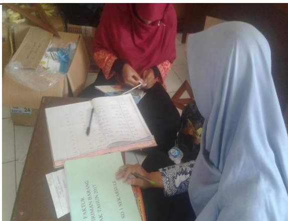
Gambar . Pemberian Label Buku Perpustakaan