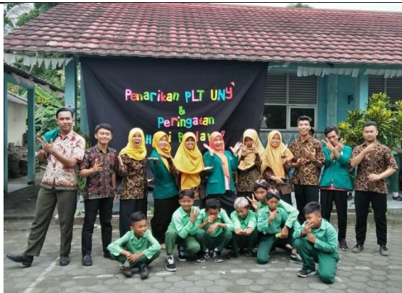
Gambar . Foto Bersama Mahasiswa Magang III UST