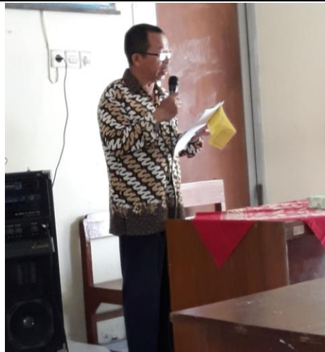
Gambar 1. Penerimaan Mahasiswa PLT oleh DPL