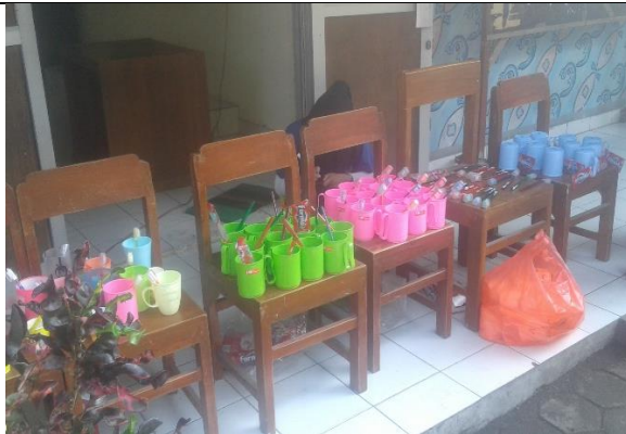
Gambar . Peralatan untuk Sikat Gigi Bersama