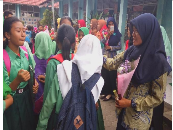
Gambar . Siswa Mengucapkan Selamat Hari Guru Internasional