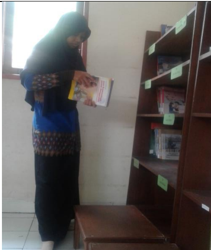
Gambar . Penataan Buku yang Telah Diberi Label