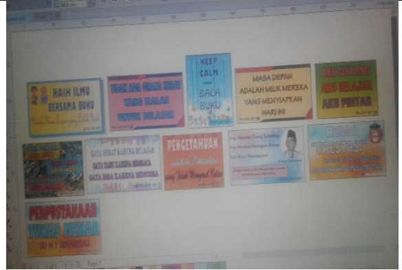
Gambar . Pembuatan Desain Banner Slogan