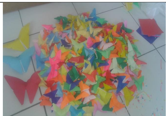
Gambar . Pembuatan Hiasan Kupu-kupu