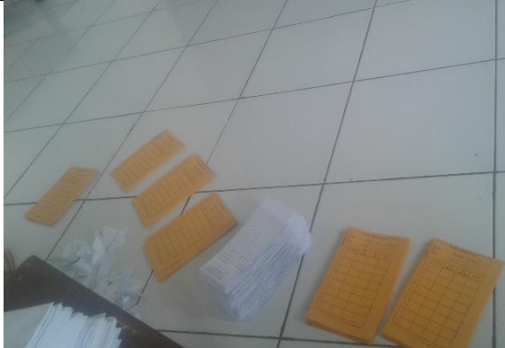
Gambar . Pemotongan Kartu Peminjaman Buku