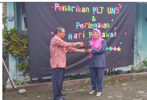
Gambar 6. Penyerahan Kenang-kenangan dan Ucapan Terimakasih