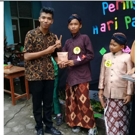
Gambar . Pembagian Hadiah Kelas Terkompak, Terkreatif dan Terunik