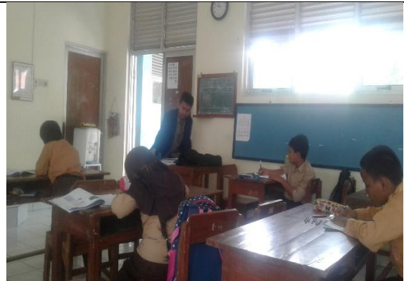
Gambar . Praktik Mengajar Mandiri