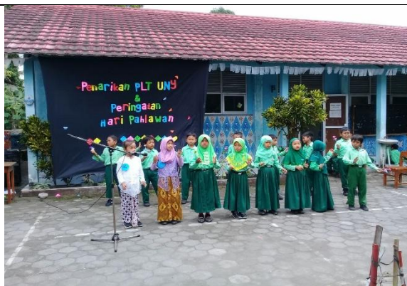
Gambar . Penampilan Menyanyi Guruku Tersayang