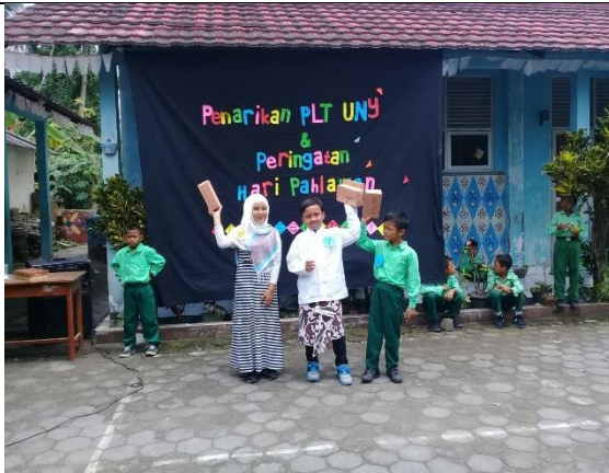
Gambar . Pemenang Duta Pahlawan