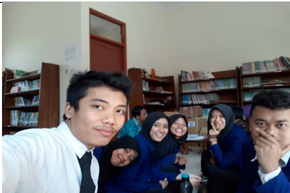
Gambar . Diskusi Team PLT