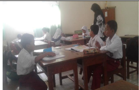
Gambar . Observasi Kegiatan Pembelajaran