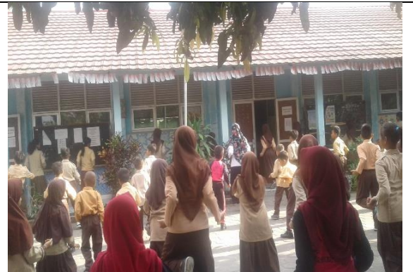
Gambar . Senam Setiap Hari Jumat