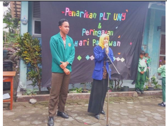
Gambar . Juri Duta Pahlawan