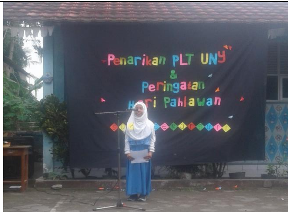
Gambar . Peserta Duta Pahlawan Kelas 5