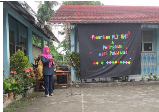
Gambar . Pelepasan Mahasiswa PLT dari Pihak Sekolah