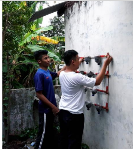
Gambar . Pembuatan Tanaman Gantung Dari Botol Bekas