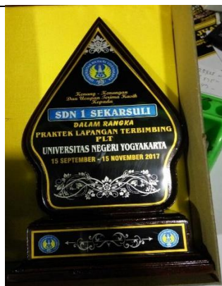
Gambar . Kenang-kenangan dari Mahasiswa PLT