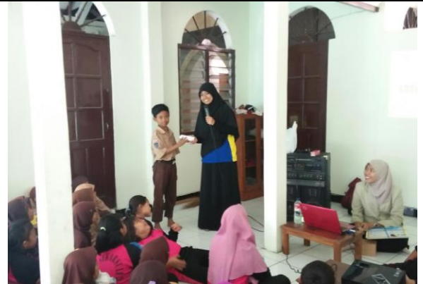
Gambar . Pemberian Hadiah Bagi Siswa yang Berhasil Menjawab Pertanyaan