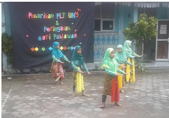
Gambar . Penampilan Tari Rena