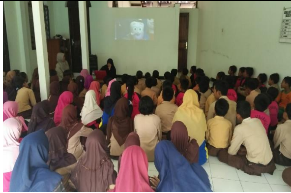
Gambar . Penyampaian Materi “Merawat Gigi” oleh Mahasiswi UGM