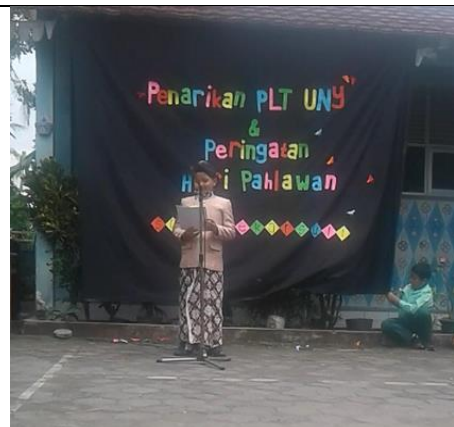
Gambar . Peserta Duta Pahlawan Kelas 4