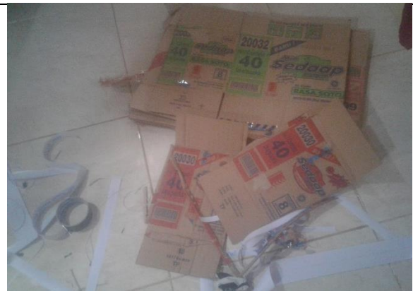
Gambar . Alas Bingkai Slogan