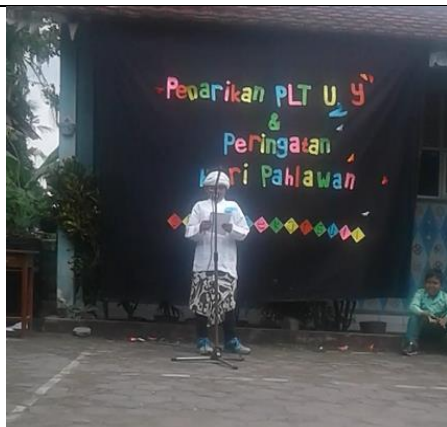
Gambar . Peserta Duta Pahlawan Kelas 3