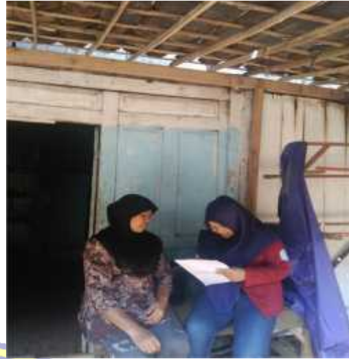
Gambar wawancara di Desa Tlogopucang dan Desa Caruban