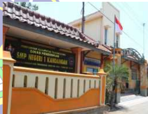
Gambar salah satu Sarana Pendidikan yang ada di Desa Tlogopucang dan