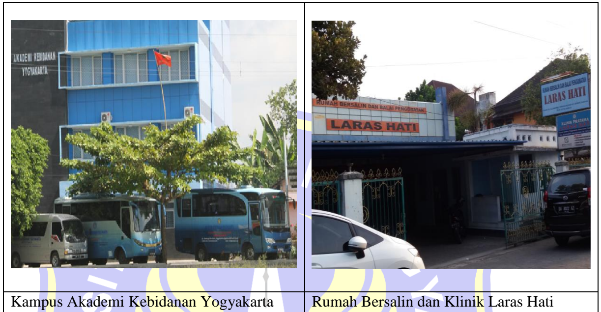
Gambar 3.1 Suasana Kampus Akademi Kebidanan Yogyakarta