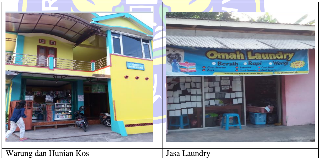
Warung dan Hunian Kos