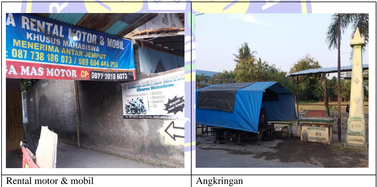
Gambar 4.4 Suasana Ruang Usaha Milik Penduduk