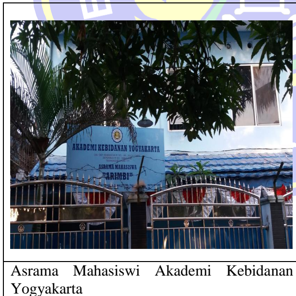
Gambar 3.2 Suasana Kampus Akademi Kebidanan Yogyakarta