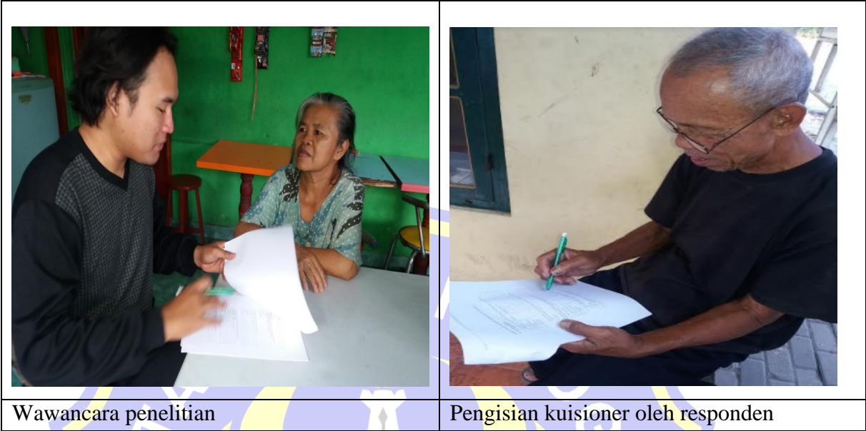
Gambar 6. Suasana pengumpulan data