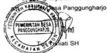
Gambar 6. Surat Izin Penelitian Desa Panggungharjo