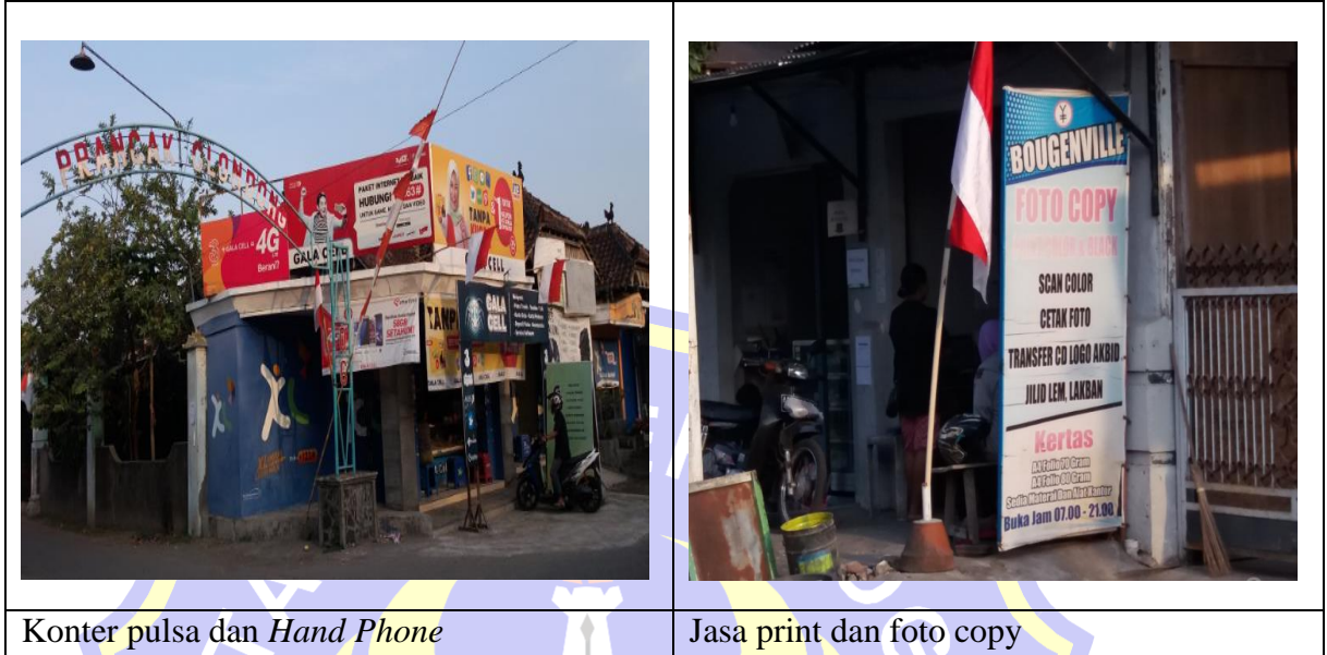
Gambar 4.3 Suasana Ruang Usaha Milik Penduduk