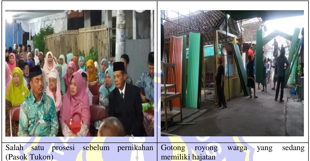
Gambar 5.1 Suasana pelaksanaan kebudayaan dan interaksi sosial penduduk