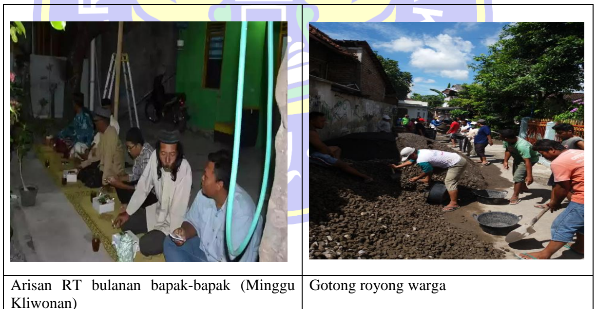
Gambar 5.2 Suasana pelaksanaan kebudayaan dan interaksi sosial penduduk