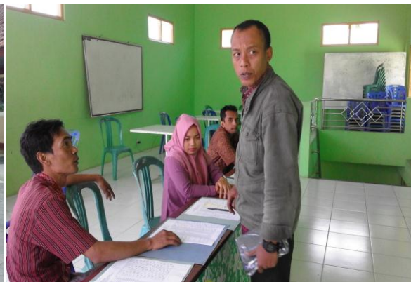
Gambar 8. Kegiatan Administrasi