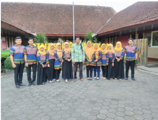
Gambar 7. Penarikan Mahasiswa PPL