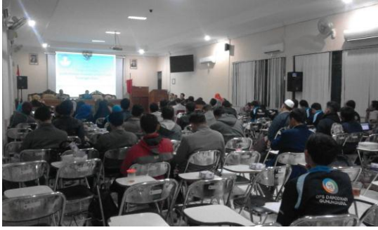
Gambar 9. Asistensi pangkalan data pendidikan