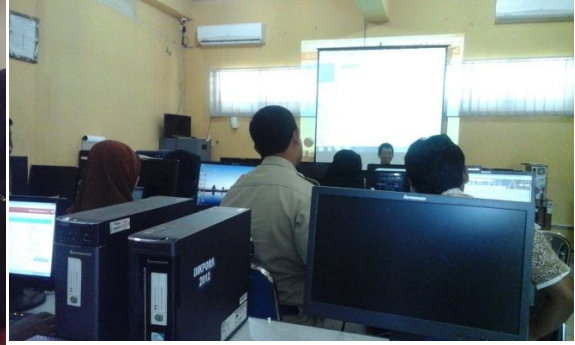
Gambar 2. Asistensi Pangkalan Data Pendidikan DIKMAS