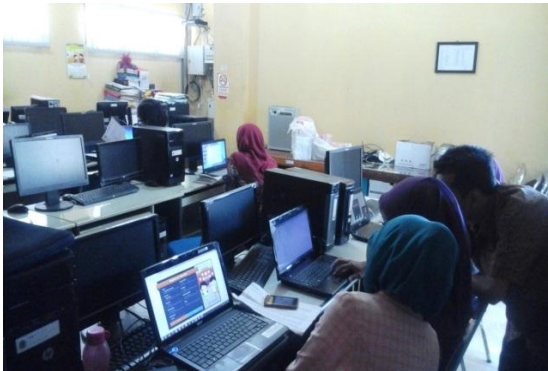
Gambar 3. Membantu Operator Sekolah Menginstal Aplikasi Dapodik Versi Terbaru