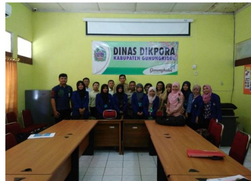
Gambar 6. Kunjungan Dosen Jurusan AP ke Disdikpora Gunungkidul