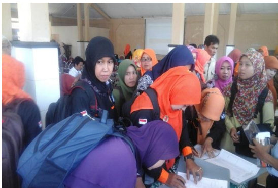
Gambar 5. Absensi dan Pembagian ATK pada kegiatan asistensi