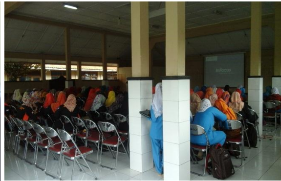
Gambar 4. Asistensi Pangkalan Data Pendidikan PAUD