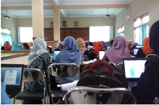
Gambar 1. Pelatihan TI Operator PAUD