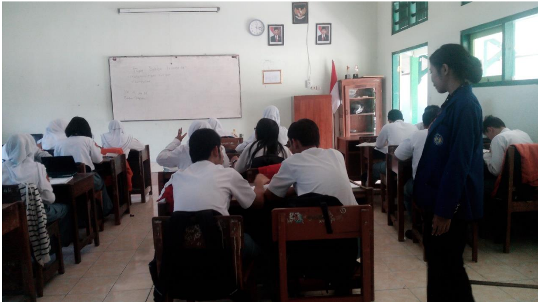
b. Suasana KBM di kelas XI IPS 3