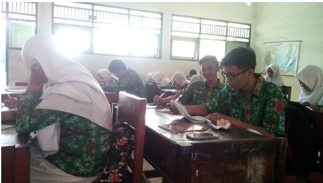
c. Saat pendampingan mengajar di kelas XI IPS 4