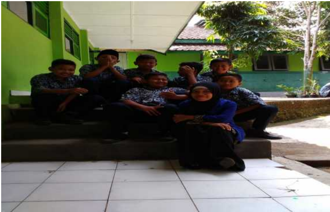
Siswa putra kelas VII