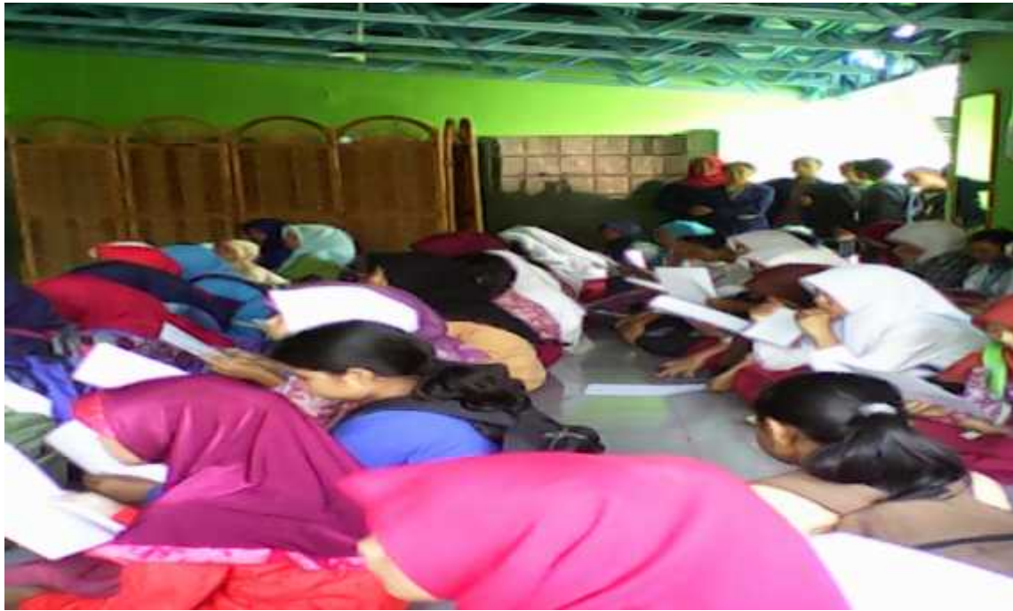
Salah satu kegiatan Masa Pengenalan Lingkungan Sekolah