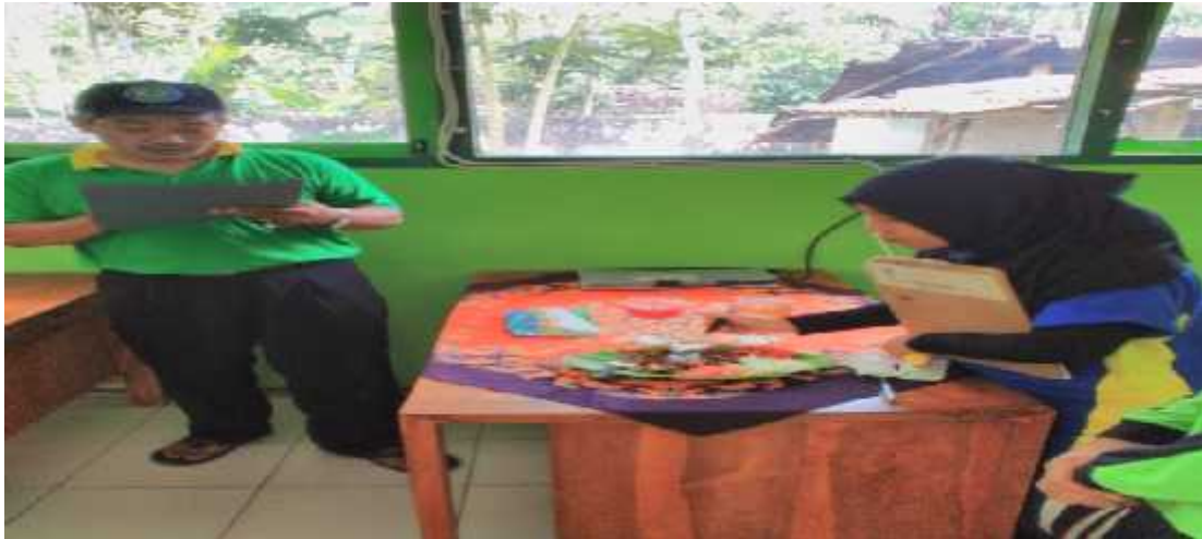
Penilaian lomba memasak daging sapi kurban di hari Idul Adha