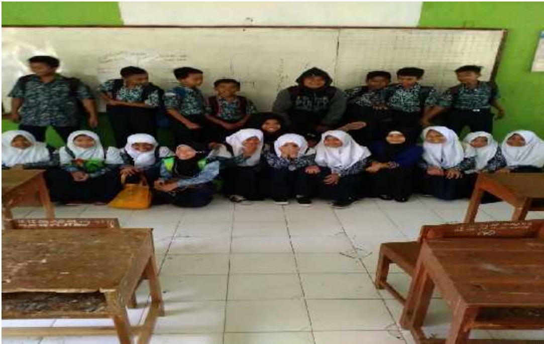
KELAS VII C