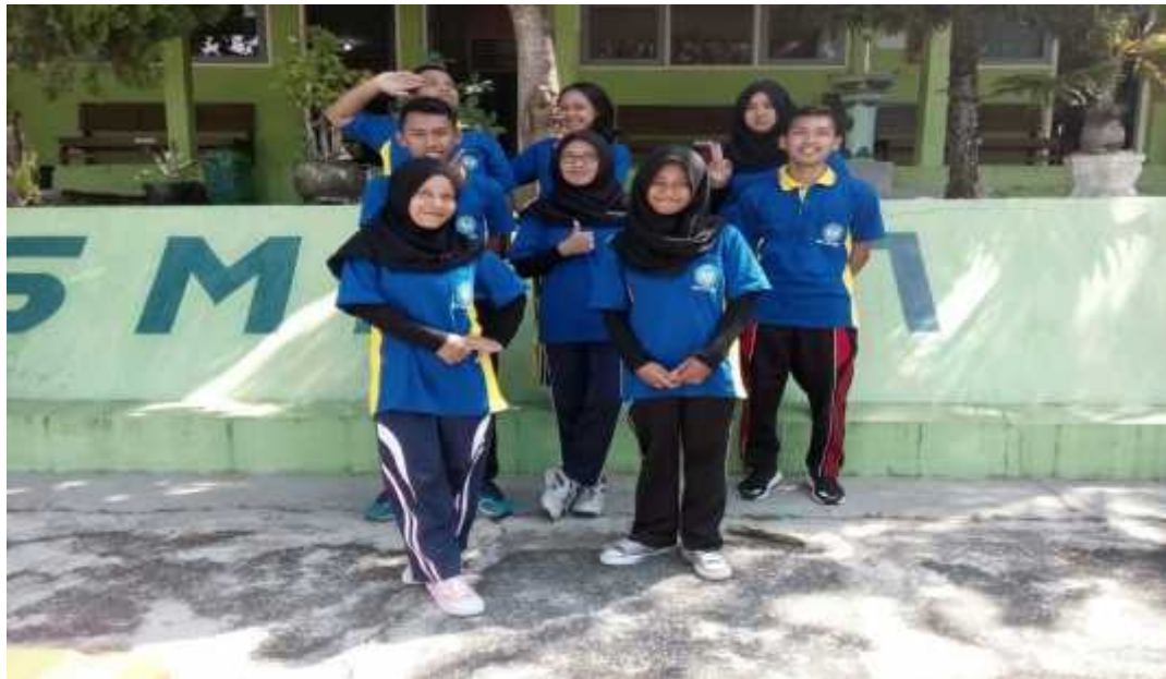
pasca kegiatan Masa pengenalan lingkungan sekolah/outbond