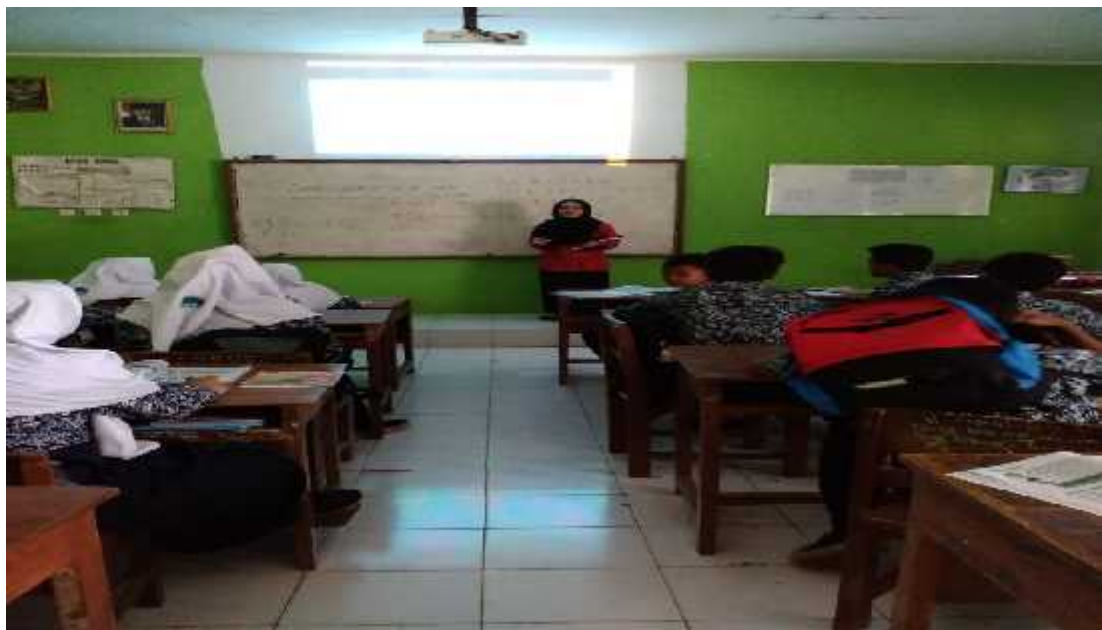
Kegiatan belajar mengajar di kelas VII