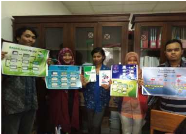
Gambar 04. Pengumpulan penugasan, diantaranya adalah buku panduan layanan kontak kami.