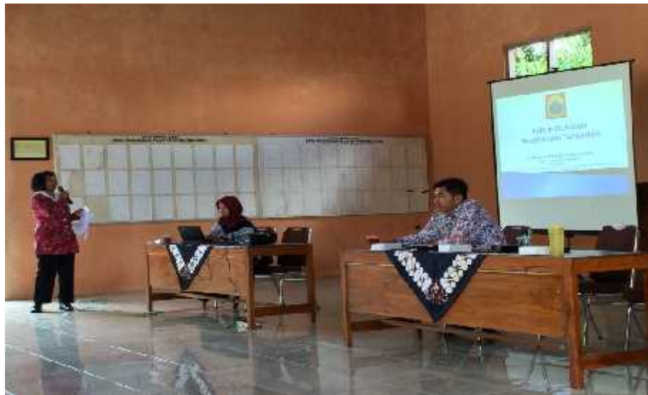
Gambar 23. Kegiatan pendampingan sosialisasi UU PPA yang dilaksanakan di Balai Desa Bleberan