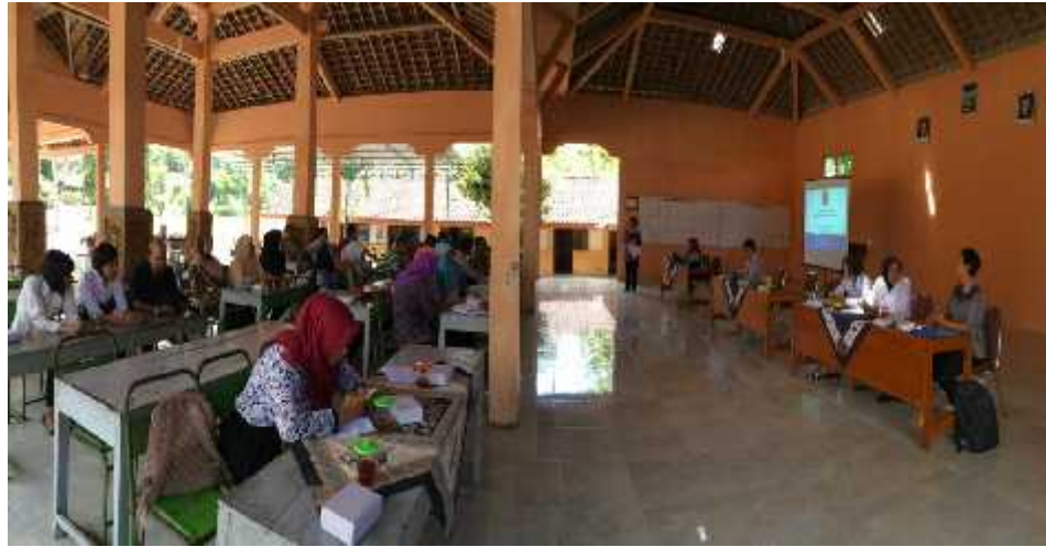
Gambar 24. Suasana kegiatan sosialisasi UU PPA di Desa Bleberan bersama dengan pihak UPPA Polsek Gunungkidul.