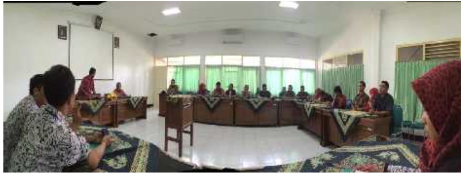
Gambar 22. Suasana penerimaan kunjungan BPMPD Bangka Tengah di Ruang Rapat BPMPKB