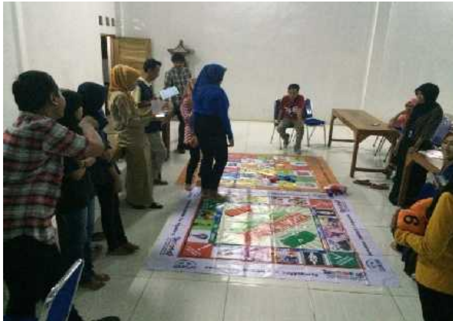
Gambar 07. Pendampingan Kader PIK-R Cendekia Remaja Desa Baleharjo dalam kegiatan simulasi permainan edukatif (ular tangga dan monopoli GenRe)