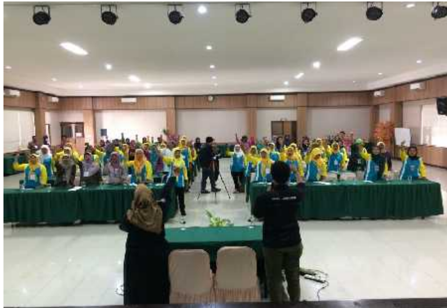
Gambar 17. Mahasiswa PPL saat melaksanakan pengkondisian peserta dalam Jambore Posyandu untuk program Pengembangan Minat dan Bakat Kader Posyandu di Hotel Griya Persada, Kaliurang