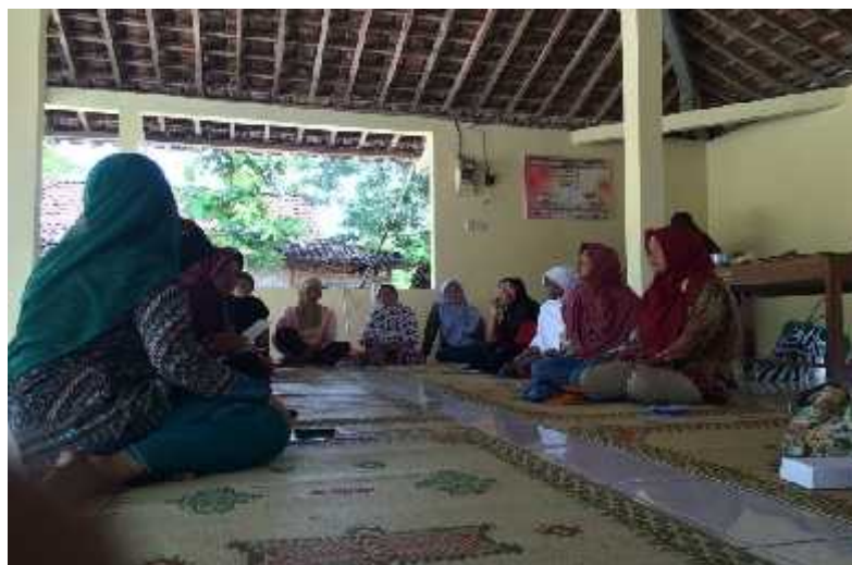
Gambar 19. Suasana pelatihan kelompok perempuan di Desa Dadapayu, Kec.Semanu