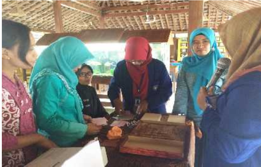
a. Pendampingan kegiatan pelatihan kader BKB, BKR, dan BKL.