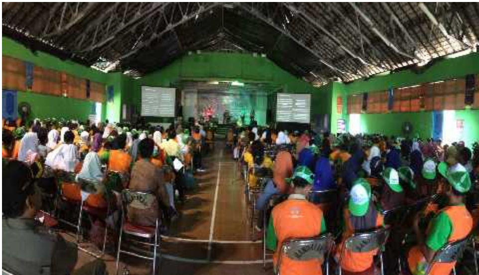
Gambar 13. Suasana di dalam Gedung Kesenian Baleharjo dalam diskusi musikal bersama Simponi Band dengan peserta para anak usia SD, SMP, SMA sederajat se-Gunungkidul