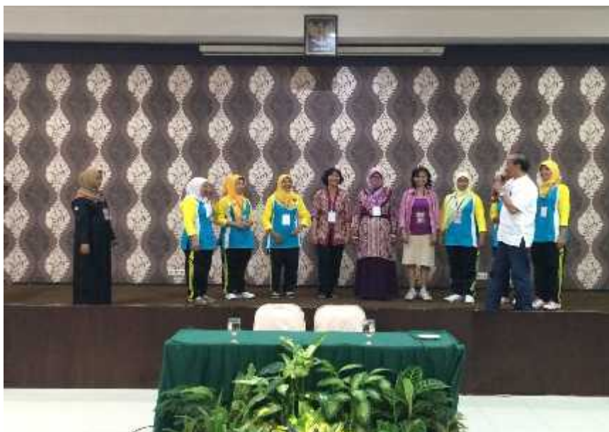
Gambar 18. Suasana penampilan tim dalam Lomba Kreasi Lagu Edukatif Kader Posyandu dengan panitia dan juri oleh Mahasiswa PPL di Jambore Posyandu