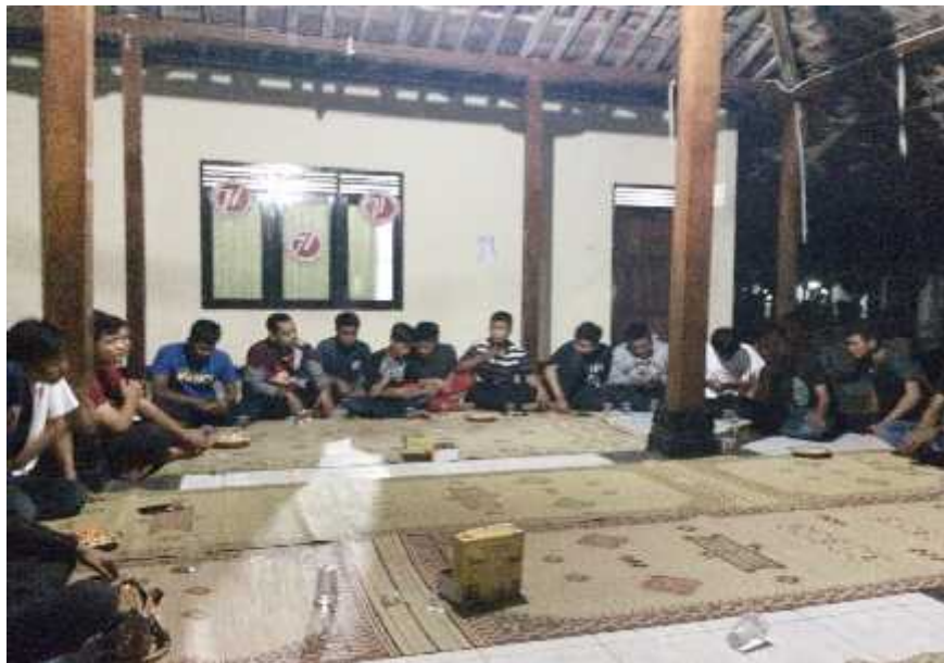
Gambar 05. Suasana dalam kampanye PUP (Pendewasaan Usia Perkawinan) bagi pemuda di Padukuhan Purbosari