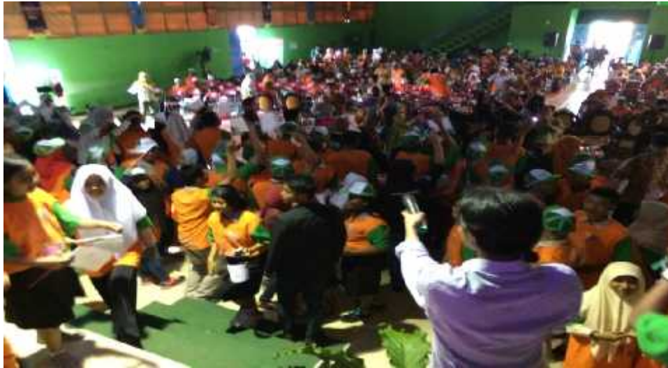
Gambar 14. Euforia diskusi musikal yang merupakan prakarsa dari Kementerian Pemberdayaan Perempuan dan Perlindungan Anak bekerjasama dengan BPMPKB Kabupaten Gunungkidul