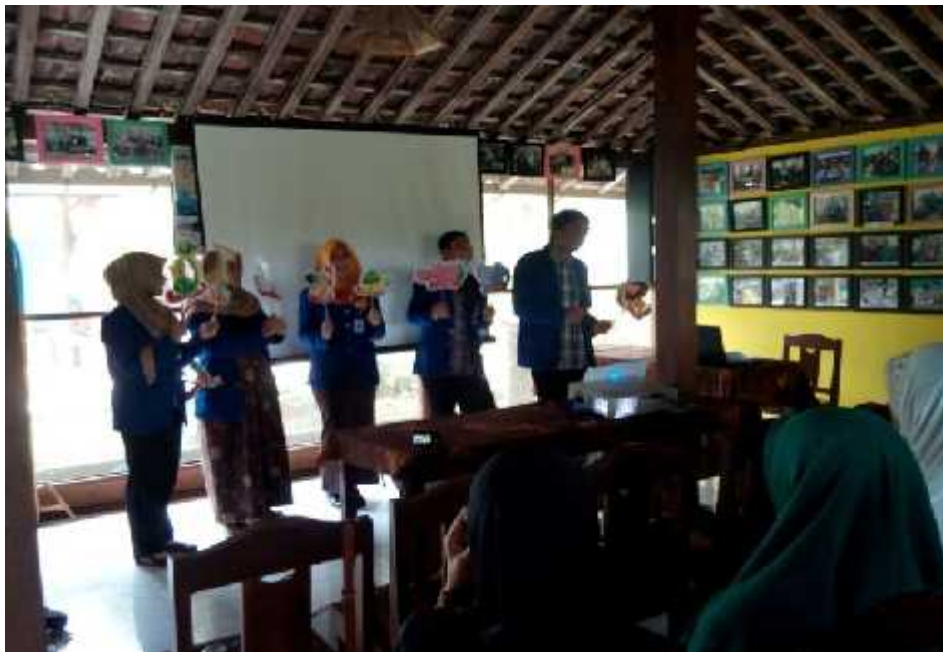
Gambar 15. Mahasiswa PPL menampilkan demonstrasi permainan wayang hewan dari kertas dengan judul cerita “TK Ceria” sebagai metode pembelajaran di hadapan para Kader BKB.