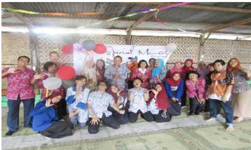
Gambar 03. Foto bersama PPL dan keluarga besar BPMPKB Kabupaten