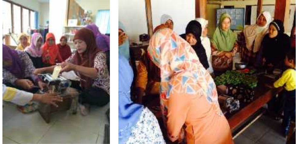
Gambar 21. Proses memasak dalam acara pelatihan kelompok perempuan di Desa Ngalang dan Desa Kepek