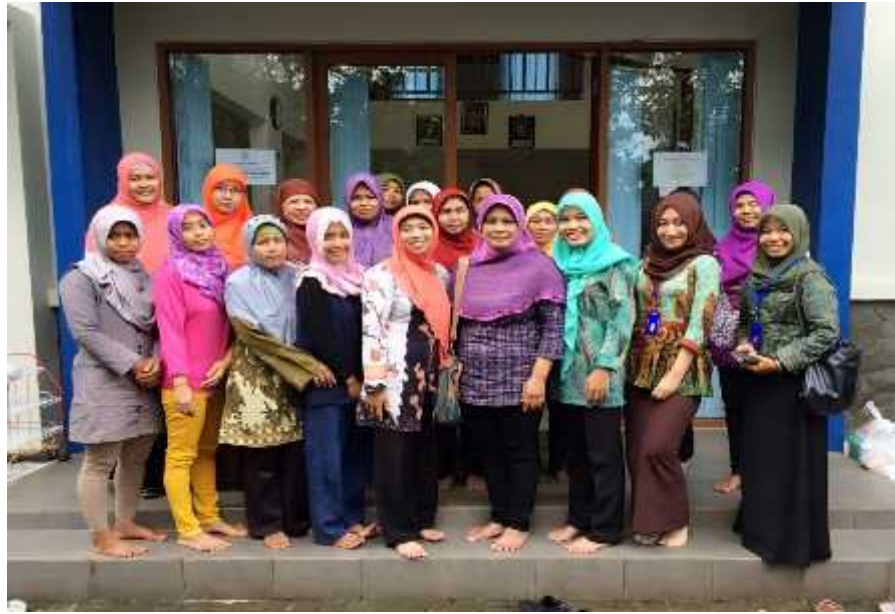
Gambar 20. Foto bersama dengan peserta pelatihan kelompok perempuan di Desa Ngalang, Kec. Gedangsari.