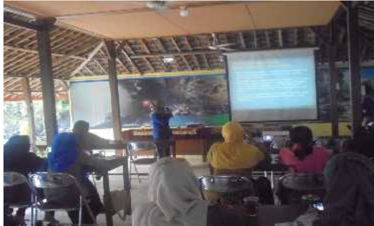
Gambar 16. Mahasiswa PPL menyampaikan materi tentang teknik komunikasi lansia dalam program penyuluhan Kader BKL di RM Bu Tiwi Tan Tlogo, Semanu