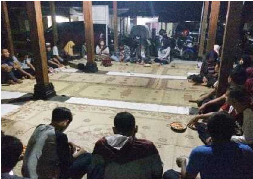
Gambar 06. Mahasiswa PPL menjadi pelaksana sekaligus narasumber dalam kegiatan kampanye PUP di Balai Padukuhan Purbosari