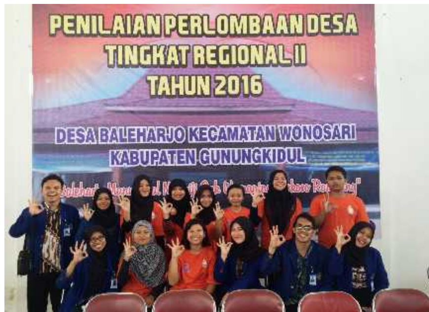
Gambar 09. Foto bersama PPL dan PIK-R Cendekia Remaja Desa