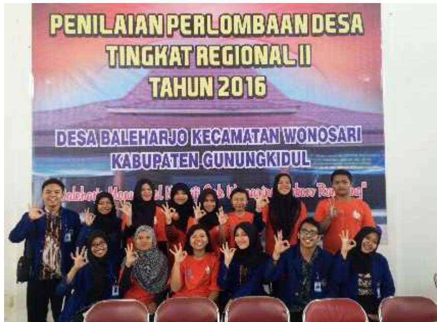
Gambar 10. Foto bersama PPL dan PIK-R Cendekia Remaja Desa Baleharjo se usai penilaian lomba desa tingkat regional