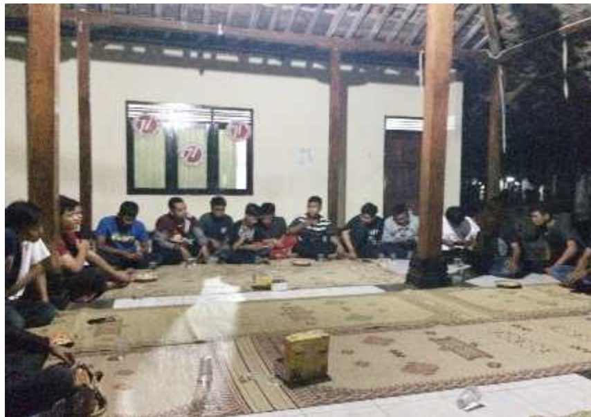
Gambar 07. Suasana dalam kampanye PUP (Pendewasaan Usia Perkawinan) bagi pemuda di Padukuhan Ringinsari