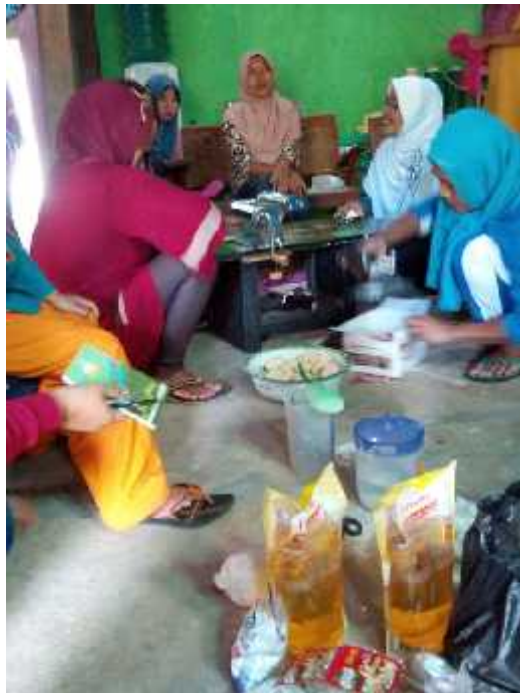
Gambar 24. Ibu-ibu KTW Sedyo Maju sedang mempraktekkan pembuatan olahan stik dari tepung mocaf