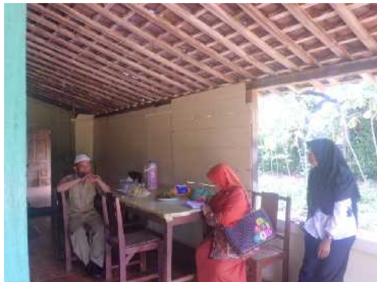
Gambar 20. Visitasi lapangan di sampel rumah sehat dalam pendampingan lomba P2WKSS di dusun Paliyan Lor, desa Karangduwet, kecamatan Paliyan