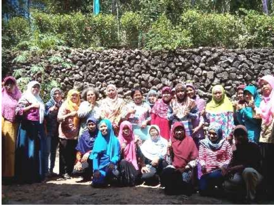
Gambar 25. Foto bersama seusai praktek ketrampilan memasak