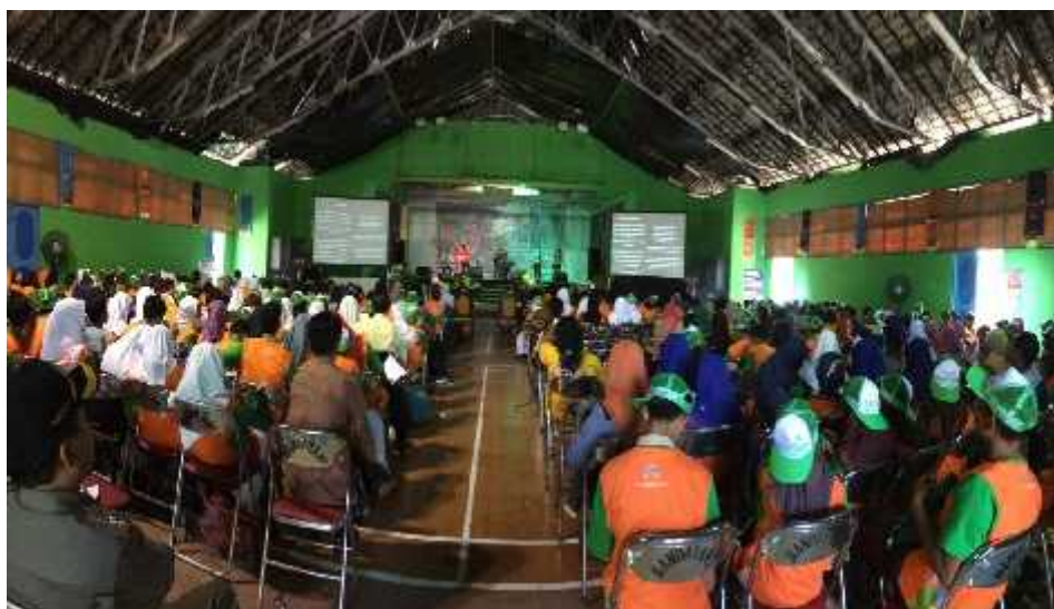
Gambar 14. Suasana di dalam Gedung Kesenian Baleharjo dalam diskusi musikal bersama Simponi Band dengan peserta para anak usia SD, SMP, SMA sederajat se-Gunungkidul