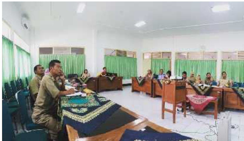
Gambar 22. Rakor APE (Anugerah Parahita Ekapraya) untuk mengevaluasi pembangunan pemberdayaan perempuan dan perlindungan anak dijadikan acuan pemerintah Kabupaten Gunungkidul