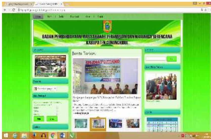
Gambar 06. Screenshoot tampilan hasil revitalisasi website BPMPKB Kabupaten Gunungkidul