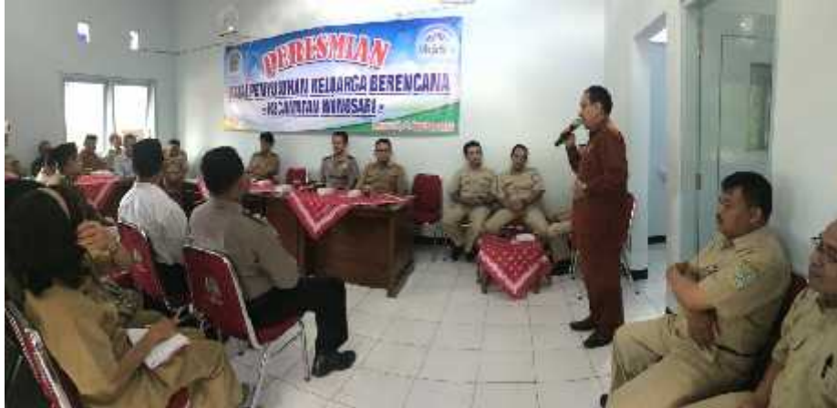
Gambar 23. Peresmian Gedung PKB Kecamatan Wonosari oleh Kepala BPMPKB Kabupaten Gunungkidul