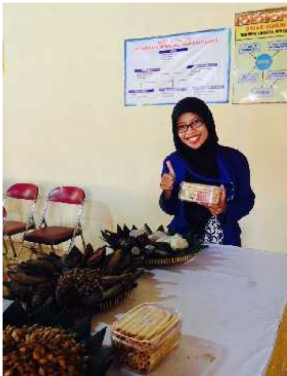
Gambar 17. Saat mendampingi pameran produk unggulan UPPKS Rejosari