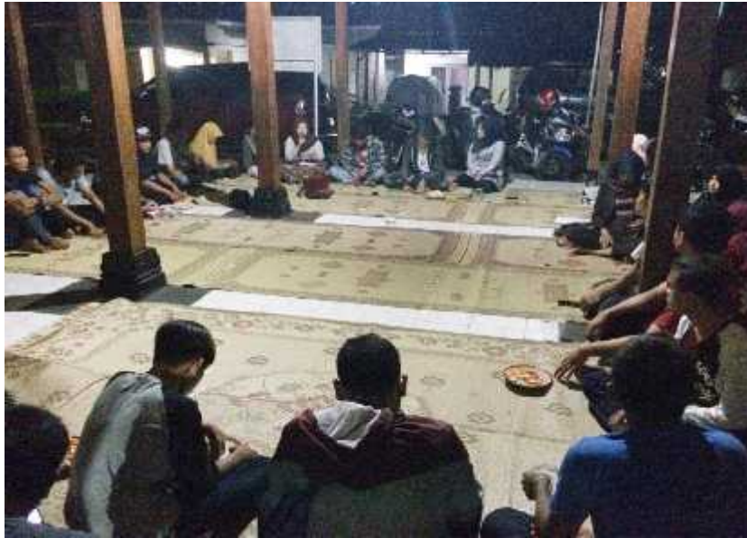
Gambar 08. Mahasiswa PPL menjadi pelaksana sekaligus narasumber dalam kegiatan kampanye PUP di Balai Padukuhan Jeruksari