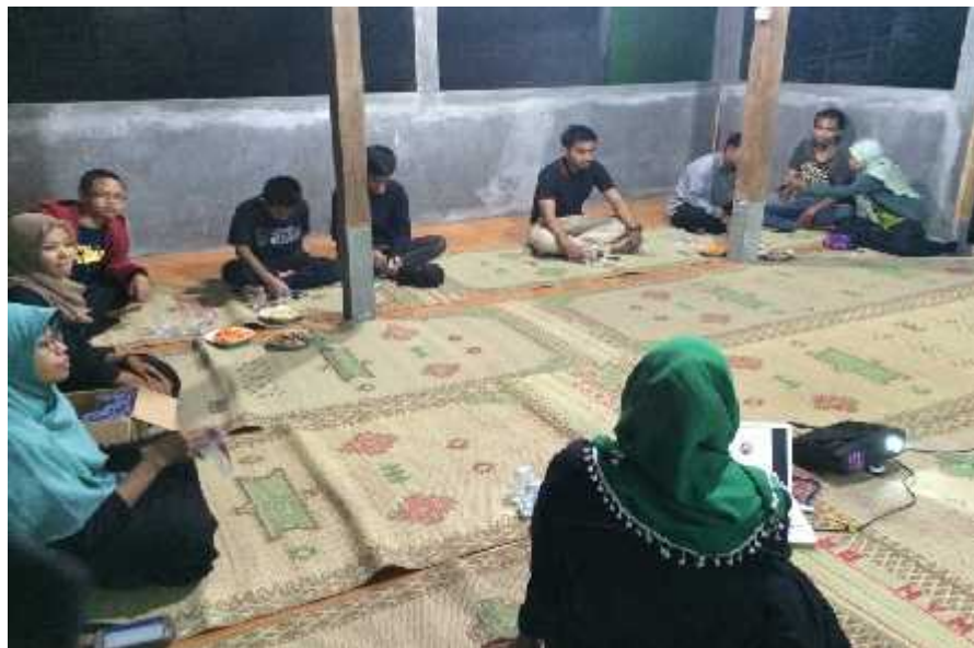
Gambar 03. Penyuluhan Kader PIK-R Cendekia Remaja Desa Baleharjo dengan materi Pendewasaan Usia Pernikahan (PUP)