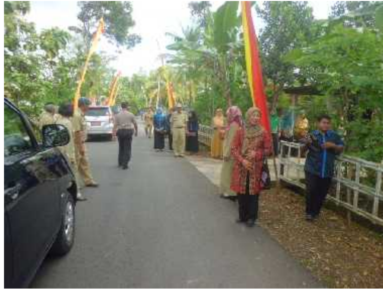
Gambar 18. Penyambutan Tim Penilaian PKK Tingkat Propinsi di Desa Ngunut, Playen