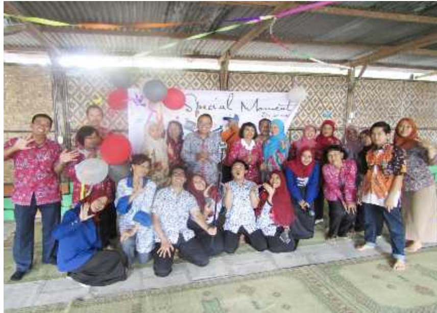
Gambar 05. Foto bersama PPL dan keluarga besar BPMPKB Kabupaten Gunungkidul