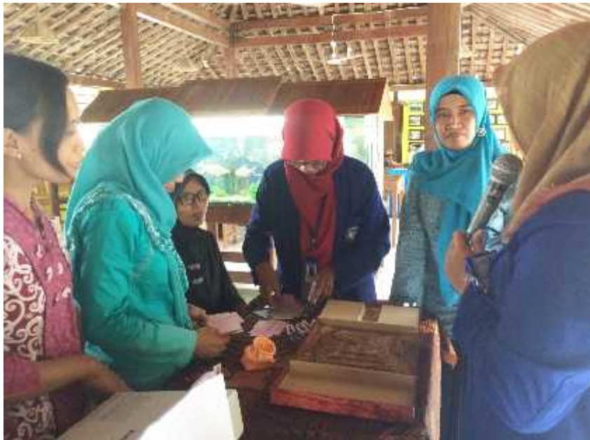
Gambar 09. Pendampingan dalam demonstrasi permainan Kalang Suluk bagi Kader BKB