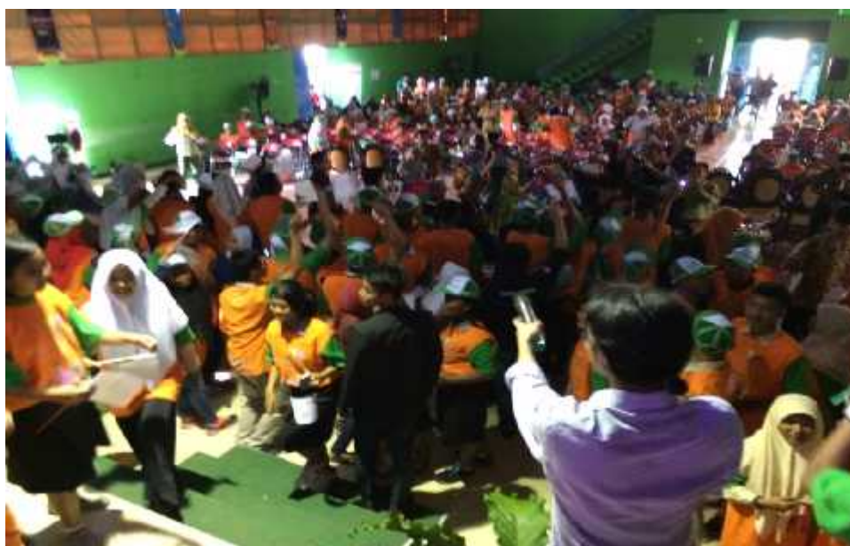
Gambar 15. Euforia diskusi musikal yang merupakan prakarsa dari Kementerian Pemberdayaan Perempuan dan Perlindungan Anak bekerjasama dengan BPMPKB Kabupaten Gunungkidul