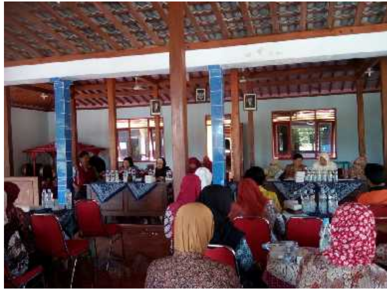
Gambar 21. Penguatan penyusunan administrasi P2WKSS oleh BPMPKB Bidang Pemberdayaan Perempuan dan Tim Penggerak PKK Kabupaten Gunungkidul di Balai Desa Karangduwet, Paliyan