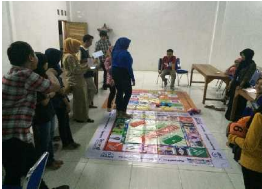
Gambar 02. Pendampingan Kader PIK-R Cendekia Remaja Desa Baleharjo dalam kegiatan simulasi permainan edukatif (ular tangga dan monopoli GenRe)