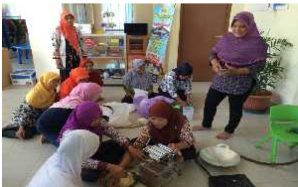
Gambar 13. Foto Pendampingan Pelatihan Kelompok Perempuan di Gedangsari

Ibu-ibu kader PKK mengikuti pelatihan mengolah bahan lokal stik ubi ungu, lanting singkong, dan puding jagung.