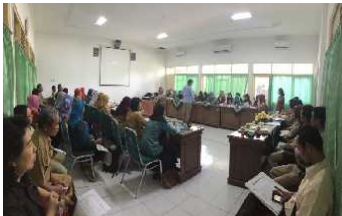
Gambar 21. Foto Pendampingan Rapat YAKKUM

Pelaksanaan rapat YAKKUM, yang diikuti oleh perwakilan desa dari kelompok wanita tangguh di Kab. Gunungkidul