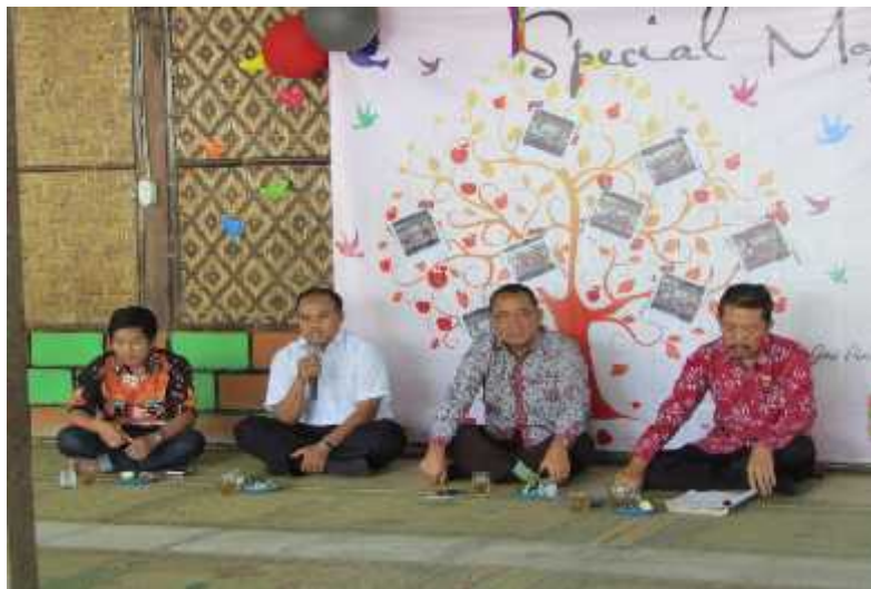
Gambar 02. Foto Perpisahan