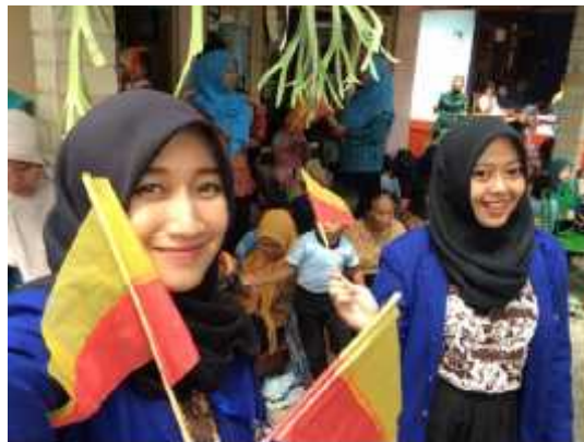
Gambar 11. Foto Pendampingan BKB Padukuhan Wukirsari

Pendampingan penilaian lomba desa Baleharjo bersama kader Bina Keluarga Balita di Padukuhan Wukirsari