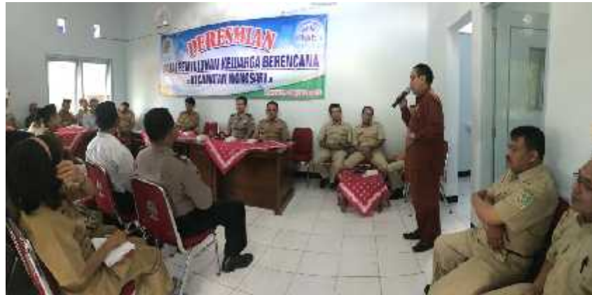
Gambar 19. Foto Pendampingan Peresmian Gedung PKB

Peresmian Gedung PKB di Kecamatan Patuk dan Kecamatan Wonosari