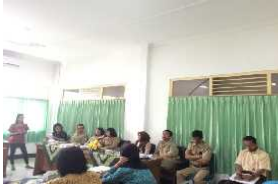
Penyusunan buku analisis gender bekerjasama dari Pusat Studi Wanita Universitas Gajahmada (PSW UGM)