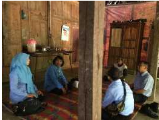
Pendampingan dan monitoring korban kekerasan seksual bersama bidang pemberdayaan perempuan (PP) di Ponjong