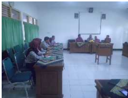
Mahasiswa mendampingi penyambutan kunjungan BPMPD Bangka Tengah di Ruang Rapat Bangsal Sewoko Projo