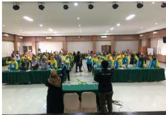
Gambar 09. Foto Pendampingan Jambore Posyandu

Mahasiswa PPL saat melaksanakan pengkondisian peserta dalam Jambore Posyandu untuk program Pengembangan Minat dan Bakat Kader Posyandu di Hotel Griya Persada, Kaliurang