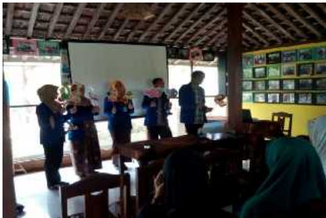
Mahasiswa PPL menampilkan demonstrasi permainan wayang hewan dari kertas dengan judul cerita “TK Ceria” sebagai metode pembelajaran di hadapan para Kader BKB.