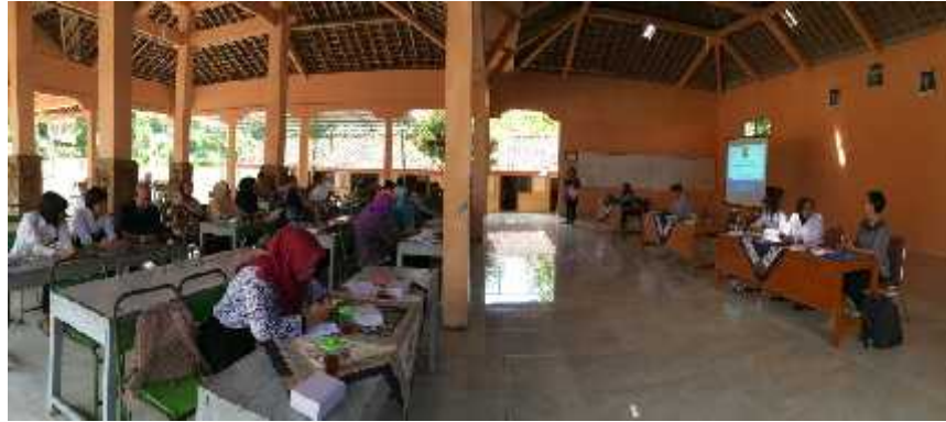
Gambar 18. Foto Sosialisasi UU PPA

Mensosialisasikan tentang UU PPA yang telah diberlakukan di Kabupaten Gunungkidul bersama BPMPKB Bidang Pemberdayaan Perempuan dan Polres Wonosari