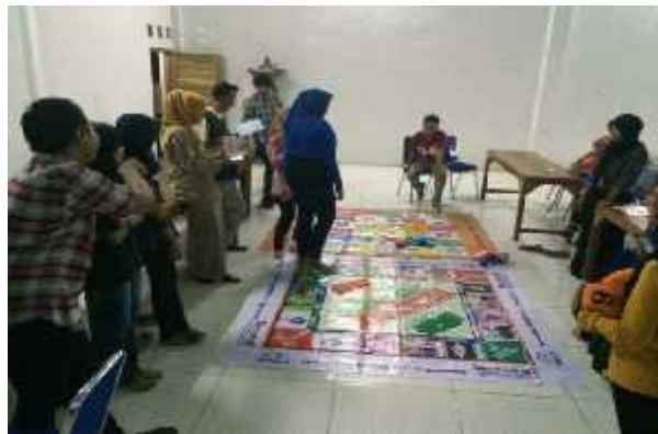
Pendampingan Kader PIK-R Cendekia Remaja Desa Baleharjo dalam kegiatan simulasi permainan edukatif (ular tangga dan monopoli GenRe)