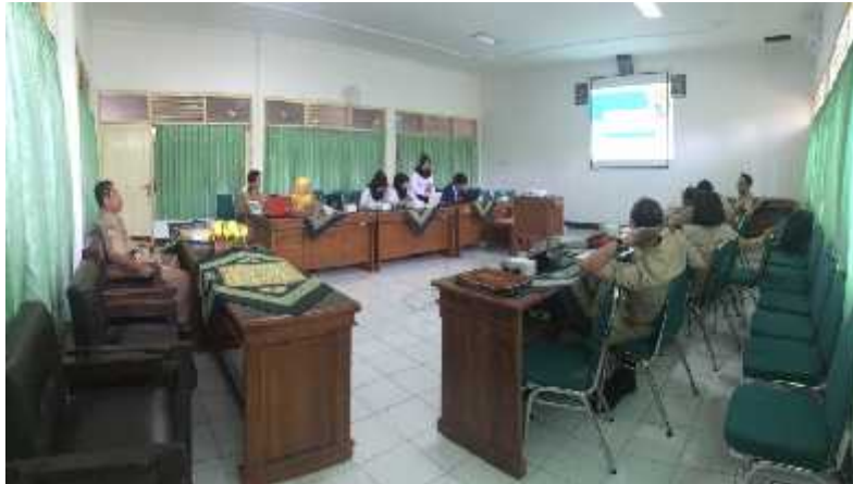
Pemaparan program inovasi pelayanan publik oleh PPL UNY