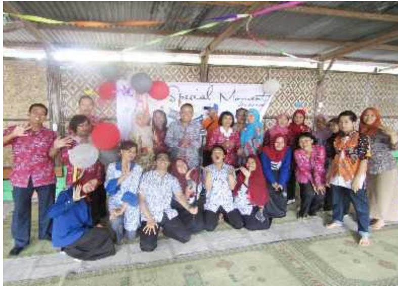
Foto bersama PPL dan keluarga besar BPMPKB Kabupaten Gunungkidul