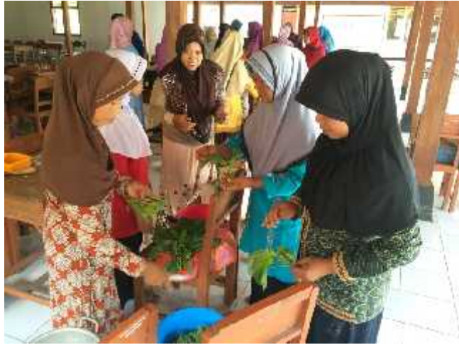
Gambar 20. Foto Pelatihan Kelompok Wanita

Mahasiswa mendampingi pelatihan mengolah bahan lokal di Playen. Ibu-ibu sedang praktek membuat kripik bayam