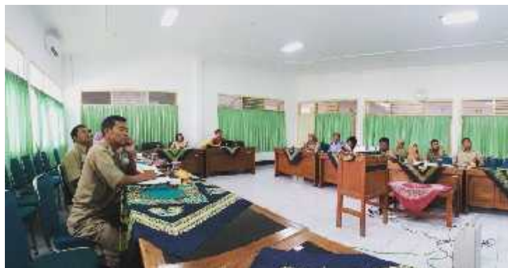
Rakor APE (Anugerah Parahita Ekapraya) untuk mengevaluasi pembangunan pemberdayaan perempuan dan perlindungan anak dijadikan acuan pemerintah Kab. Gunungkidul