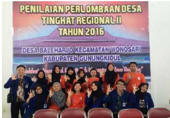
Foto bersama PPL dan PIK-R Cendekia Remaja Desa Baleharjo sesuai penilaian lomba desa tingkat regional