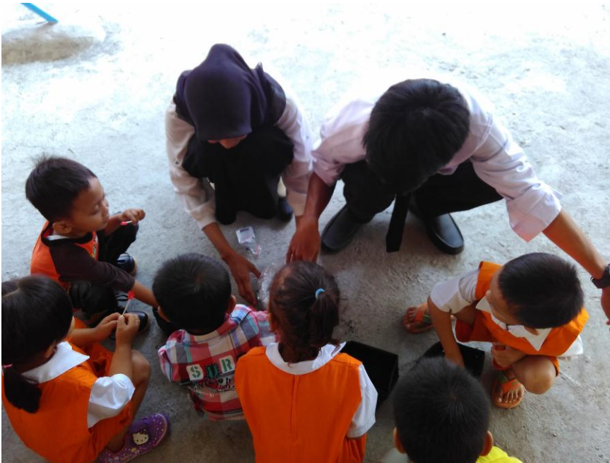
menanamkan sadar penghijauan