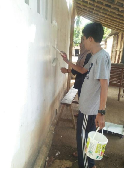
Penanaman sadar kebersihan lingkungan