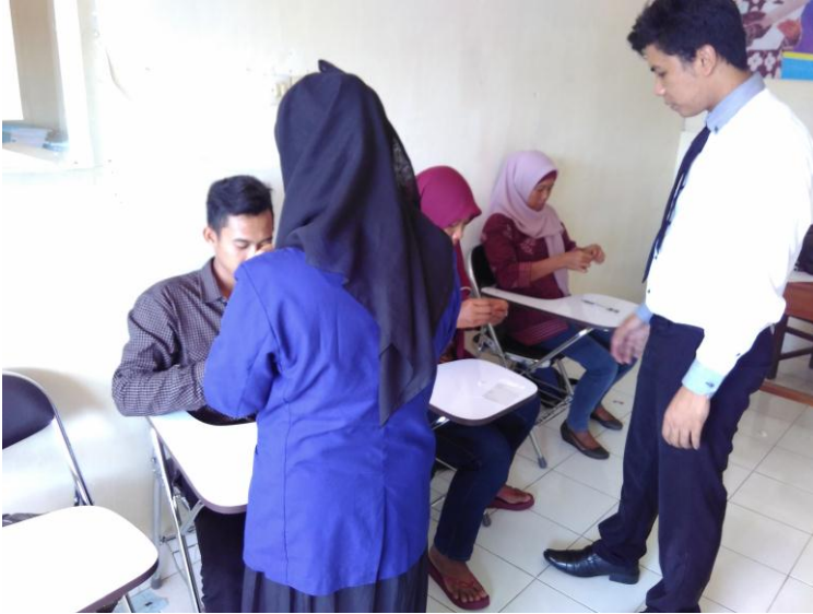
Pelatihan Pembuatan Bros