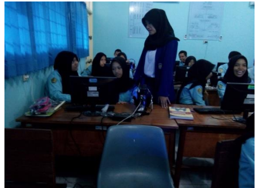
Kegiatan Belajar Mengajar di Laboratorium Bahasa