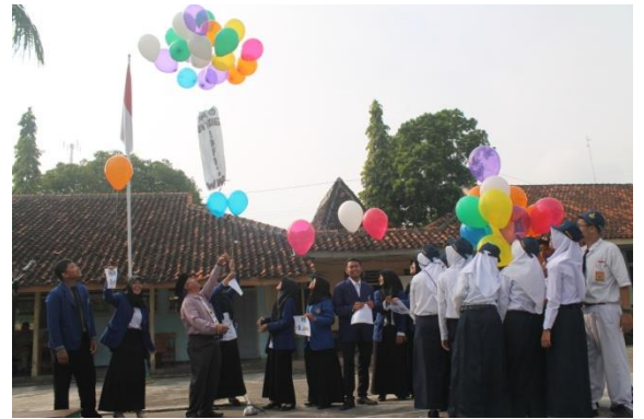
Upacara Bendera Hari Senin Sekaligus Pelepasan PPL UNY 2016 di SMP N 2 Wonosari