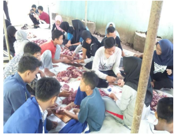
Peringatan Hari Raya Kurban Bersama OSIS, Guru, dan Mahasiswa PPL UNY