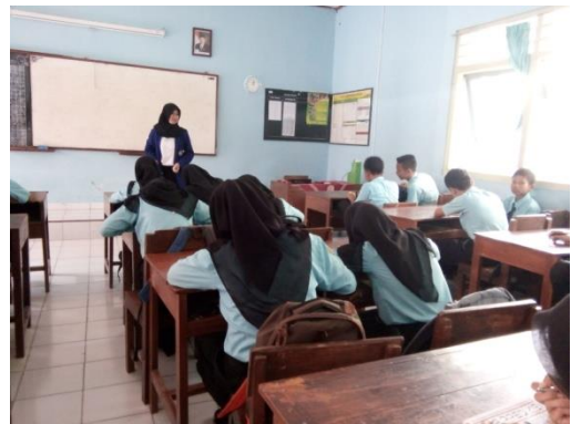
Kegiatan Belajar Mengajar di Kelas