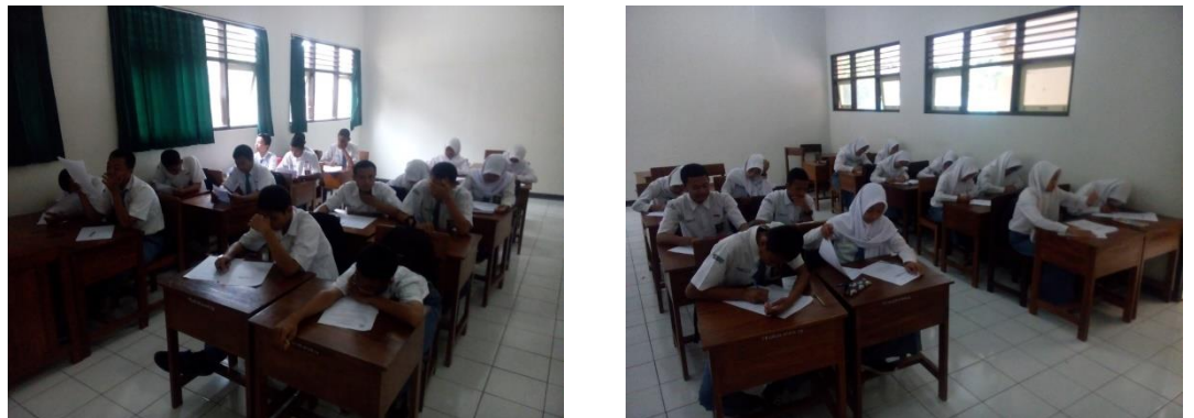
Gambar 2.3 Suasana Ulangan Harian

Evaluasi yang diberikan pada mata diktat yaitu latihan soal, evaluasi diakhir materi, perbaikan, dan keaktifan siswa dalam PBM.