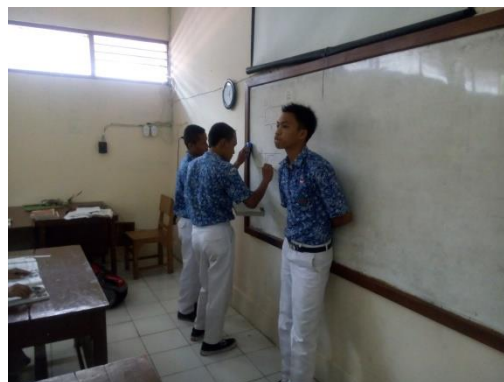
Gambar 2.1 Metode Diskusi

Metode yang digunakan selama kegiatan mengajar yakni penyampaian materi dengan metode ceramah, diskusi, tanya jawab, pemberian tugas, dan praktik.