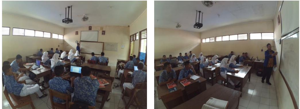
Gambar 2.2 mengajar menggunakan media white board

Media yang ada di SMK N 3 Wonosari sama dengan media yang ada di sekolah lain yaitu papan tulis ( white board ) dan menggunakan spidol, penggunaan alternative seperti penggunaan LCD viewer dalam penyampaian materi dapat dilakukan dengan baik.