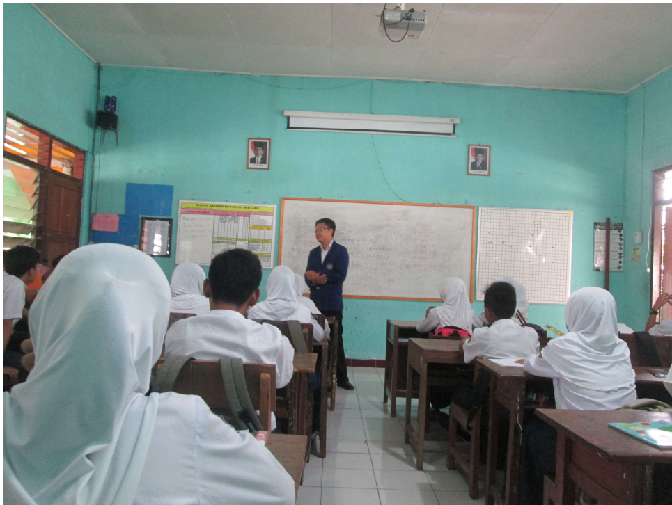
Gambar 2. Praktik Mengajar