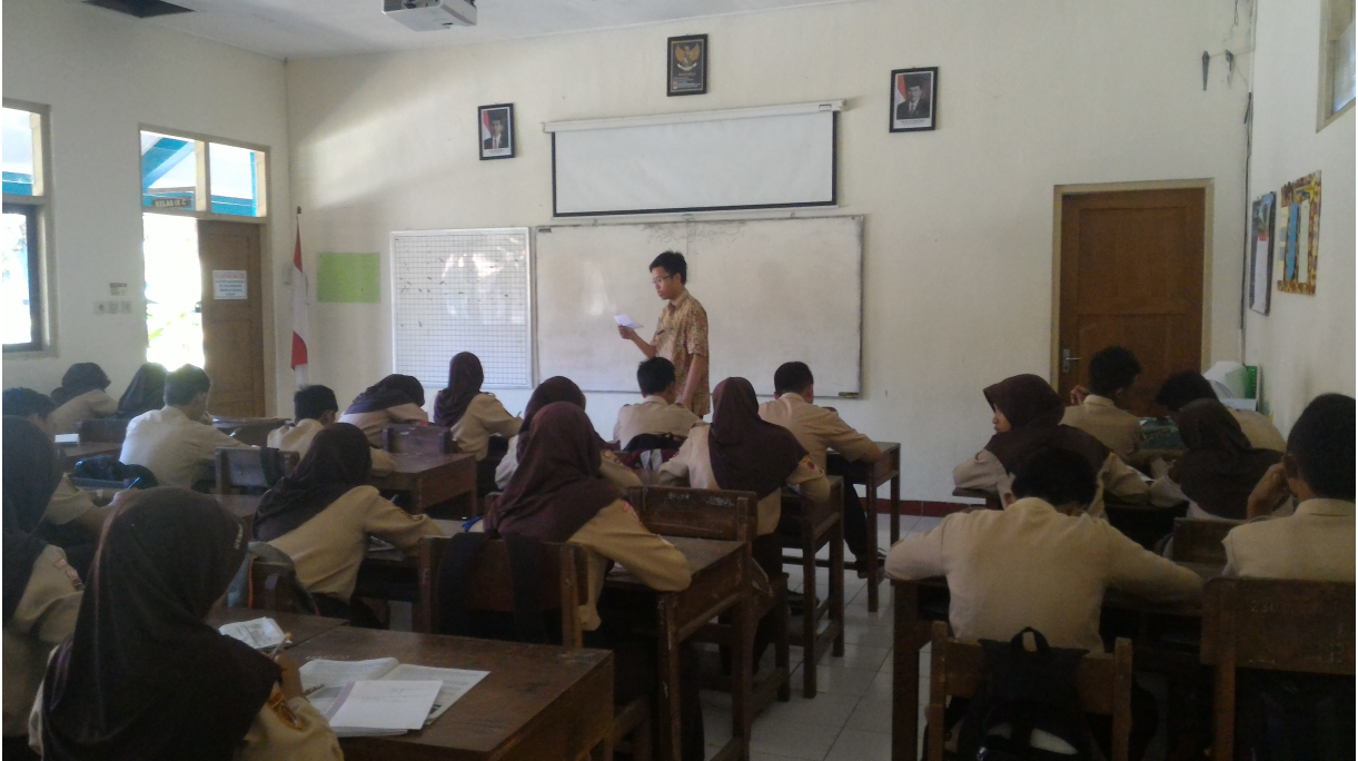
Gambar 3 dan 4. Piket Kelas (IX D)