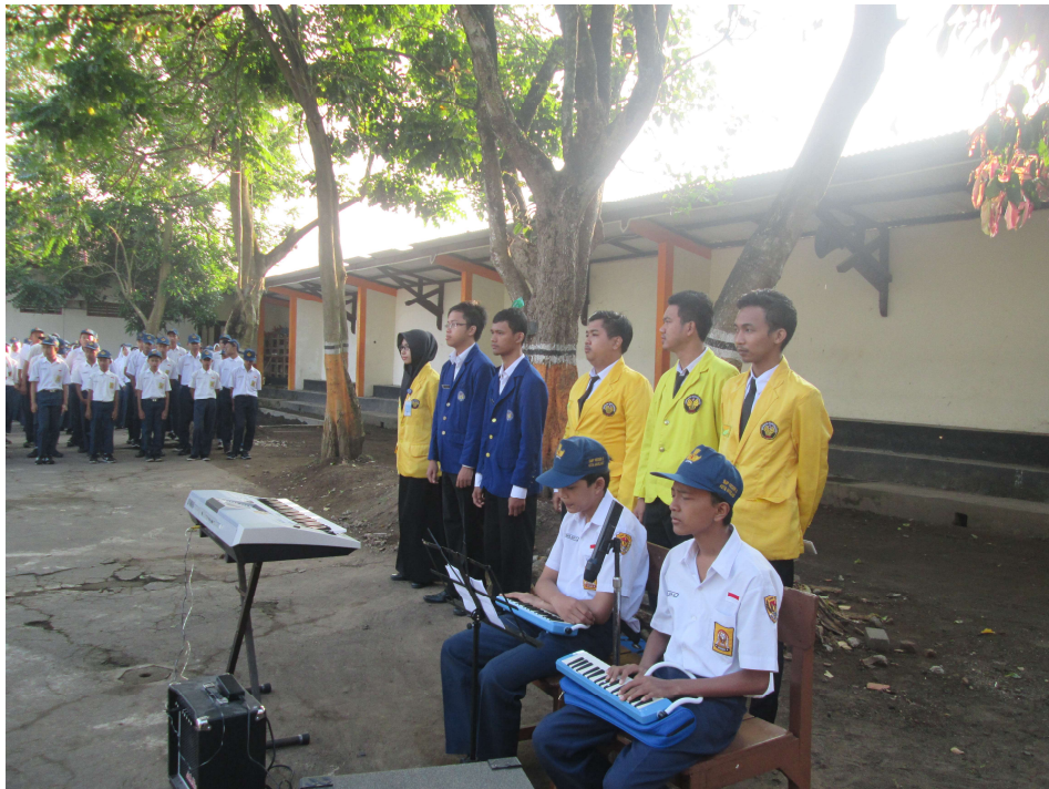
Gambar 9. Ansambel Musik Sekolah dan Paduan Suara dalam Upacara HUT RI ke 71