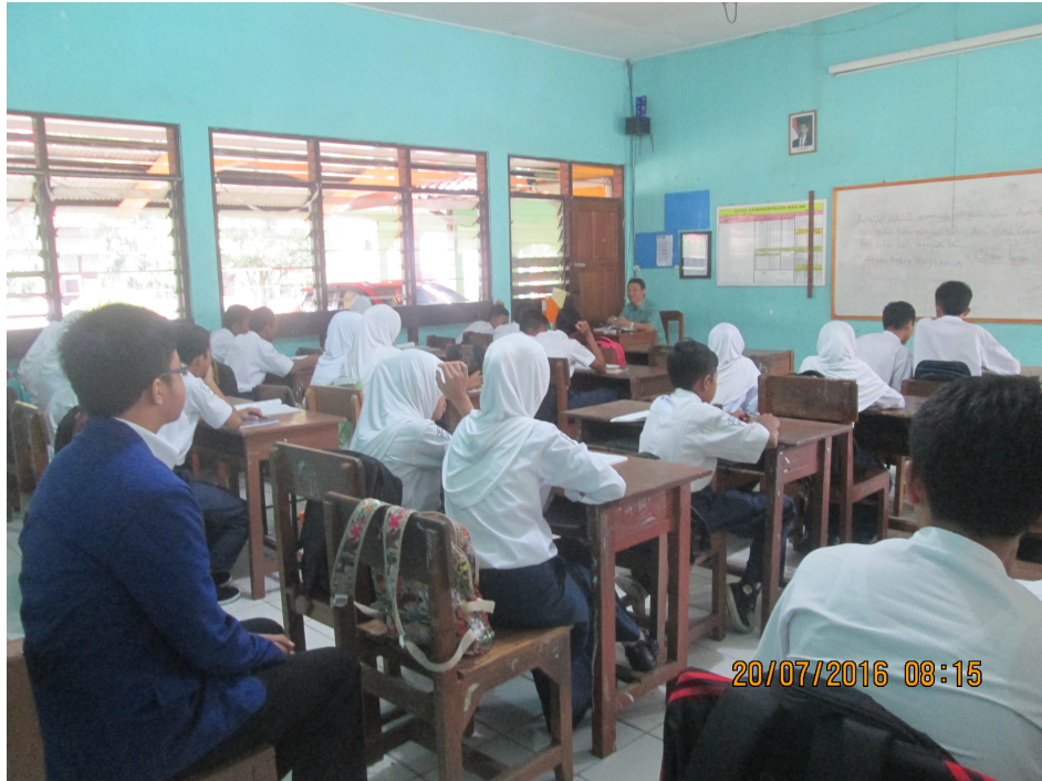
Gambar 1. Observasi Kelas