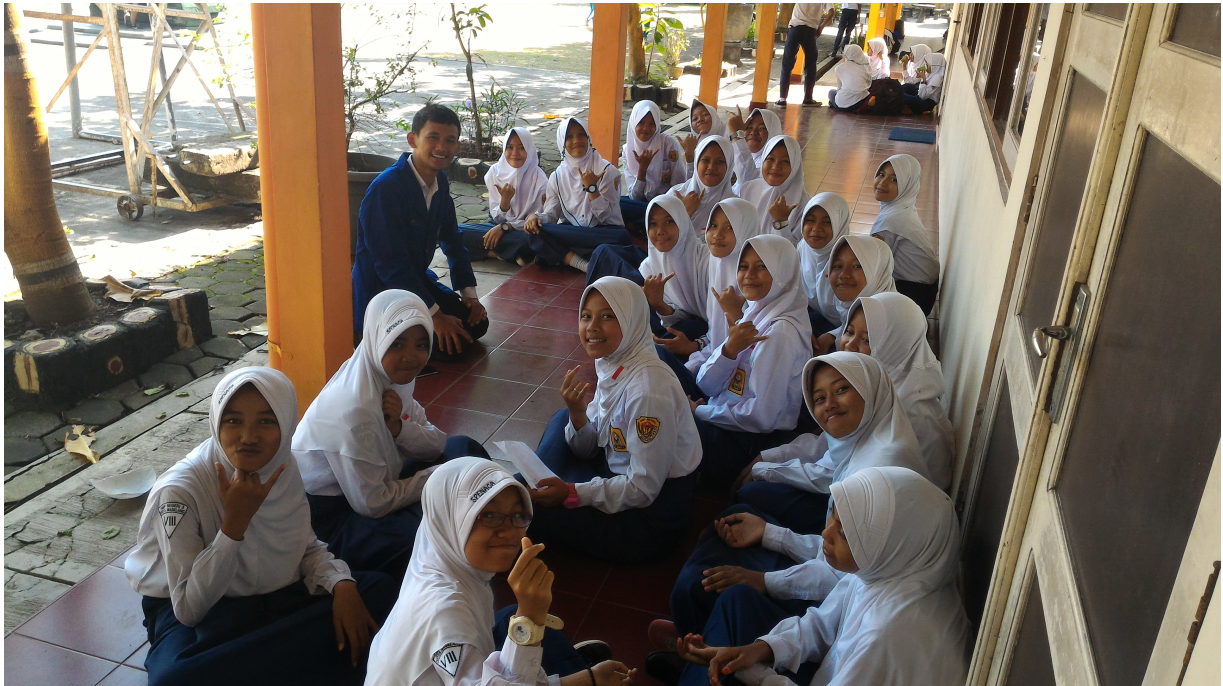
Gambar 8. Ekstrakurikuler – Paduan Suara