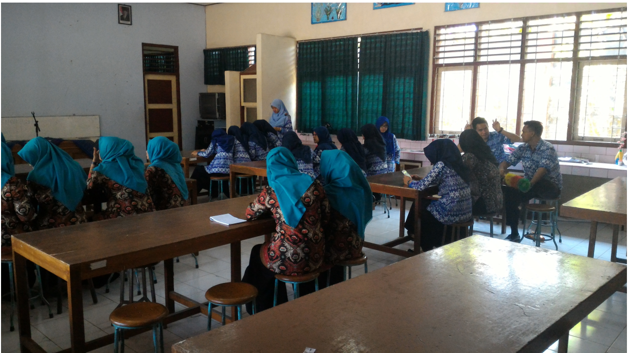
Gambar 6 dan 7. Evaluasi Mingguan Bersama (UNY, UNES, dan Pihak Sekolah)