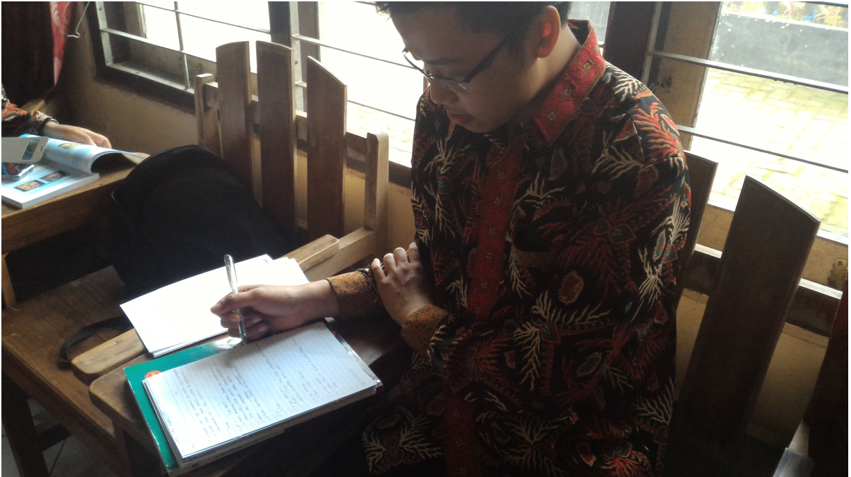
Gambar 5. Koreksi Ulangan KD 3