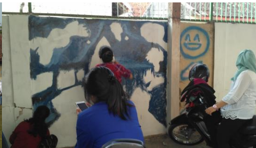
Mural dalam rangka HUT SMAN 1 Pengasih