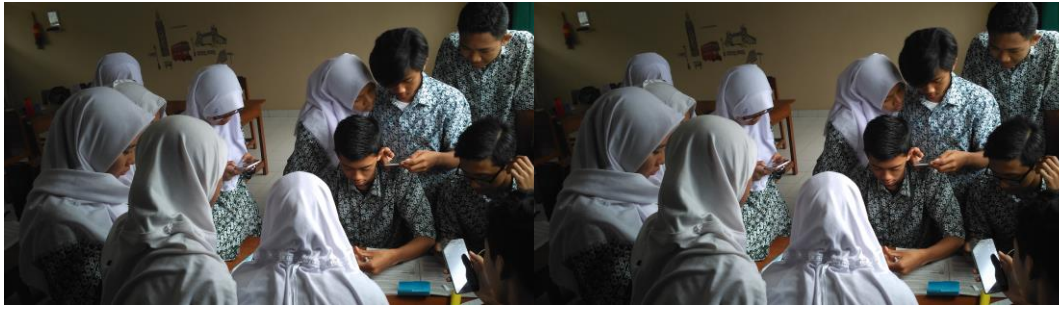
Pembelajaran di kelas