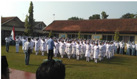
Upacara 17 Agustus