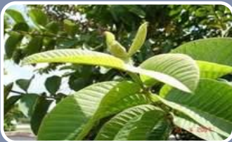
Daun jambu biji