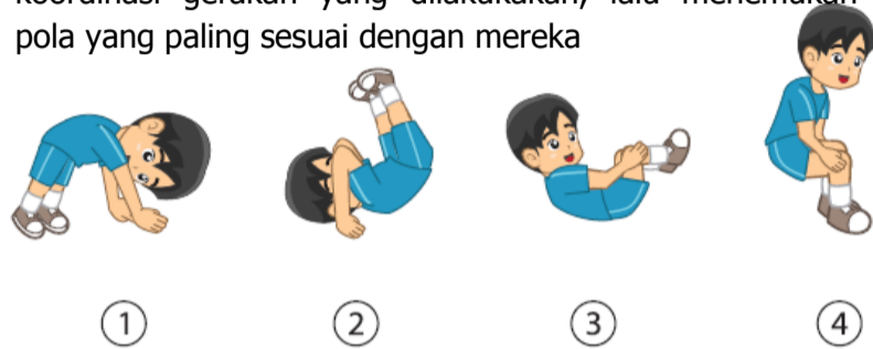
Gambar 1 . cara melakukan guling depan dari sikap awal jongkok