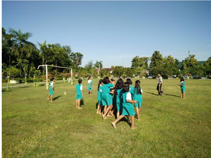
Proses belajar mengajar PJOK