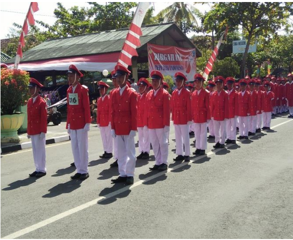
Lomba PBB Antar SD Se Kecamatan Wates