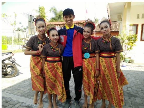
Pendampingan Lomba Tari Daerah Antar SD Se Kecamatan Wates