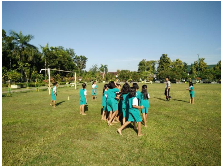
Proses belajar mengajar PJOK