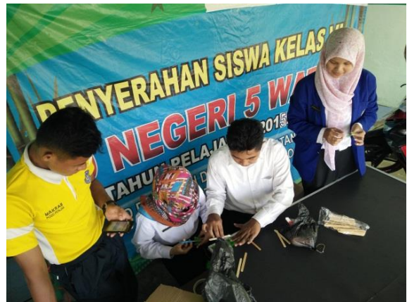
Pembuatan Mading Akreditasi Sekolah