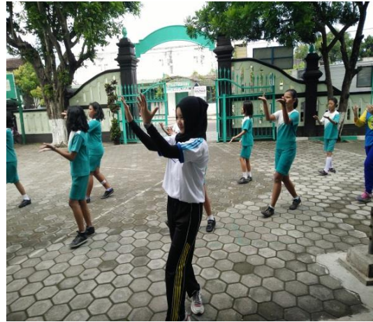
Pelatihan Senam Angguk Versi 1