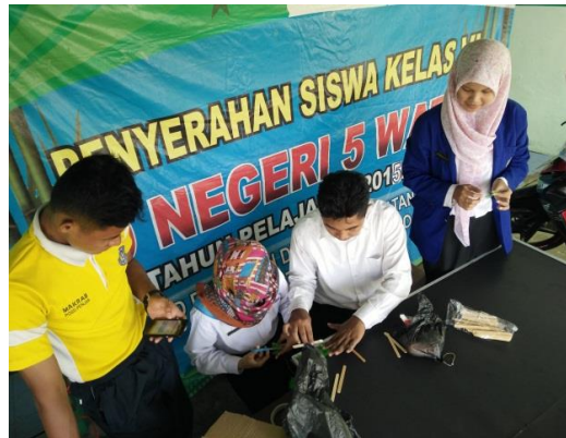
Pembuatan Mading Akreditasi Sekolah