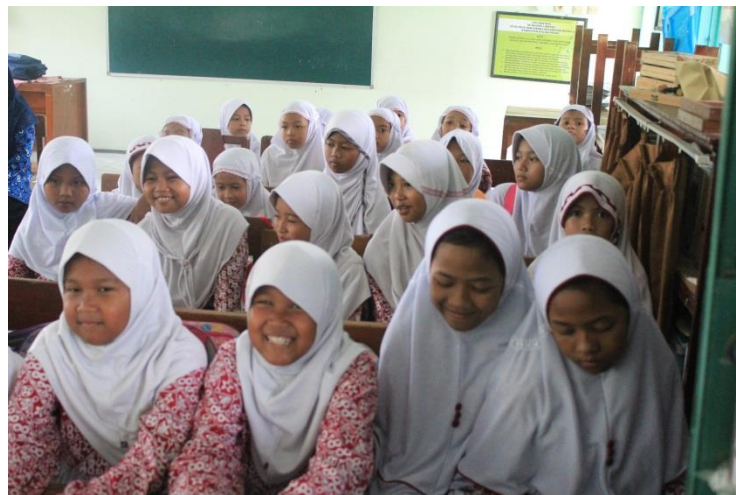
Perpisahan PPL SD Negeri 5 Wates