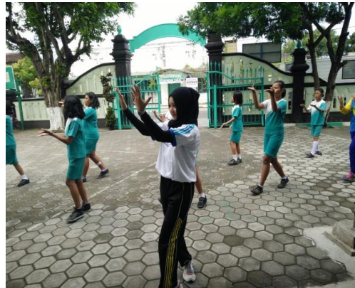
Pelatihan Senam Angguk Versi 1