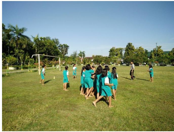
Proses belajar mengajar PJOK