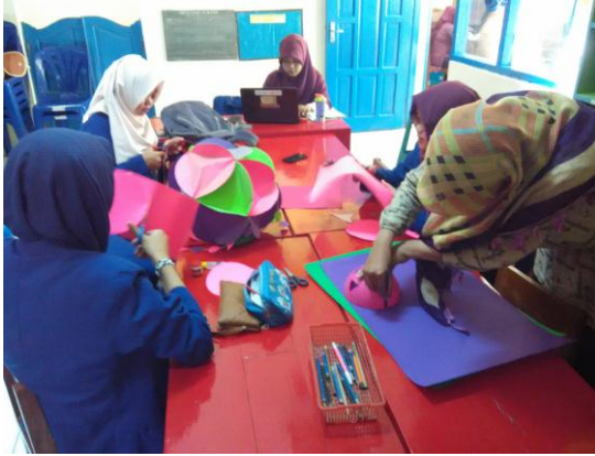
17. Menghias Kelas