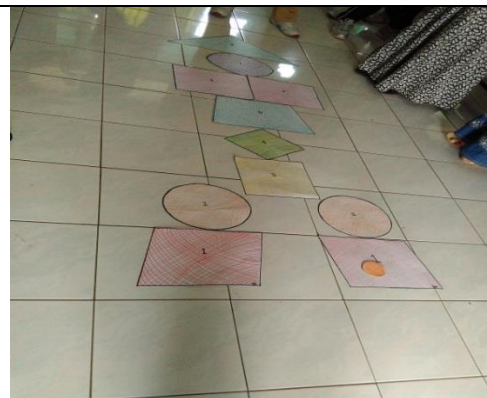
Pengembangan Model Pembelajaran PAUD (Diyah)