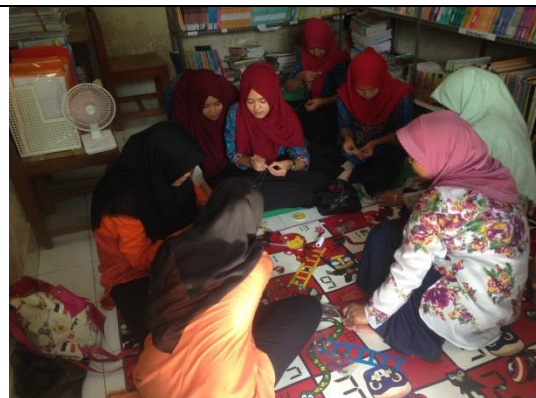
Pelatihan Pembuatan Bros Kain Perca (Nisita)