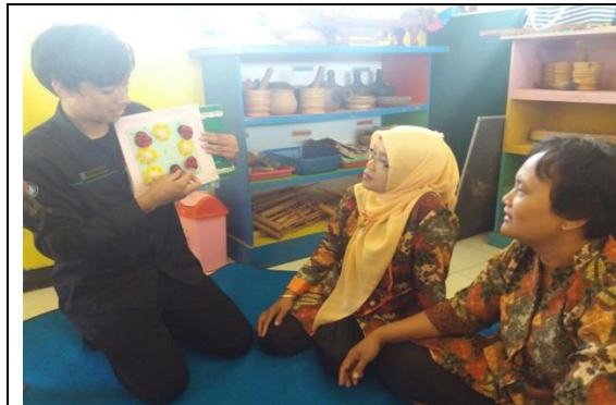
Display Busy Book (widi)