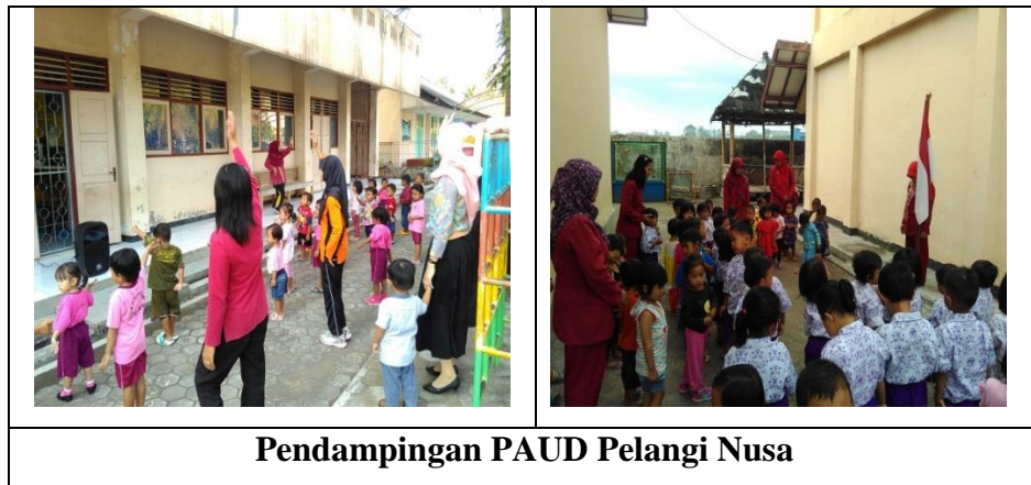
Pendampingan PAUD Pelangi Nusa