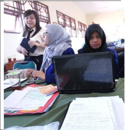
Pembuatan Perangkat Pembelajaran