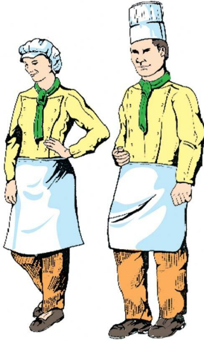
Gambar 24.10 Karyawan

yaitu di lingkungan rumah atau keluarganya. Misalnya untuk karyawan yang mempunyai anak, perusahaan menyediakan tempat penitipan anak atau pengaturan jadwal yang lebih fleksibel.