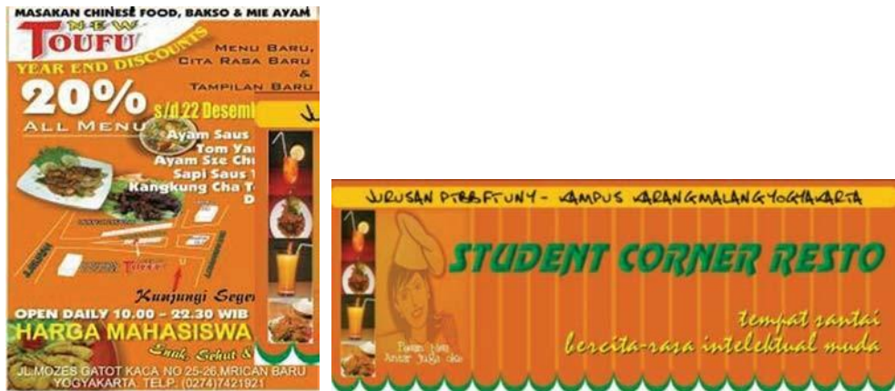
Gambar 24.9 Contoh Bentuk Promosi