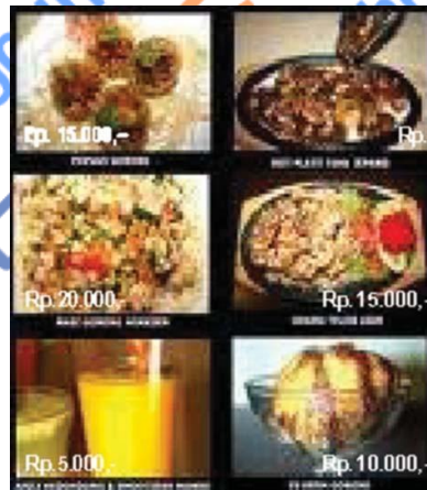
Gambar 24.7 Menu dengan berbagai variasi harga

Harga adalah bagian dari bauran pemasaran yang menghasilkan laba, sedangkan bauran pemasaran yang lain membutuhkan biaya. Harga juga merupakan variabel yang fleksibel, mudah untuk diubah. Di sisi lain, harga juga akan membentuk persaingan ketat antarprodusen. Masalah yang sering terjadi adalah harga yang terlalu berorientasi pada biaya, harga yang tidak diperbaiki seiring dengan perubahan pasar, harga yang tidak dipertimbangkan sebagai bagian dari bauran pemasaran, dan harga yang tidak bervariasi pada produk yang berbeda.