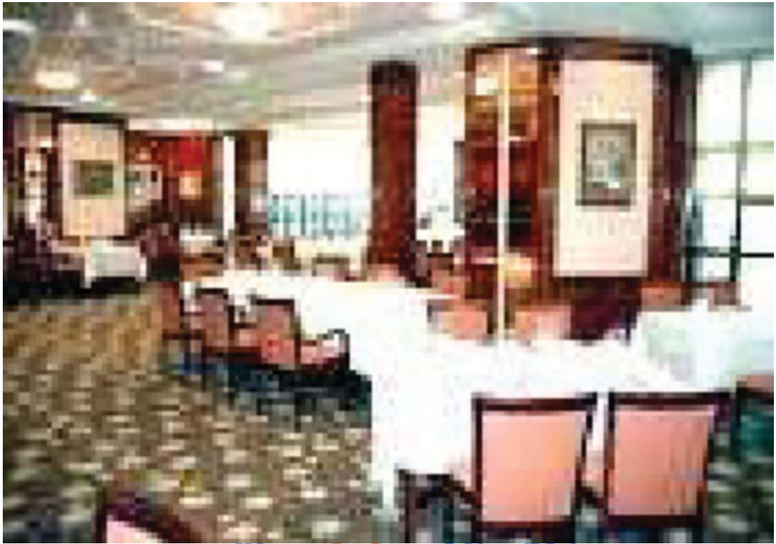
Gambar 24.11 Bentuk physical evidence Berupa Suasana Nyaman