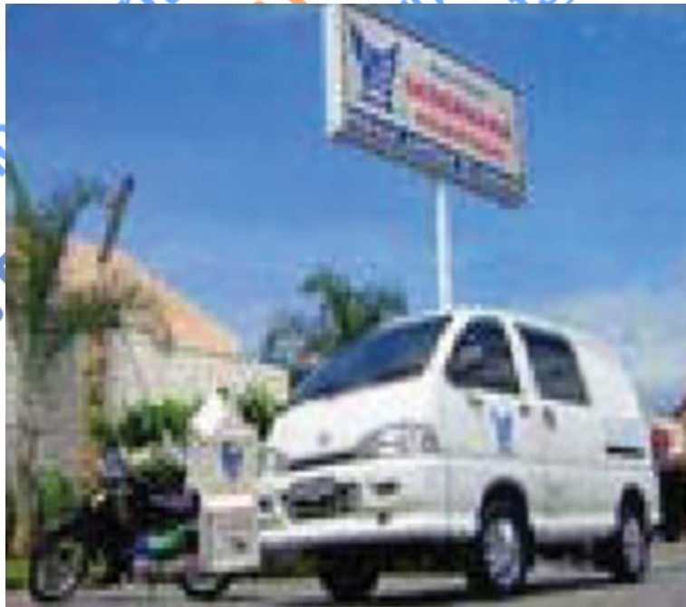
Gambar 24. 8 Pendistribusian dengan Delivery