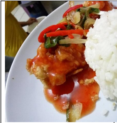
Penjualan Makanan Unit Produksi