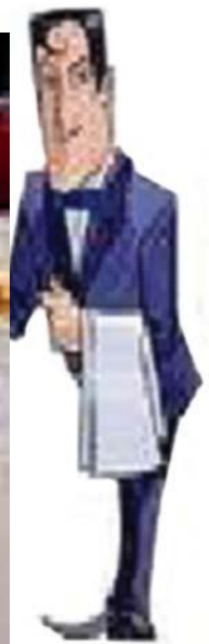
Gambar 24.6 Produk Jasa Boga