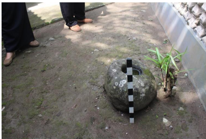
c. Dusun Semagung ( Sungai Semagung )