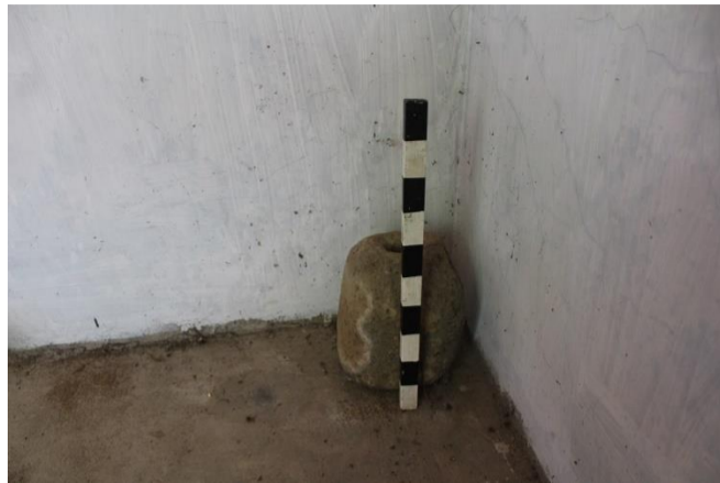
b. Dusun Semagung (Makam Kyai Lowo Ijo)