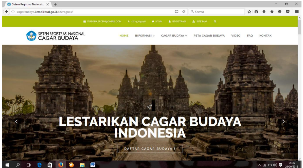
Gambar Beranda Sistem Registrasi Nasional Cagar Budaya