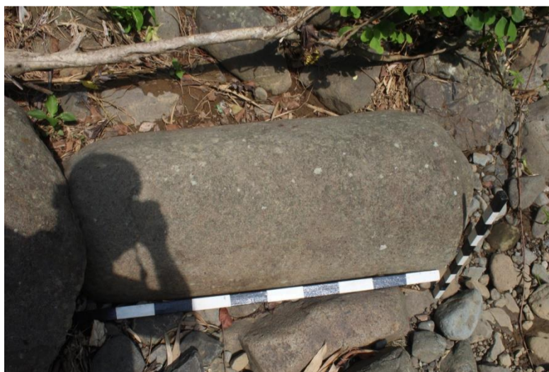
d. Dusun Semagung ( Muntilomojo)