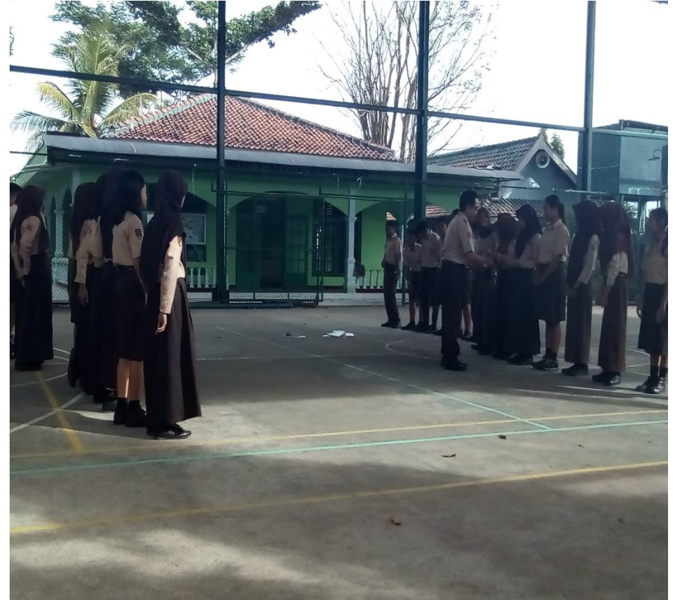
Observasi awal dengan Guru Pembimbing