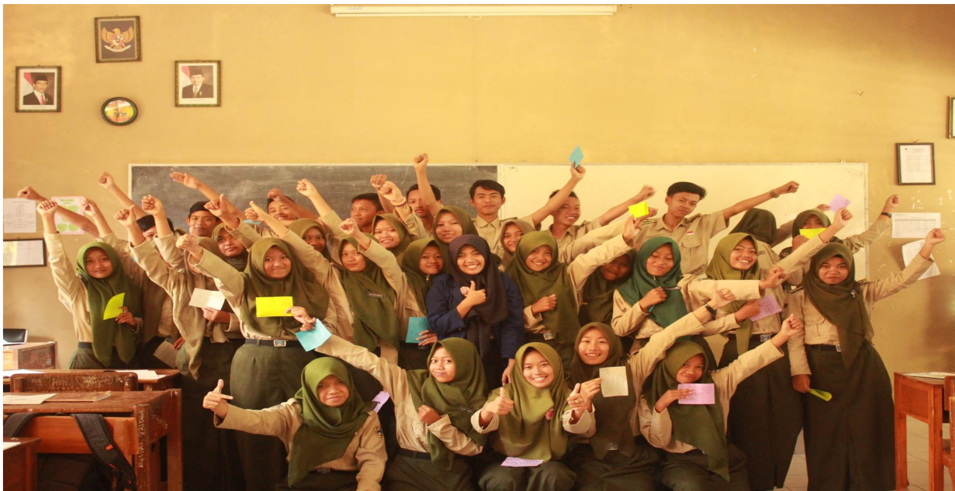
X IIS 3 SMA NEGERI 8 PURWOREJO