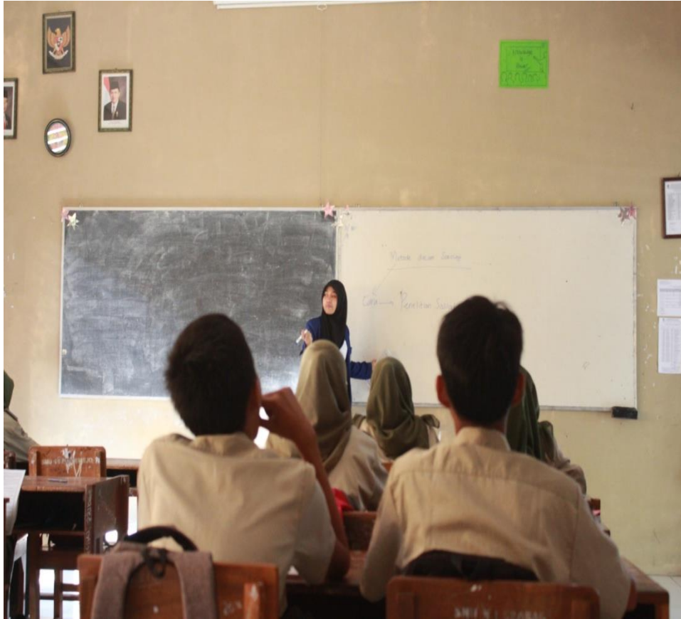
Proses Pembelajaran Sosiologi