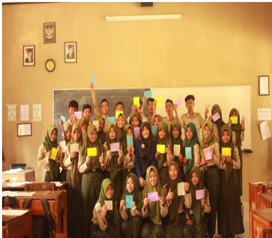
Foto bersama X IIS 3