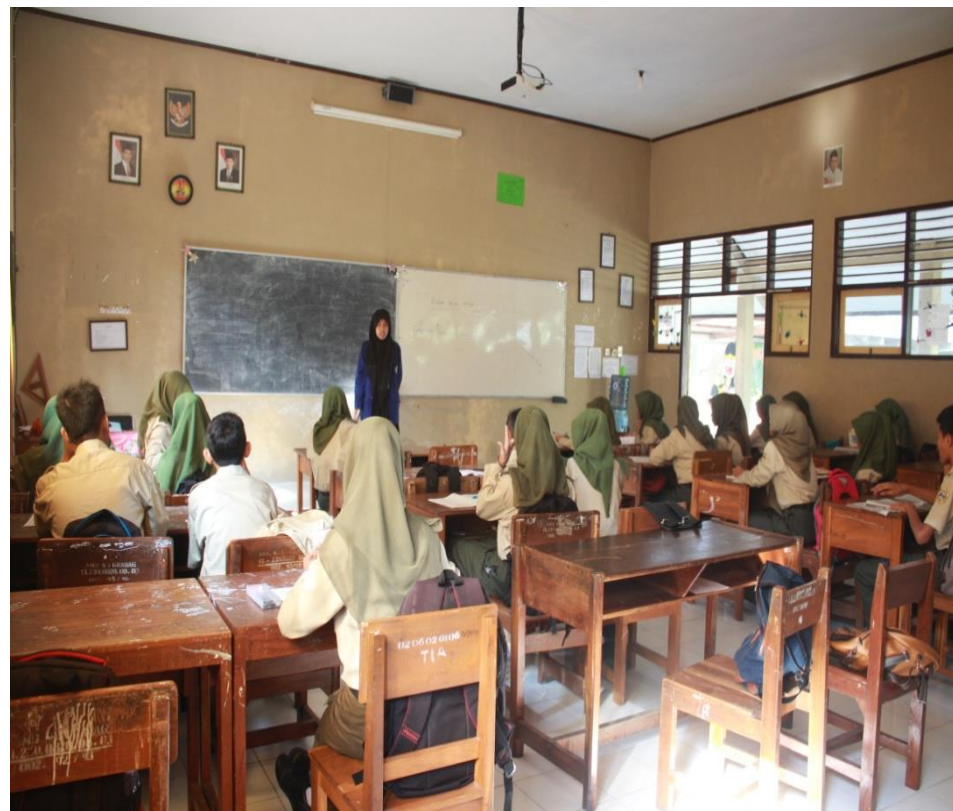
Proses Pembelajaran Sosiologi