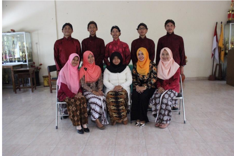
Gambar 7. Kegiatan Kamis Pahing

PPL UNIVERSITAS NEGERI YOGYAKARTA SMP NEGERI 9 YOGYAKARTA Alamat: Jalan Ngeksigondo 30 Prenggan, Kotagede, Yogyakarta. Telp. (0274) 371168 Kode Pos 55172