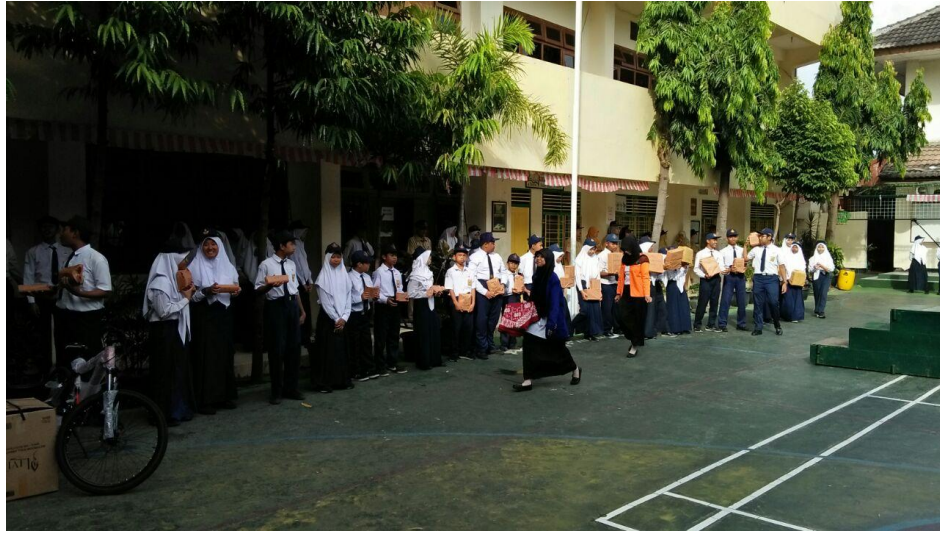
Gambar 11. Kegiatan Pembagian Hadiah Lomba 17 Agustus dan Lomba Bazar

PPL UNIVERSITAS NEGERI YOGYAKARTA SMP NEGERI 9 YOGYAKARTA Alamat: Jalan Ngeksigondo 30 Prenggan, Kotagede, Yogyakarta. Telp. (0274) 371168 Kode Pos 55172