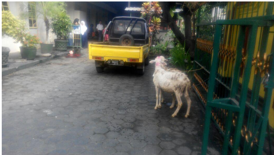
Gambar 12. Kegiatan Idul Qurban