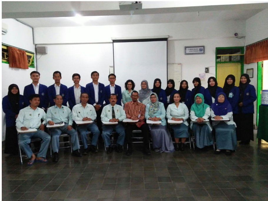
Gambar 14. Penarikan PPL