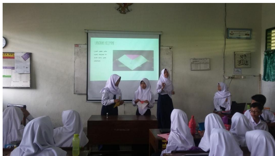
Gambar 4. Kegiatan Presentasi