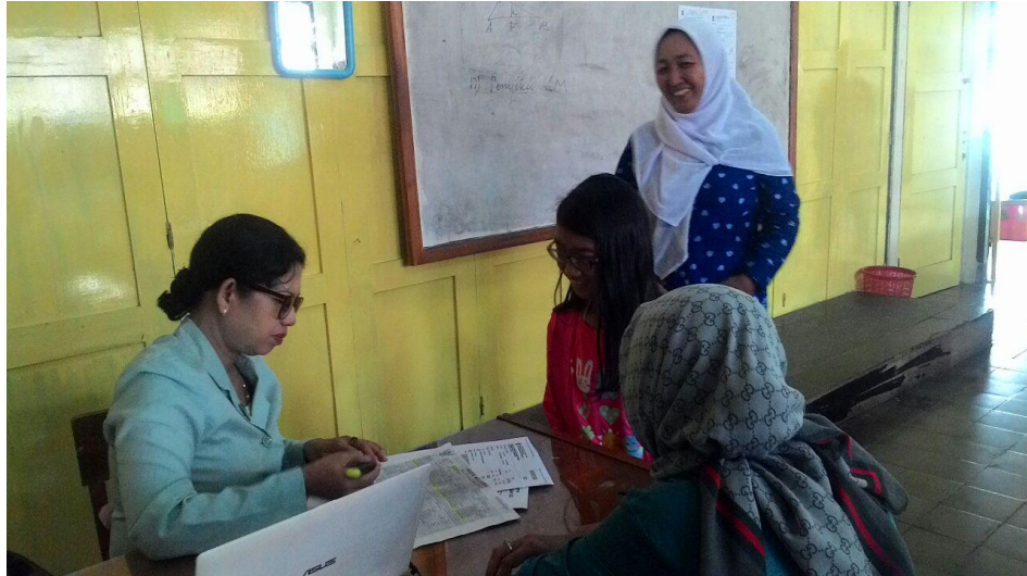
Gambar 5. Kegiatan PPDB

PPL UNIVERSITAS NEGERI YOGYAKARTA SMP NEGERI 9 YOGYAKARTA Alamat: Jalan Ngeksigondo 30 Prenggan, Kotagede, Yogyakarta. Telp. (0274) 371168 Kode Pos 55172