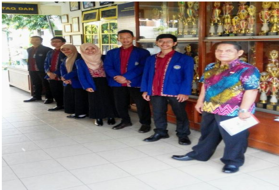
Gambar 6. Kegiatan Pagi Simpati