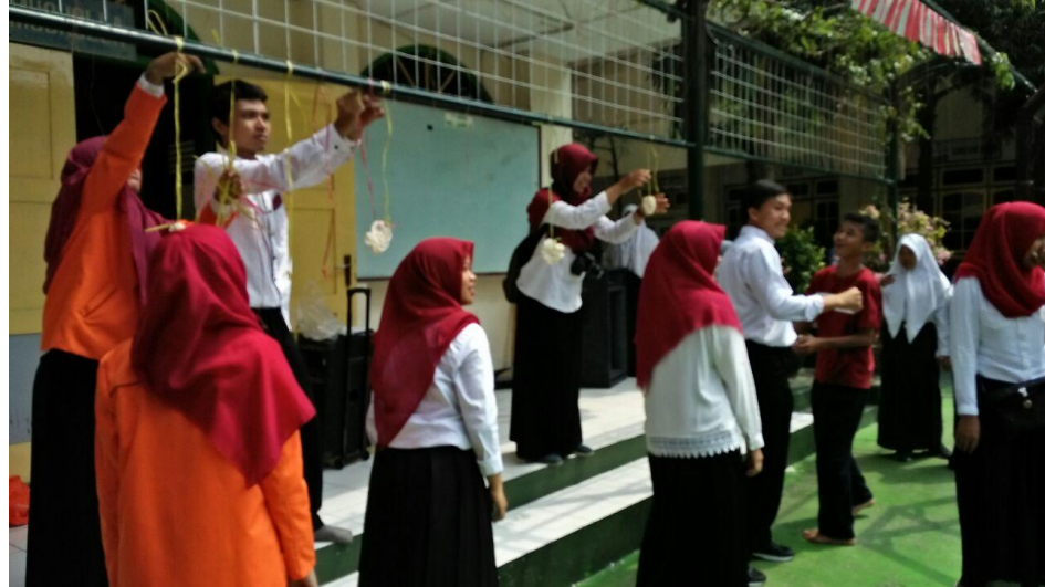
Gambar 10. Kegiatan Lomba 17 Agustus bersama PPL UAD