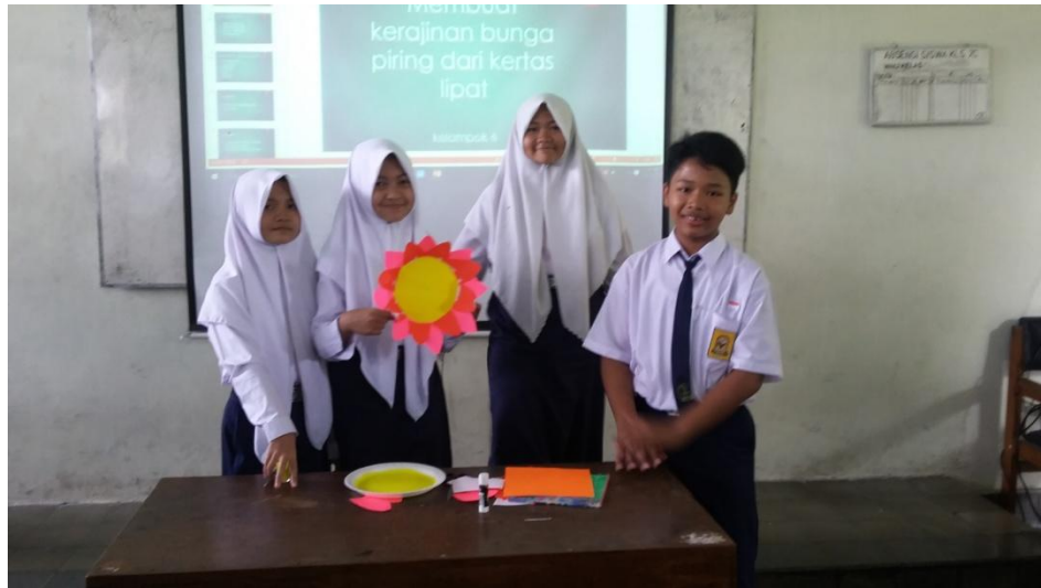
Gambar 3. Kegiatan Presentasi