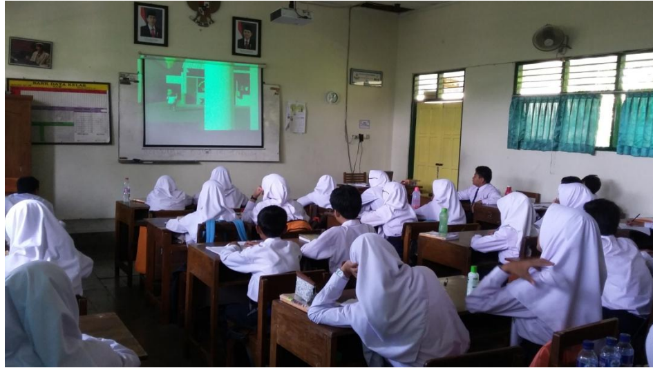
Gambar 1. Kegiatan Pembelajaran

PPL UNIVERSITAS NEGERI YOGYAKARTA SMP NEGERI 9 YOGYAKARTA Alamat: Jalan Ngeksigondo 30 Prenggan, Kotagede, Yogyakarta. Telp. (0274) 371168 Kode Pos 55172