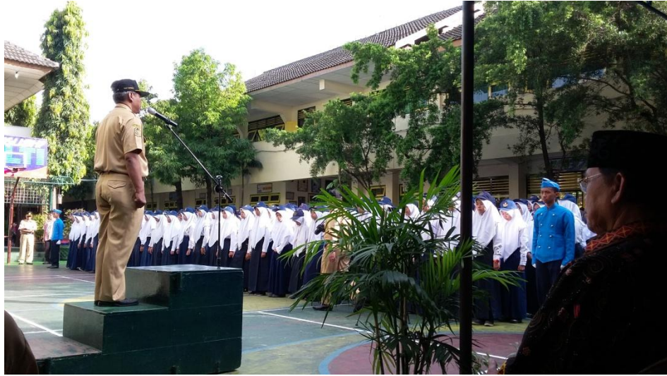
Gambar 9. Upacara Peringatan HUT SMP Negeri 9 Yogyakarta

PPL UNIVERSITAS NEGERI YOGYAKARTA SMP NEGERI 9 YOGYAKARTA Alamat: Jalan Ngeksigondo 30 Prenggan, Kotagede, Yogyakarta. Telp. (0274) 371168 Kode Pos 55172