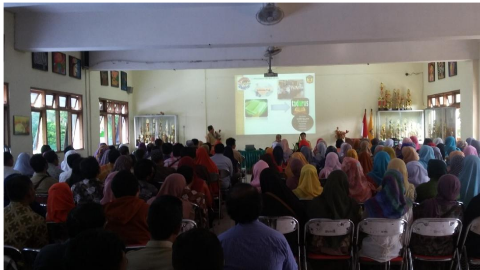
Gambar 8. Kegiatan Kajian Ahad Pagi (Pertemuan Wali Murid)