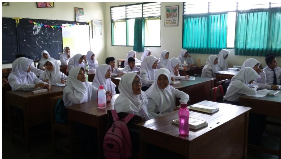
Gambar 2. Kegiatan Pembelajaran