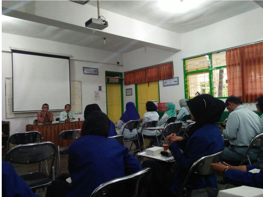
Gambar 13. Penarikan PPL

PPL UNIVERSITAS NEGERI YOGYAKARTA SMP NEGERI 9 YOGYAKARTA Alamat: Jalan Ngeksigondo 30 Prenggan, Kotagede, Yogyakarta. Telp. (0274) 371168 Kode Pos 55172