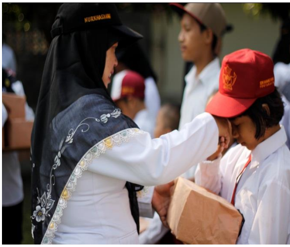
Gambar 5. Hadiah 17 Agustus