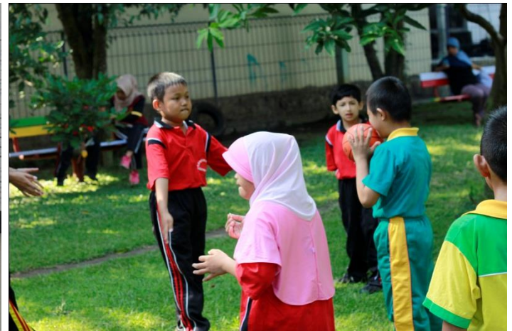
Gambar 8. Kegiatan Explorasi di taman setelah senam