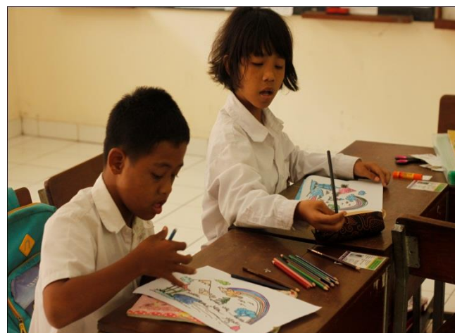
Gambar 3. Belajar Menggambar & mewarnai