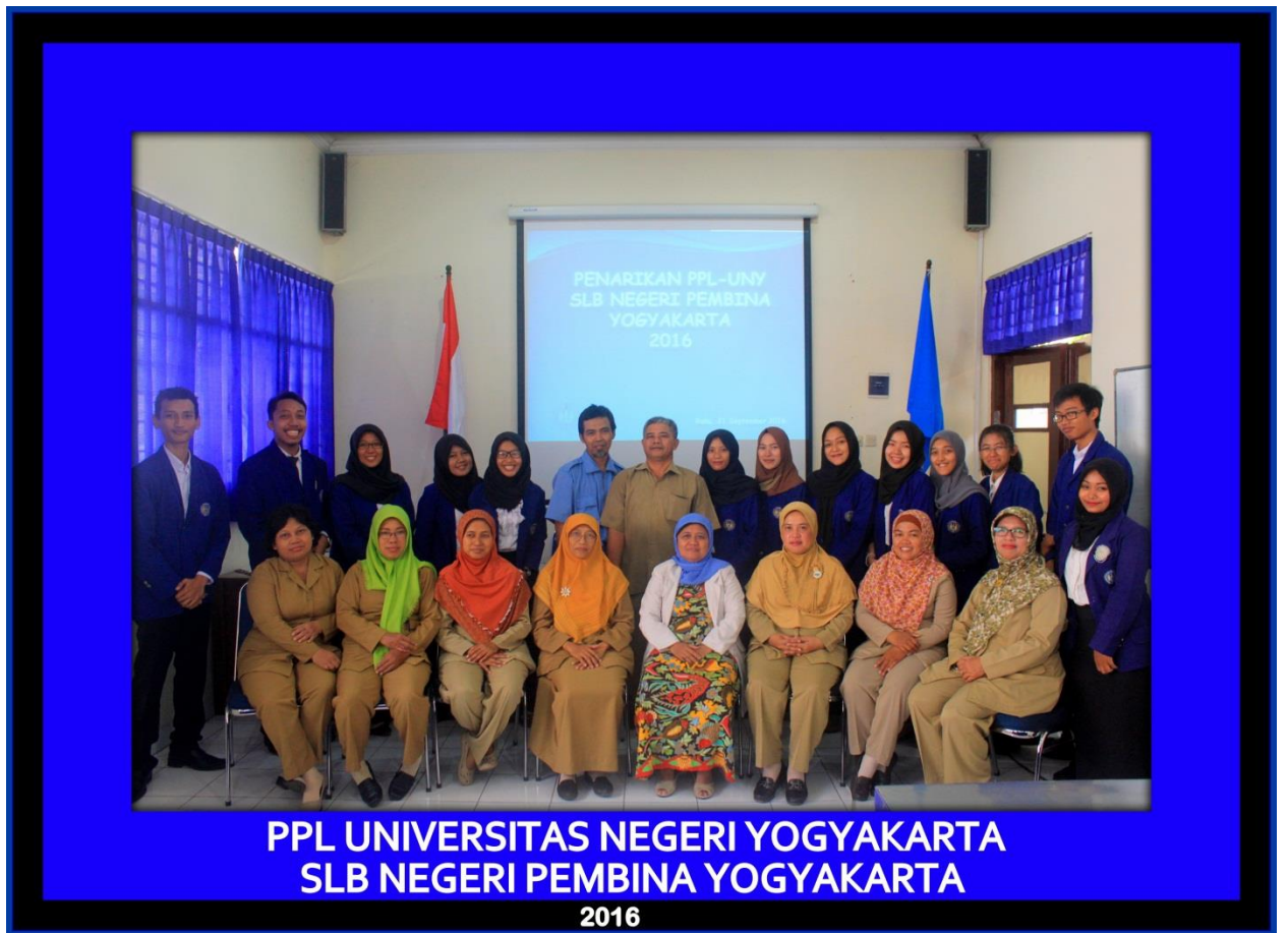
Foto Pasca Penarikan PPL Universitas Negeri Yogyakarta