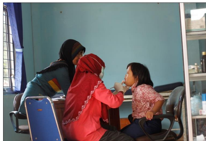
Gambar 4. Mendampingi Kegiatan Pemeriksaan Gigi