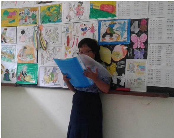
Gambar 7. Belajar Membaca di depan teman kelas