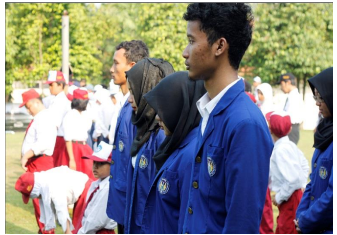
Gambar 6. Kegiatan Upacara Rutin Hari Senin