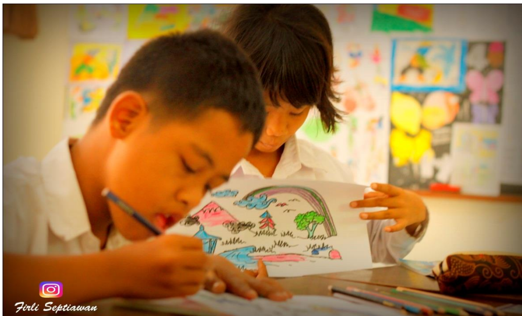
Gambar 1. aktivitas beberapa siswa kelas 5 TGS