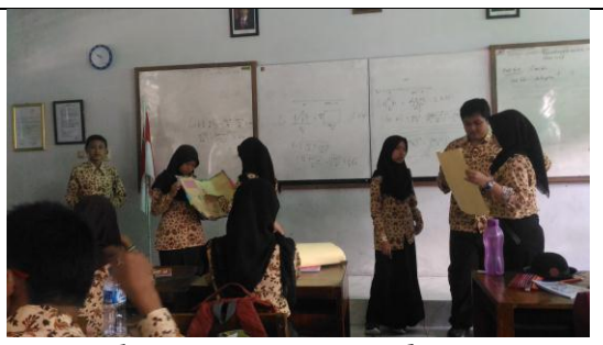
Battle Presentation Mind Mapping