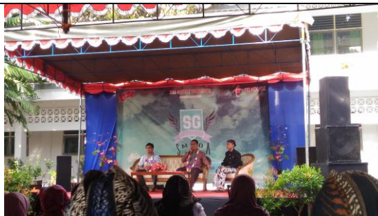
Ikut serta Stadium Generale