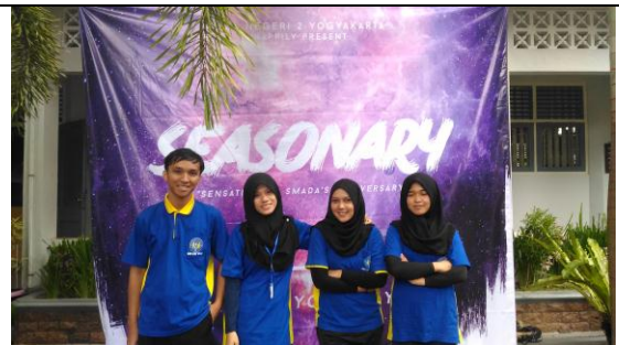
Perayaan HUT Smada