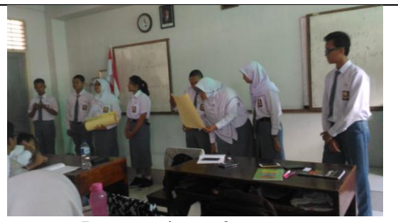
Presentasi Mind Mapping