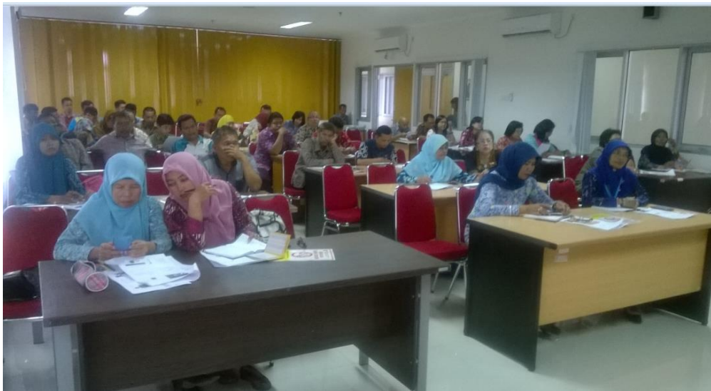
Sosialisasi Kawasan Tanpa Rokok