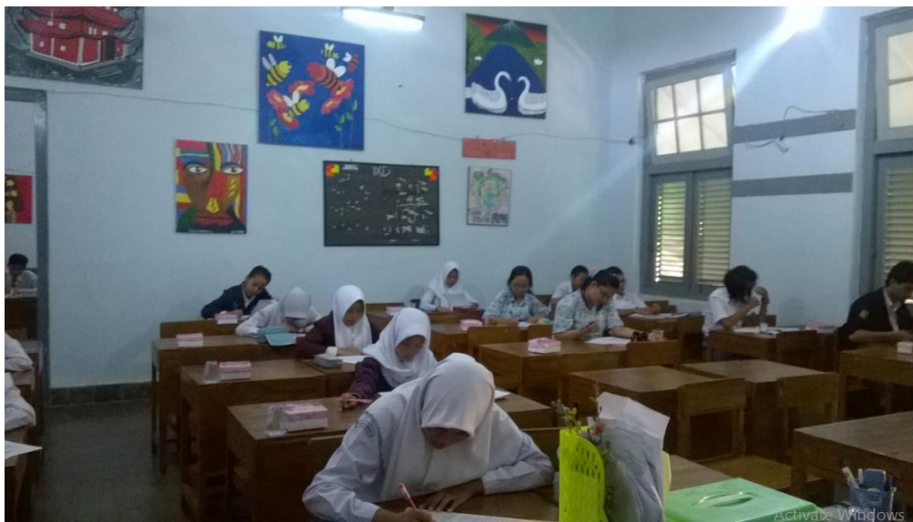
Seleksi Tertulis Pertukaran Pelajar