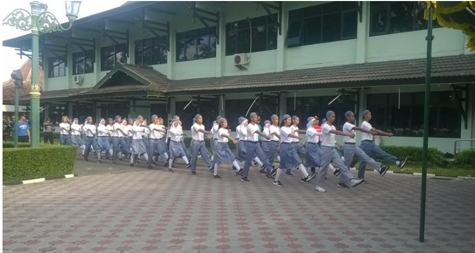
Pendidikan dan Pelatihan Paskibraka