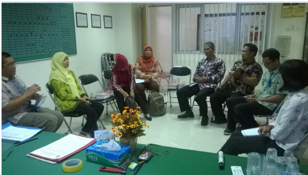
Rapat Koordinasi dengan Kemeterian Lingkungan Hidup