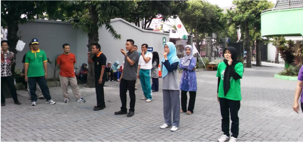
Lomba Peringatan HUT RI