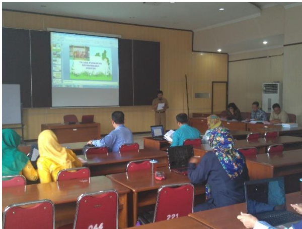
Lomba Presentasi Proposal PUG