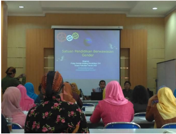
Pendampingan Rapat PUG