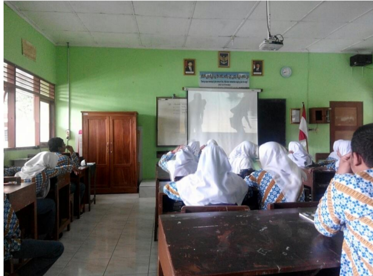
Gambar 7. Diskusi Film “Tanah Surga”