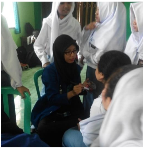
Gambar 3. Kegiatan Persiapan Lomba Gerak Jalan