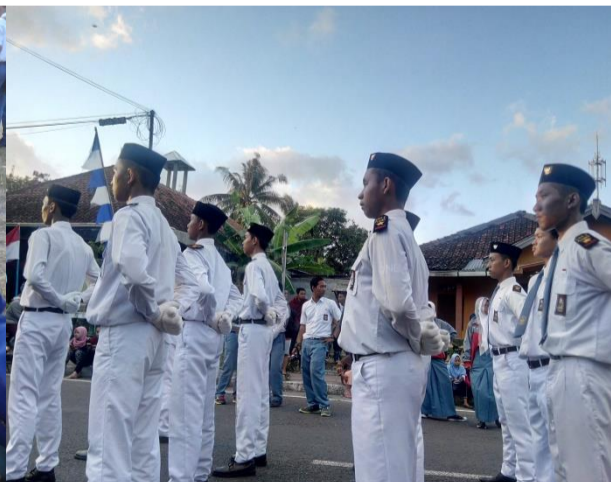
Gambar 6. Pendampingan Lomba Gerak Jalan SMA Negeri 1 Pleret