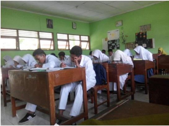
Gambar 1. Kegiatan Pembelajaran di kelas XD