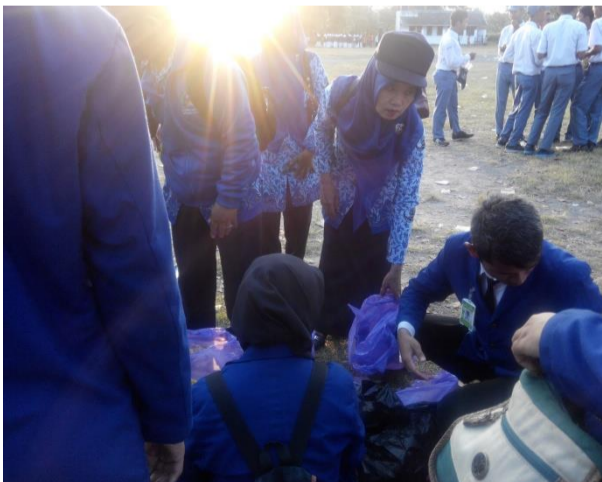
Gambar 5. Pendampingan Upacara penurunan Bendera 17 Agustus 2016