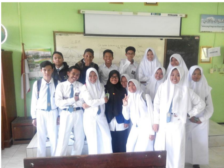
Gambar 8. Foto bersama kelas XB