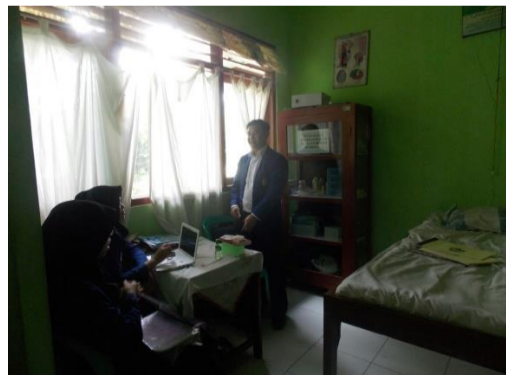
Gambar 13. Piket UKS