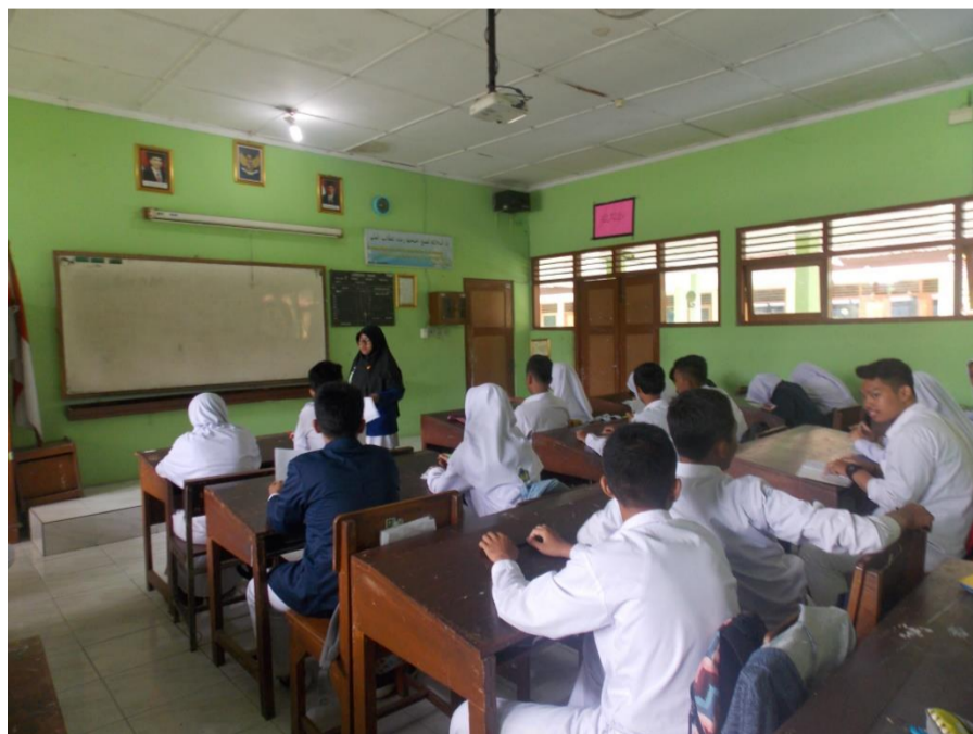
Gambar 9. Kegiatan Ulangan Harian 1 Kelas XD