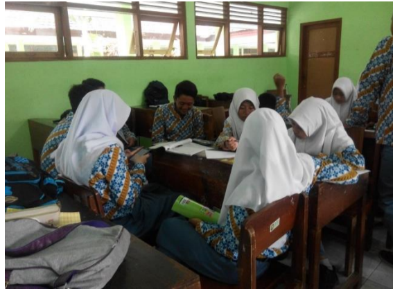
Gambar 2. Kegiatan Diskusi di Kelas XF