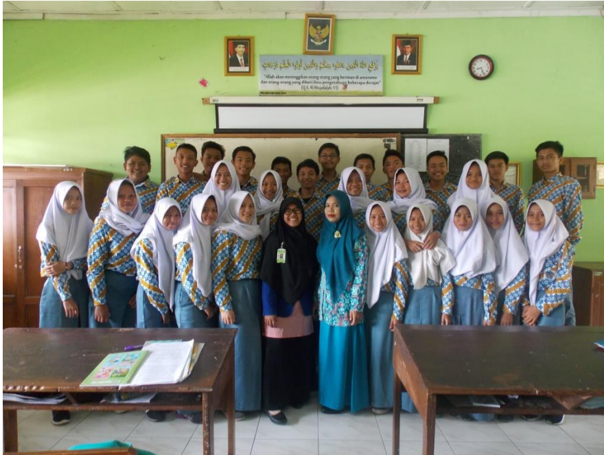
Gambar 10. Foto bersama Guru pembimbing dan Kelas XF