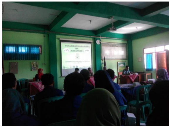
Gambar 4. Kegiatan Penarikan PPL UIN SUKA