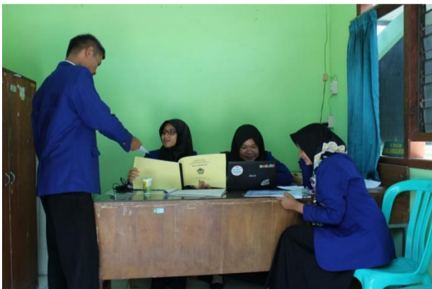
Gambar 12. Piket Guru