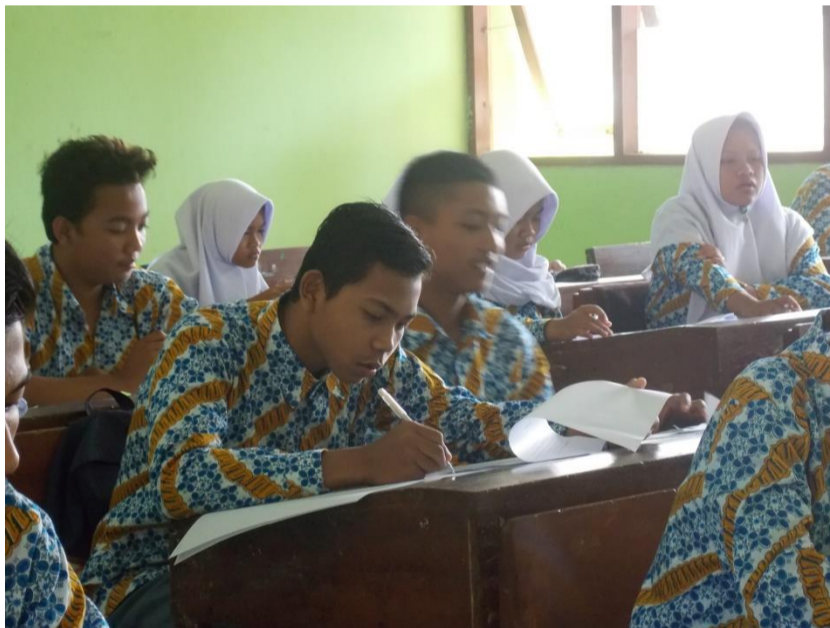
Gambar 11. Kegiatan Ulangan Harian 1 Kelas XF