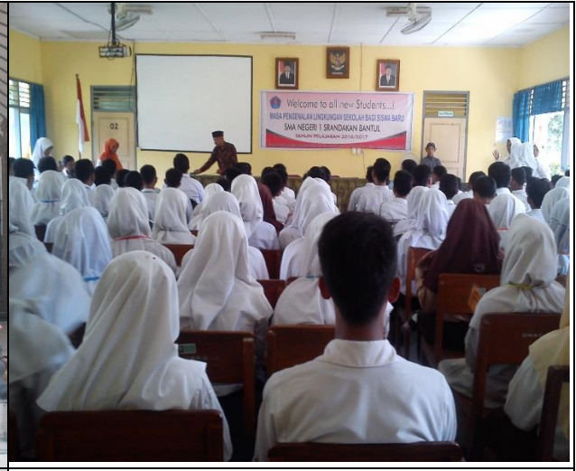
Massa Pengenalan Lingkungan Sekolah (MPLS)