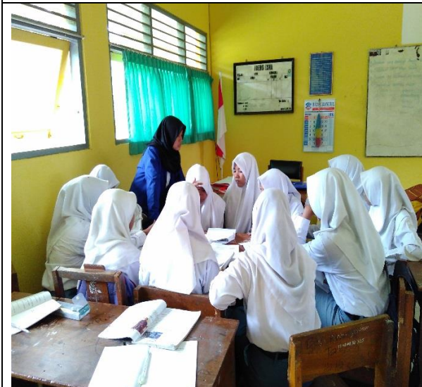
Pembelajaran Sosiologi dengan metode diskusi kelompok