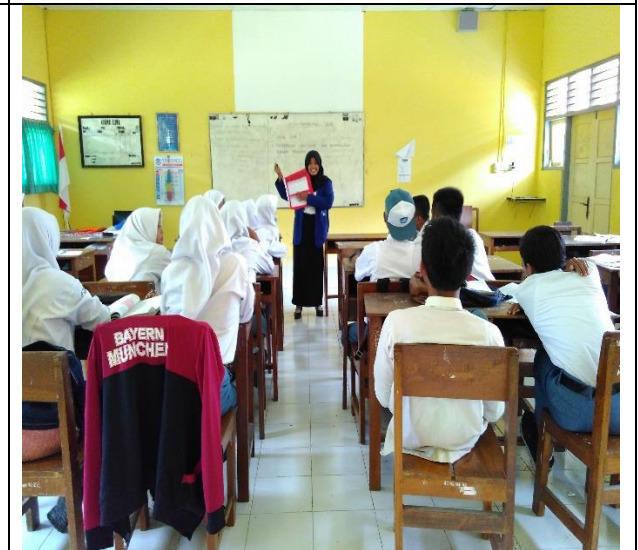
Pembelajaran Sosiologi dengan media kotak diskusi