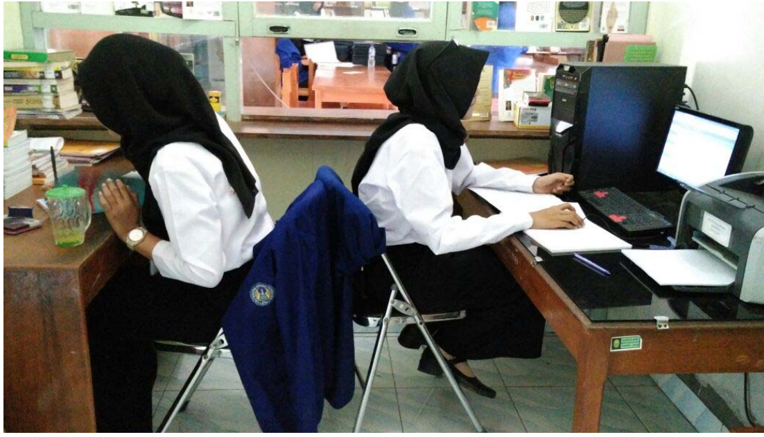
Input data perpustakaan.