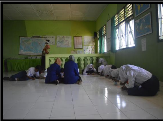
Mendampingi seleksi peserta lomba alih aksara Jawa tingkat Provinsi DIY