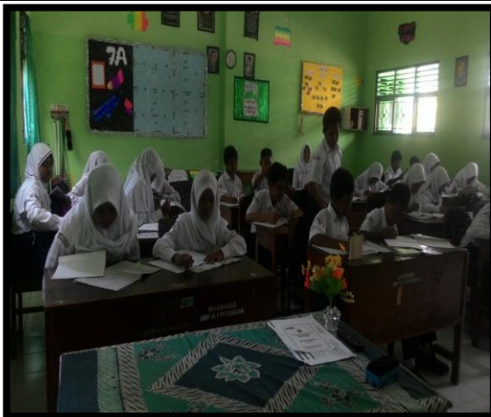
Siswa mengerjakan tugas yang diberikan oleh guru