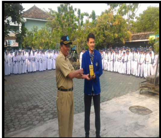
Pemberian kenang-kenangan dari PPL kepada Kepala Sekolah