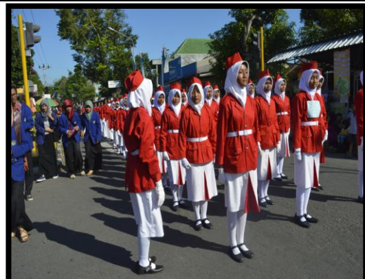
Mendampingi lomba pawai Tonti di Masjid Agung Bantul