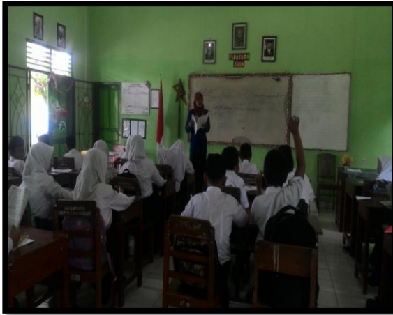
Proses belajar mengajar di kelas siswa aktif bertanya dan menjawab pertanyaan dari guru