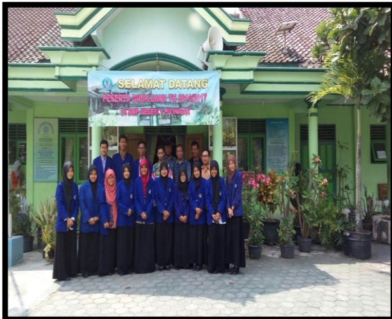
Penarikan Mahasiswa PPL oleh DPL di SMP Negeri 1 Piyungan