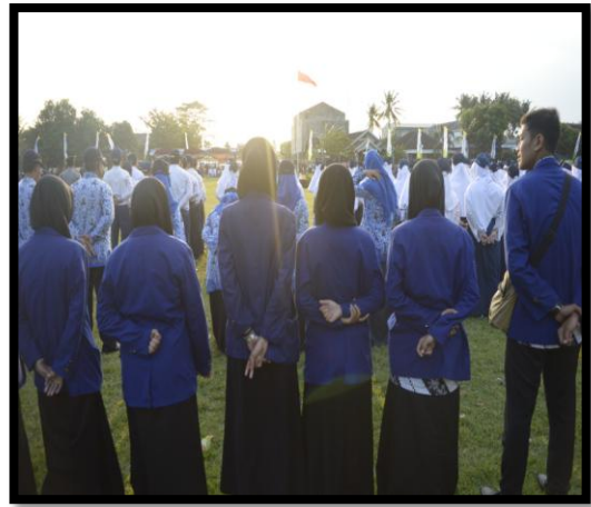
Mengikuti Upacara Penurunan Bendera HUT RI Ke-71 di Lapangan Petir Kecamatan Piyungan