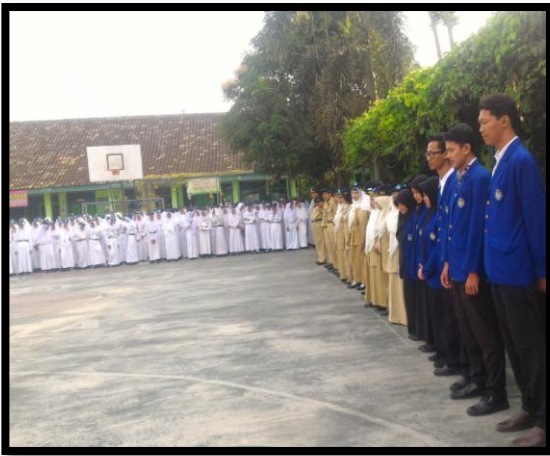
Mengikuti Upacara Hari Senin di halaman SMP Negeri 1 Piyungan