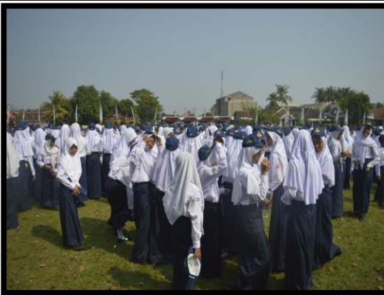
Mengikuti Upacara Pengibaran Bendera Peringatan HUT RI Ke-71 di Lapangan Petir Kecamatan Piyungan