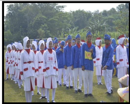
Mendampingi lomba Jalan Sehat Tonti di Kecamatan Piyungan