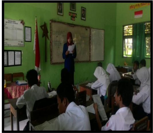
Proses belajar mengajar di kelas. Salah satu siswa membaca teks percakapan yang ada di buku.