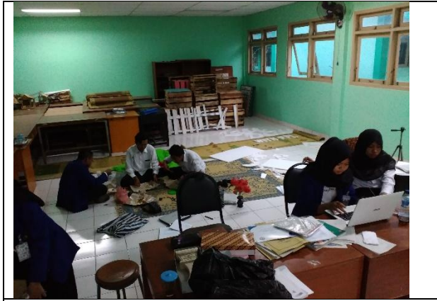
Rekapitulasi minat baca