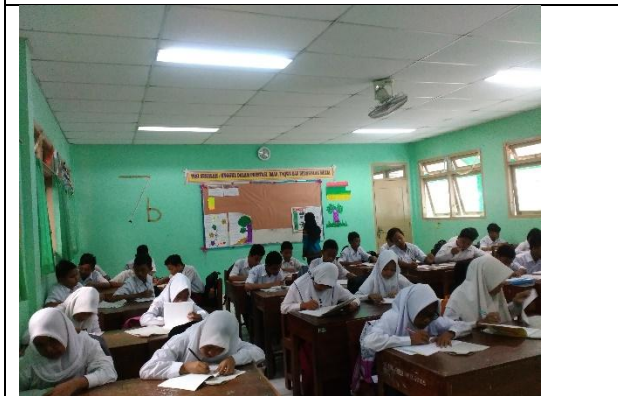
Ujian Awal Siswa Baru