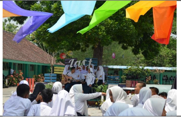
Pensi Perpisahan Mahasiswa PPL