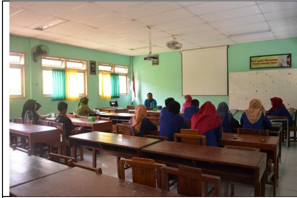
Penarikan Mahasiswa PPL