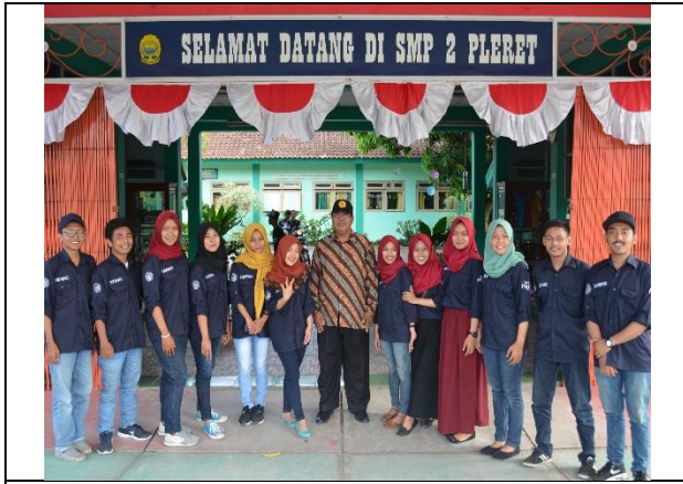
Mahasiswa PPL UNY 2015