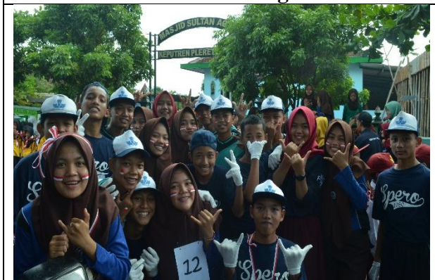
Lomba Gerak Jalan