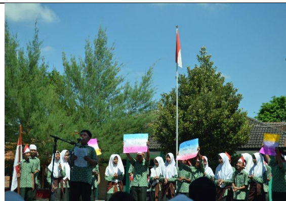
Orasi Pemilihan Anggota OSIS