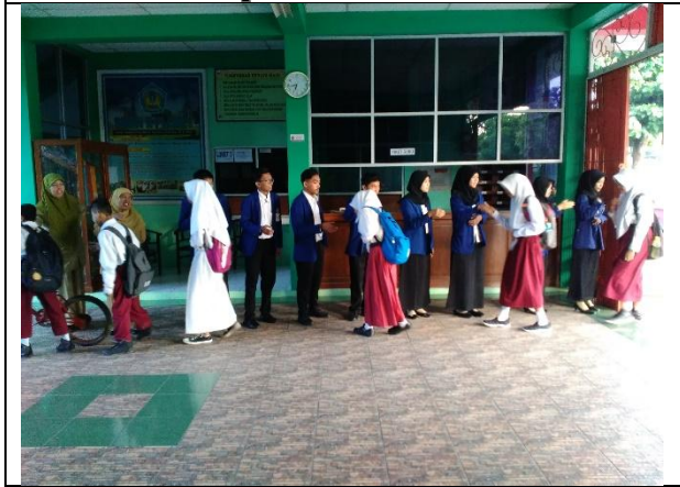
Piket Guru Jaga