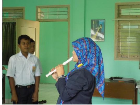
Pendampingan praktik alat musik melodis oleh guru pembimbing