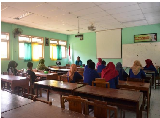
Penarikan Mahasiswa PPL