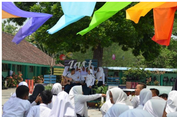
Pensi perpisahan Mahasiswa UNY