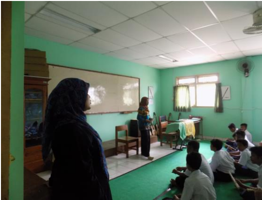
Kegiatan belajar mengajar dengan didampingi guru pembimbing