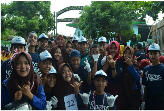
Lomba gerak jalan