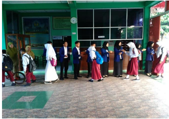
Piket guru jaga