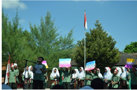
Orasi pemilihan ketua OSIS