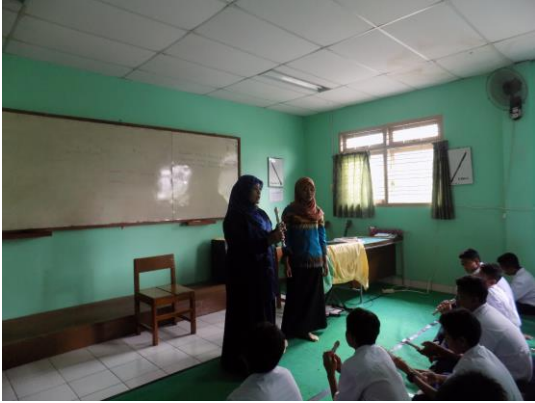
Pembelajaran alat musik Rekorder