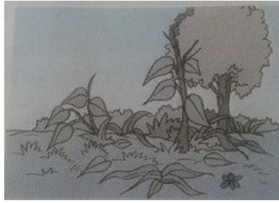
Gambar Taman yang rusak

Taman di kampungku sudah rusak. Banyak tanaman bunga yang rusak, kering atau layu. Kerusakan itu terjadi karena tidak ada orang yang mau merawat taman itu.