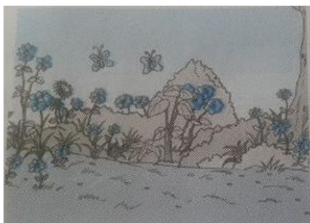
Gambar Taman yang terawat

Aku dan teman-temanku ingin merawat kembali taman itu. Kami bergotong royong menanam bunga. Teman-teman ada yang menyiram tanaman dan ada juga yang memangkas tanaman menggunakan gunting taman.