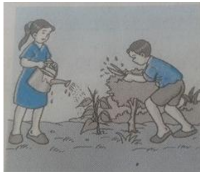
Gambar Teman-teman sedang merawat taman bunga

Taman di kampungku sudah rusak. Banyak tanaman bunga yang rusak, kering atau layu. Kerusakan itu terjadi karena tidak ada orang yang mau merawat taman itu.