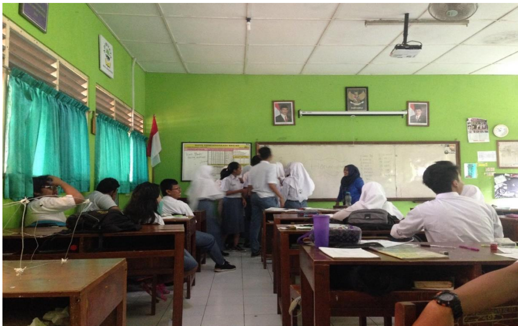
ANTUSIAS SISWA SAAT MENJAWAB JAWABAN DI DEPAN KELAS