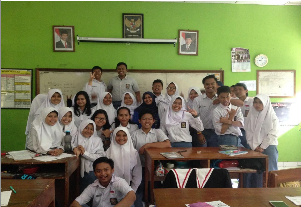
FOTO BERSAMA DENGAN SISWA XI IPA 4