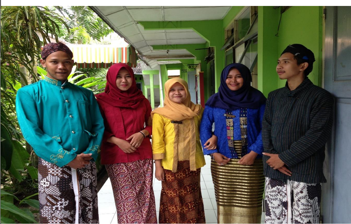
SAAT MENGGUNAKAN KEBAYA DALAM RANGKA HUT DIY