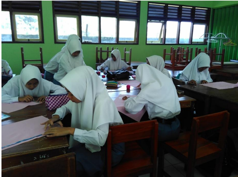
Gambar 4. Kegiatan Praktik