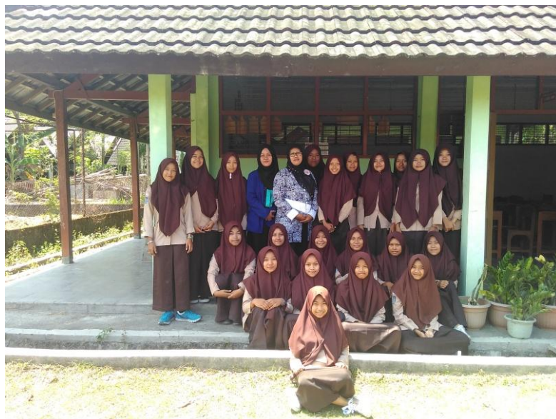
Gambar 11. Foto Bersama Guru Pembimbing dan Siswi Kelas XI BB 2