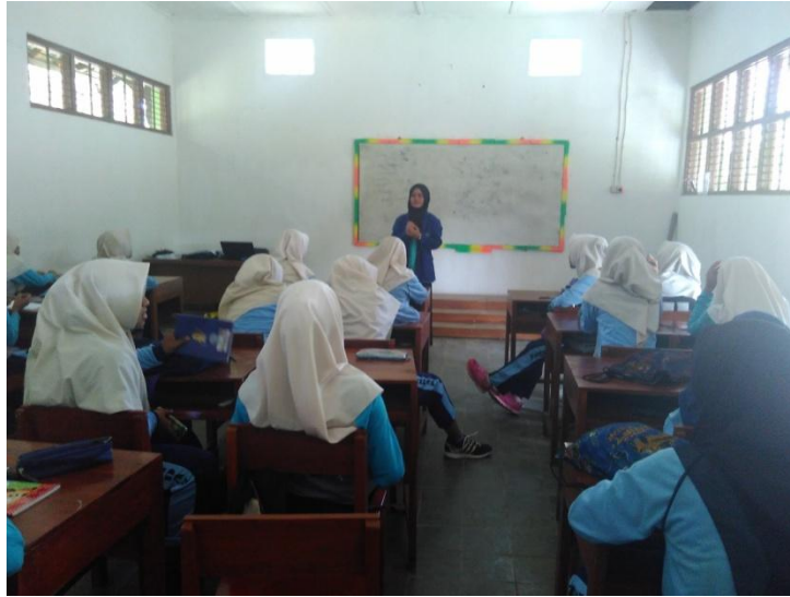
Gambar 1. Kegiatan Mengajar Teori