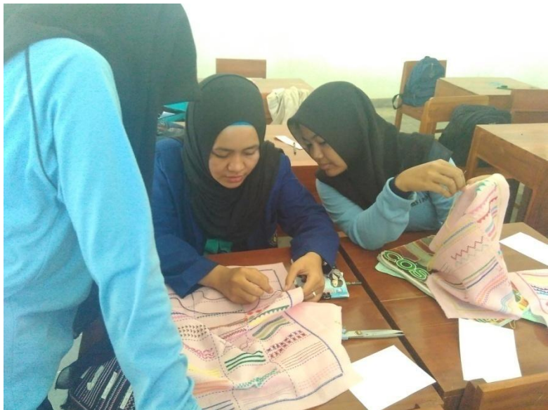
Gambar 5. Kegiatan Demonstrasi Materi