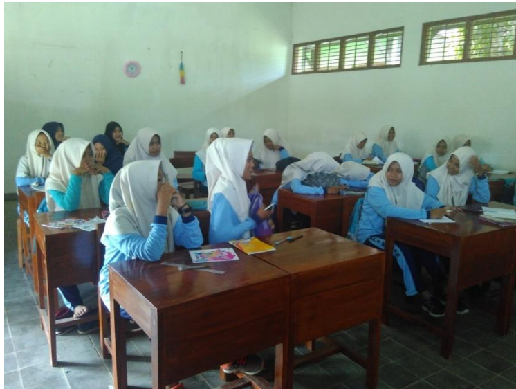
Gambar 2. Kegiatan Evaluasi Tanya Jawab