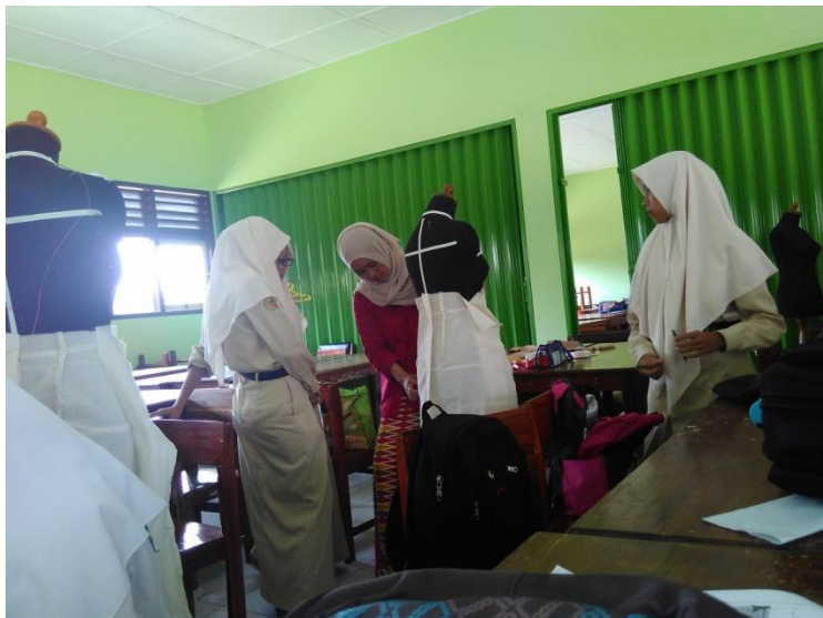
Gambar 8. Kegiatan Evaluasi Hasil Praktek