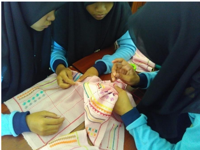
Gambar 6. Kegiatan Praktik di Kelas