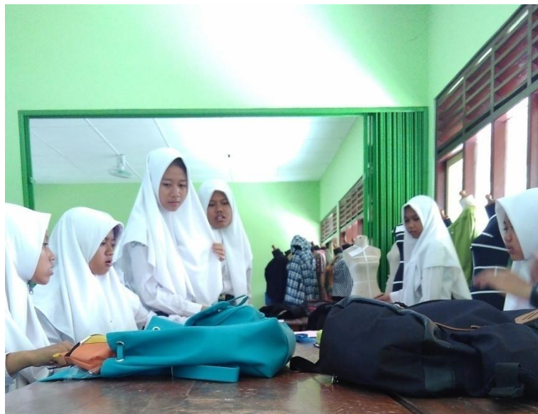
Gambar 3. Kegiatan Berdiskusi Kelompok