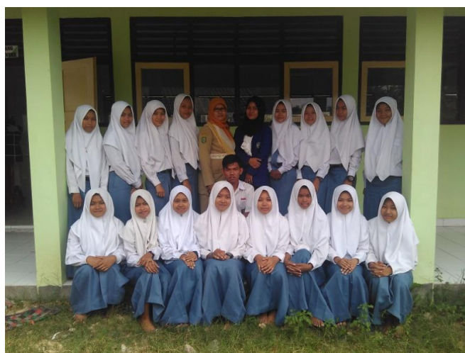
Gambar 12. Foto Bersama Guru Pembimbing dan Siswi Kelas XI BB 3s