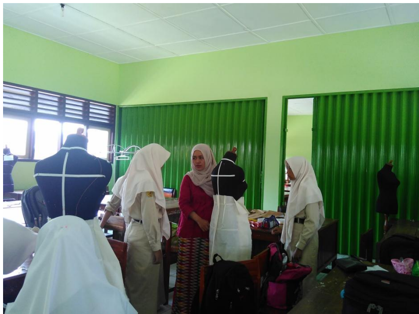
Gambar 9. Kegiatan Evaluasi Hasil Praktek