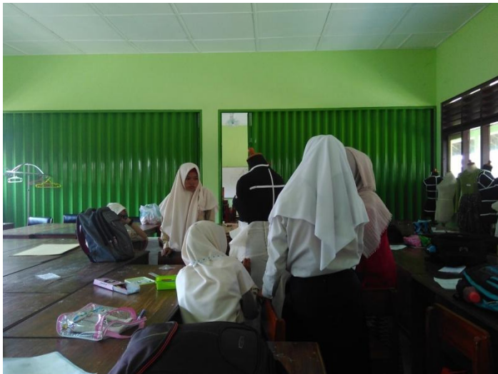
Gambar 7. Kegiatan Evaluasi Hasil Praktek