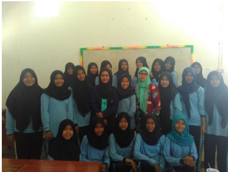
Gambar 10. Foto Bersama Guru Pembimbing dan siswi Kelas XI BB 1