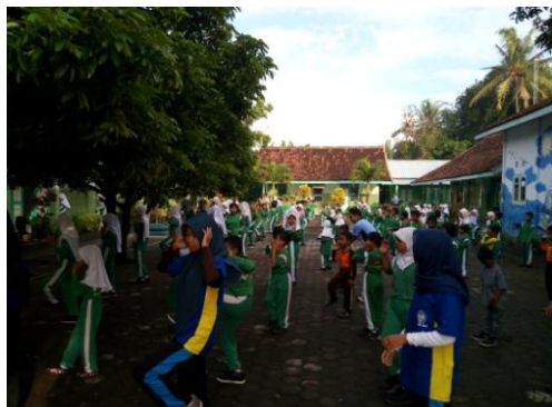
Senam pagi Hari Jumat