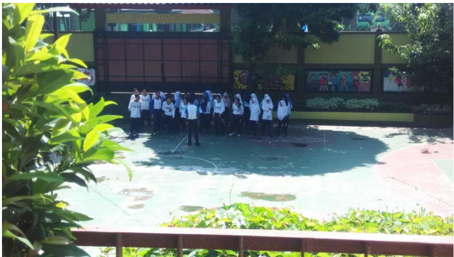
Apresepsi diberikan kepada peserta didik