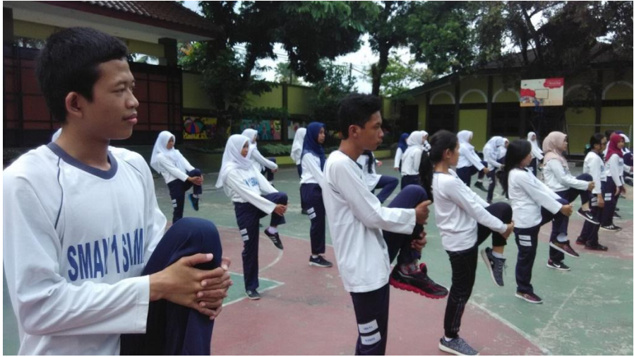
Mengajar di kelas XII MIA 3