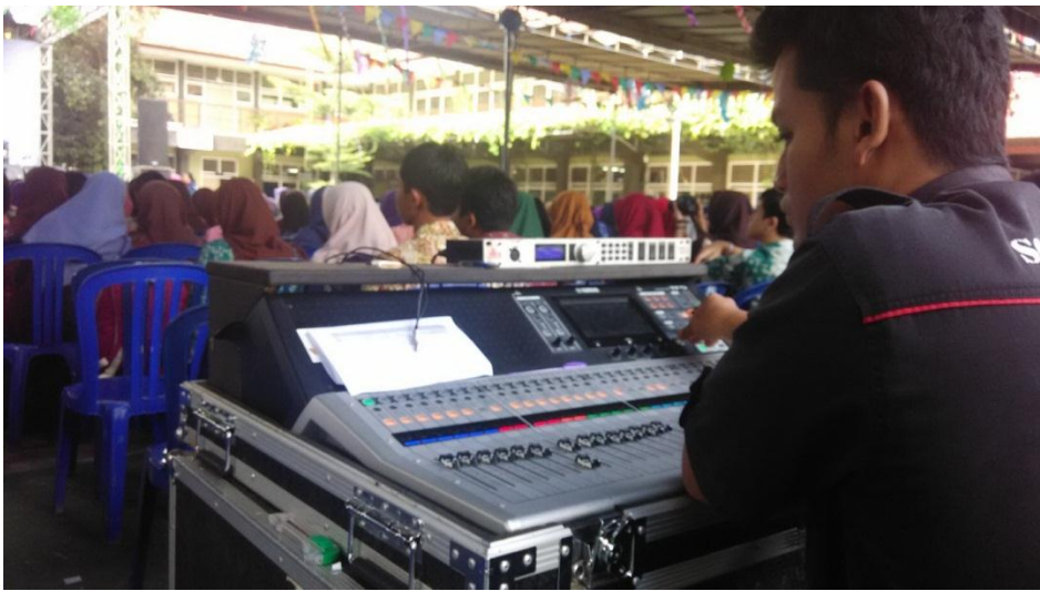
Kegiatan HUT SMAN 1 Sleman