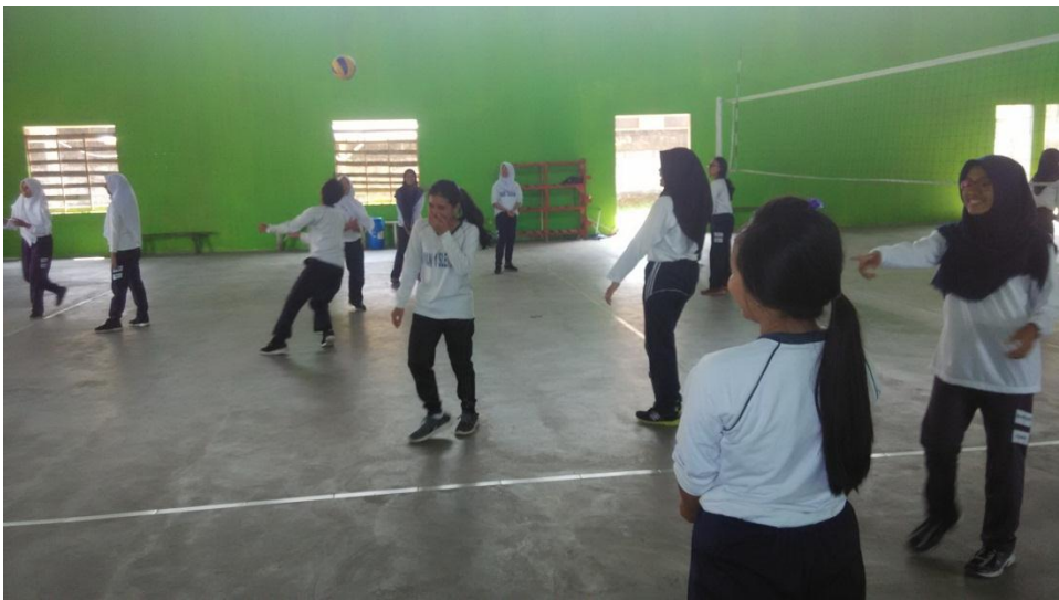
Materi bola voli di kelas XII MIA 1