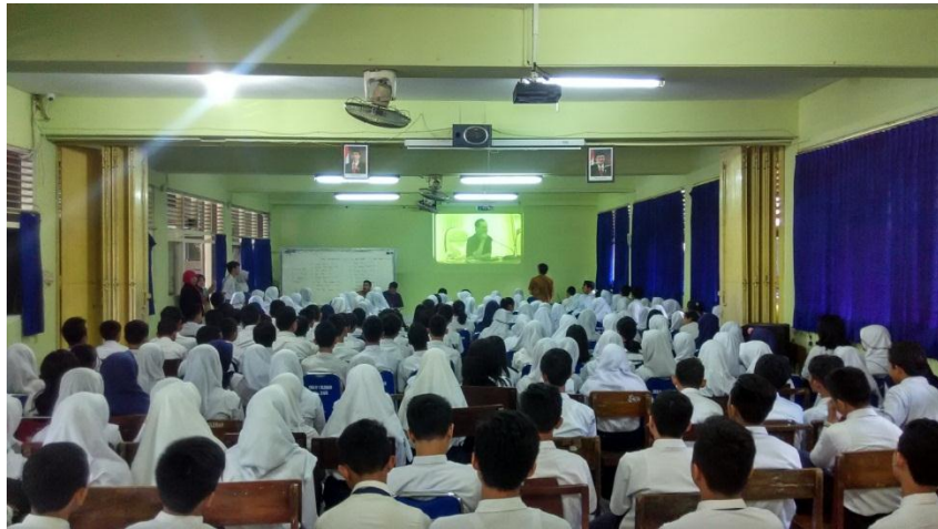
Kegiatan PLS Kelas X