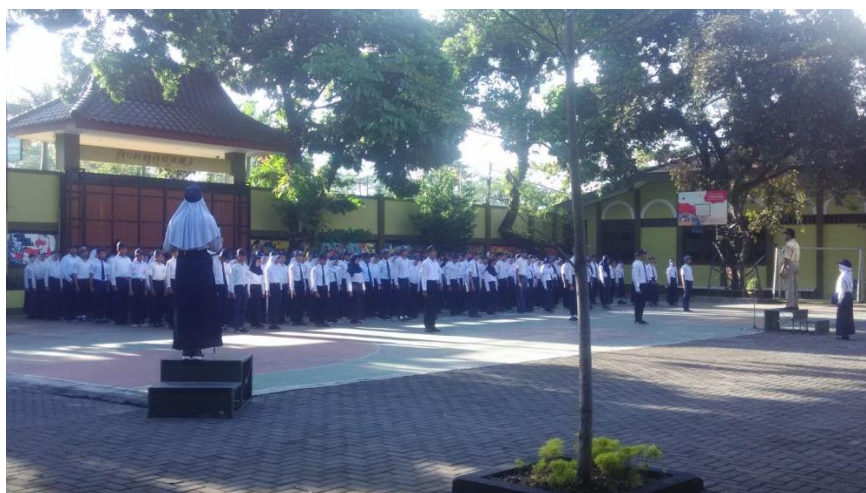
Upacara kegiatan PLS kelas X