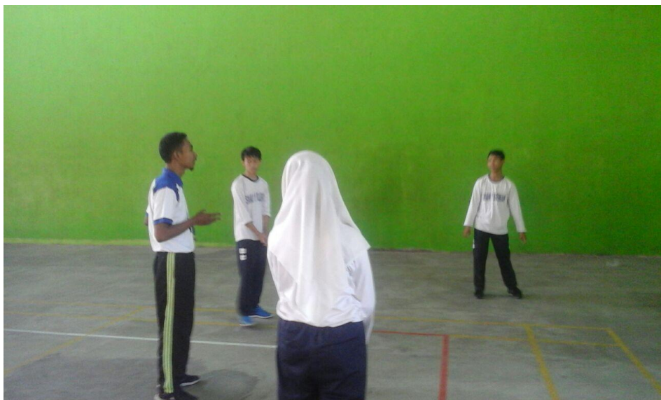
Mengajar di kelas XII MIA 2