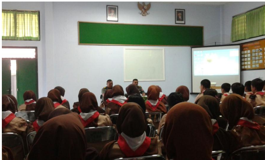
Kegiatan Kepramukaan Kelas XI