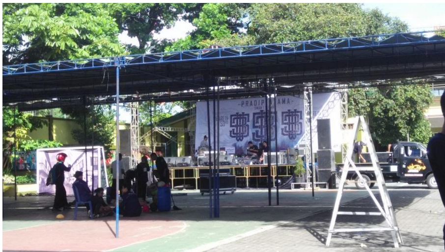
Persiapan menyambut HUT SMAN 1 Sleman