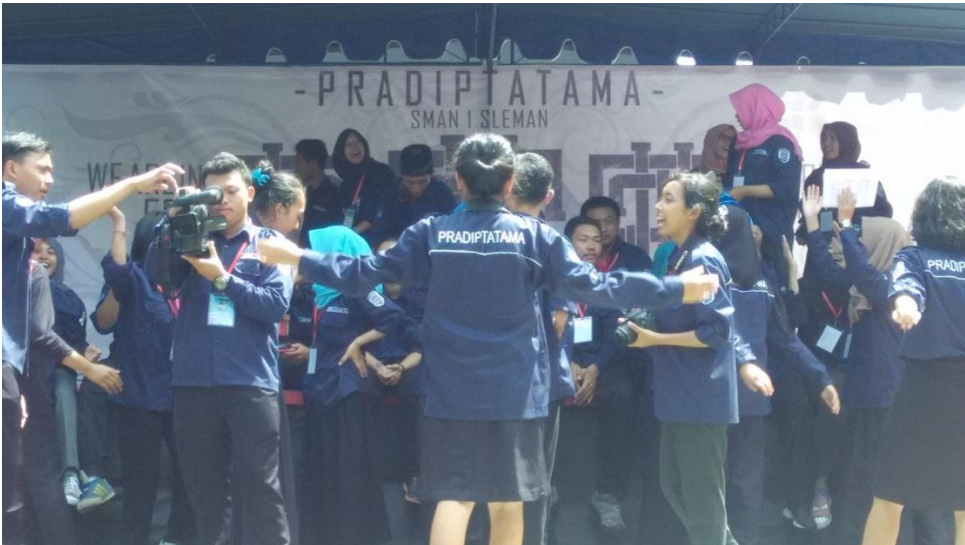
Setelah acara HUT SMAN 1 Sleman selesai