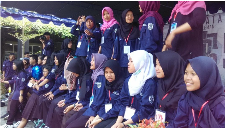
Panitia HUT SMAN 1 Sleman