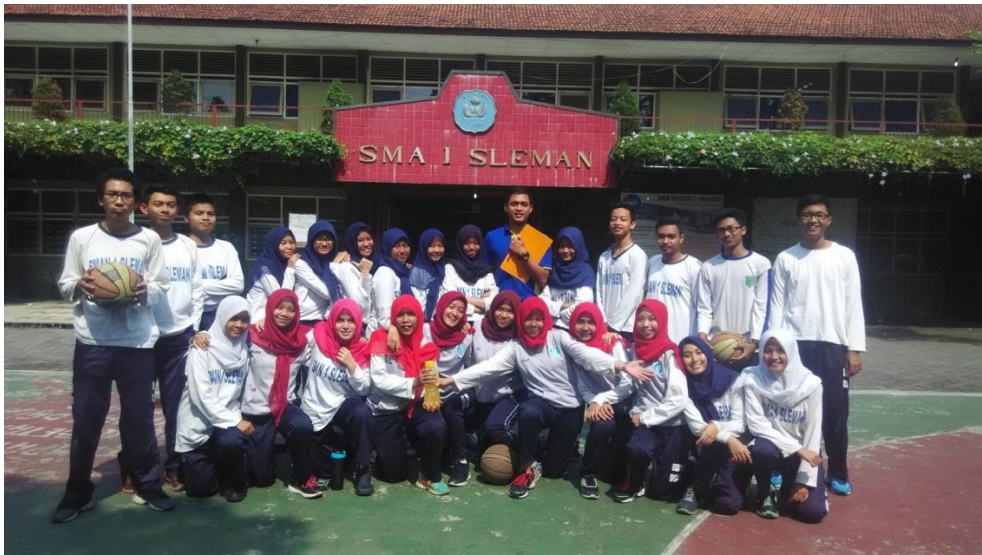
Materi pembelajaran event di kelas XII MIA 2