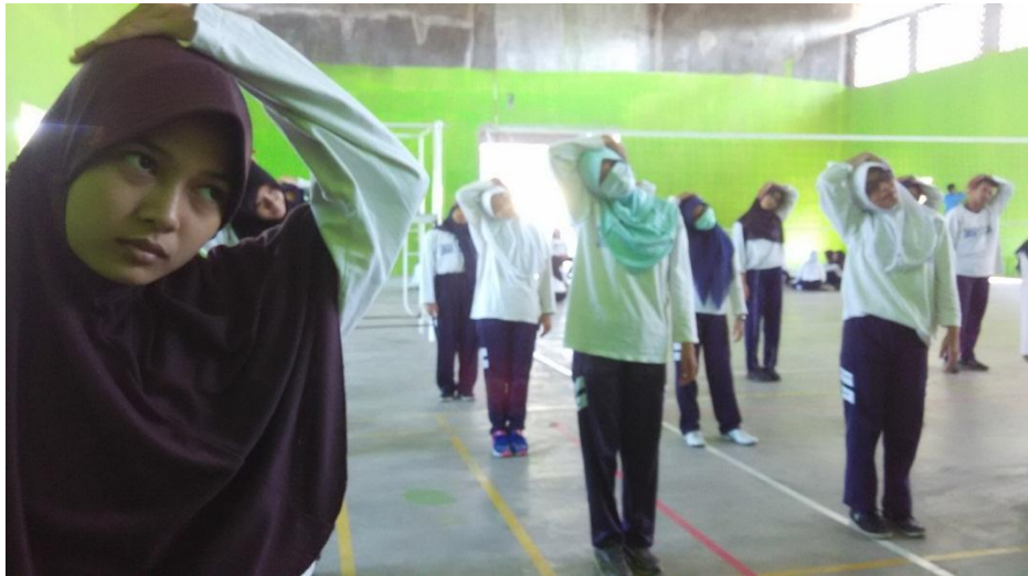
Pemanasan sebelum melakukan aktifitas inti