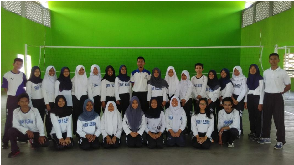
Berfoto bersama kelas XII MIA 3