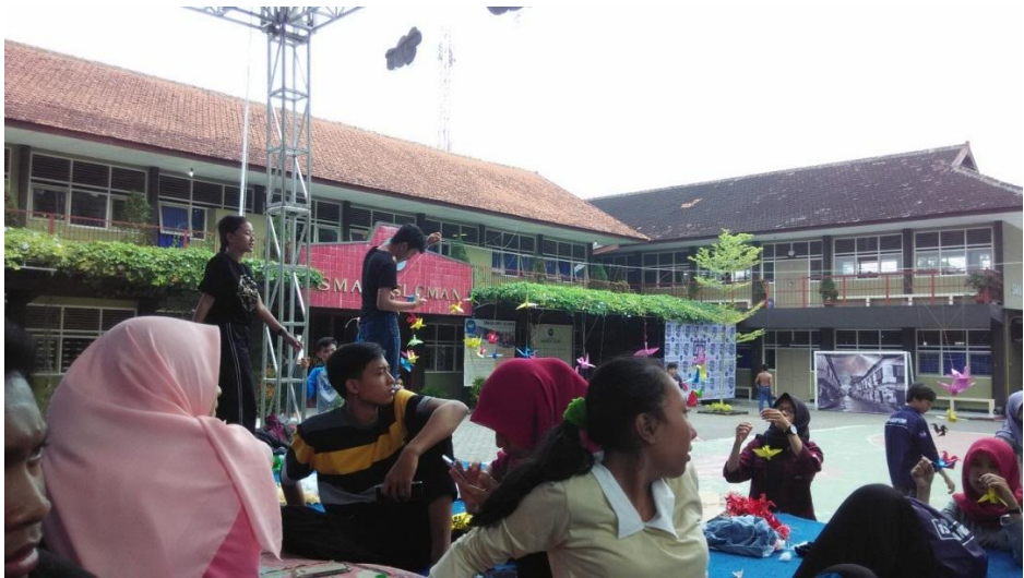
Bergotongroyong mendekorasi panggung