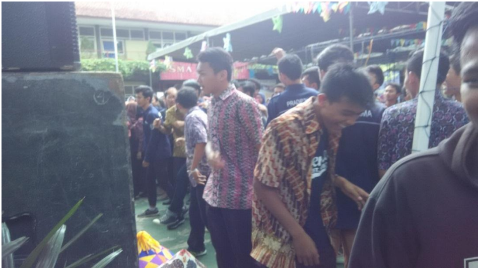
Meriahnya acara HUT SMAN 1 Sleman