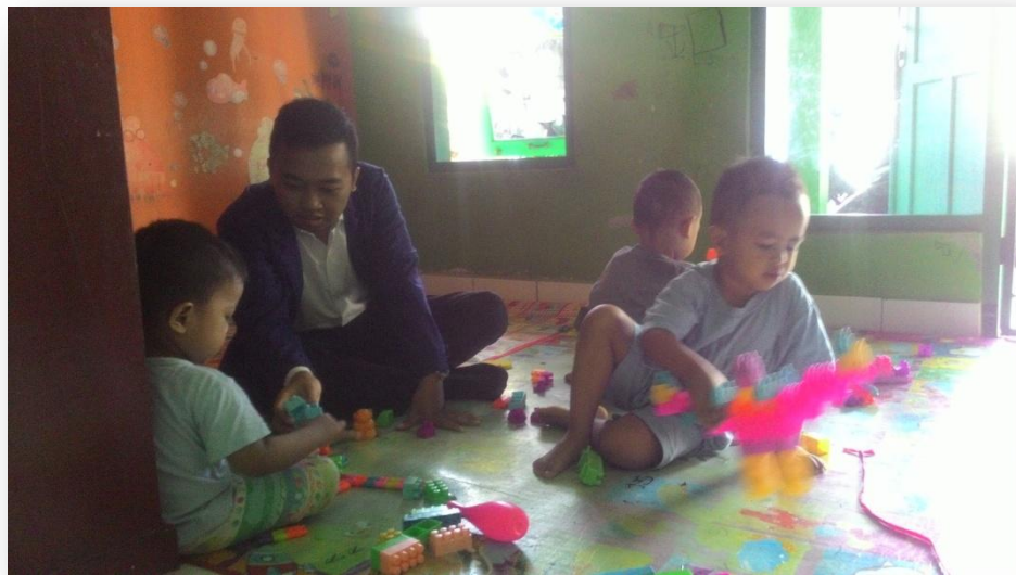
Foto 13 : Pendampingan Pembelajaran di TPA Prima Sanggar SKB Bantul