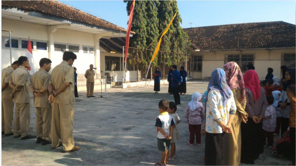
Foto 8 : kegiatan Upacara Bendera Setiap hari senin (Pemimpin Upacara)