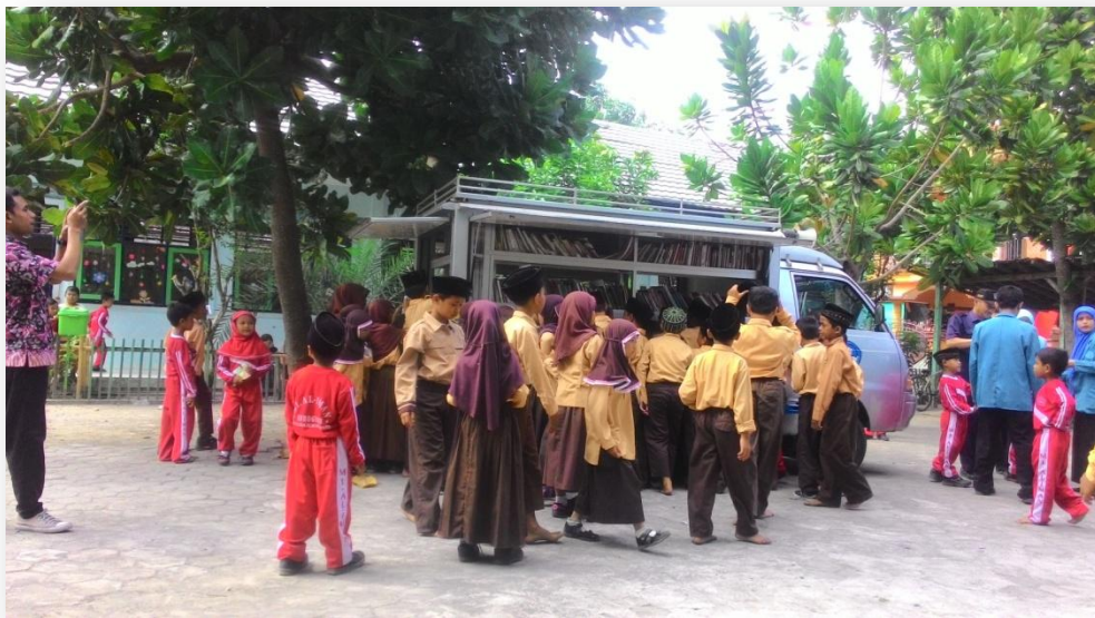
Foto 11 : Kunjungan TBM Keliling tanggal 3 september ke MI sorogenen