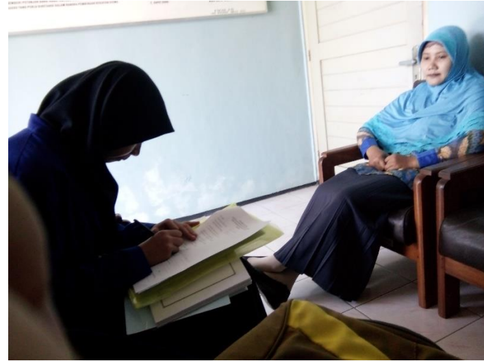
Saat Monitoring BMD