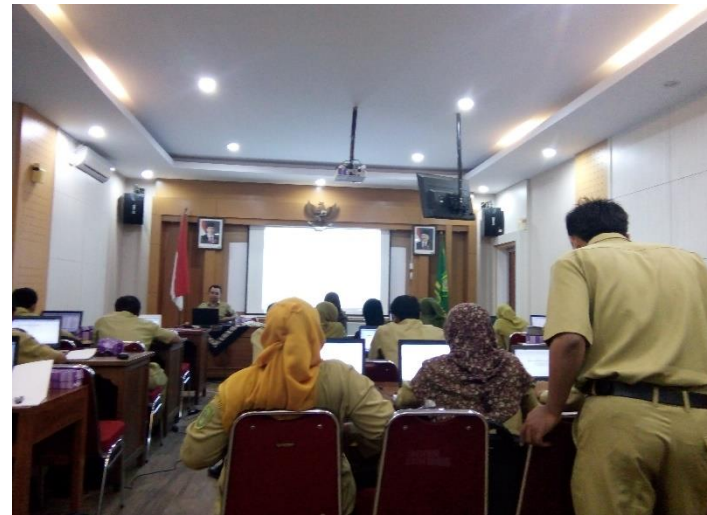
Pelatihan Aplikasi SIMDA BMD