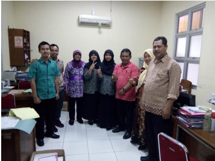
Foto Bersama Pegawai Sub Bagian Keuangan dan Aset