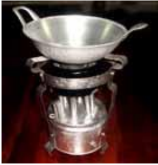
Kompor dan wajan