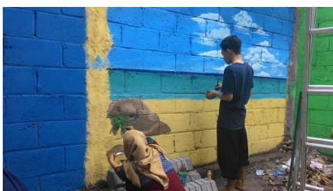
Sekolah Sehat (mengecat tembok)