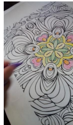
Pointilis oleh siswa