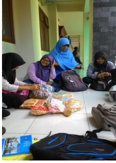
Diskusi kelompok PPL