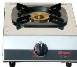
kompor untuk melorot