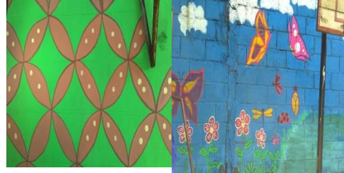
Hasil Program Sekolah Sehat (mengecat)