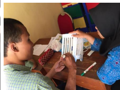
Proses menghias kap lampu