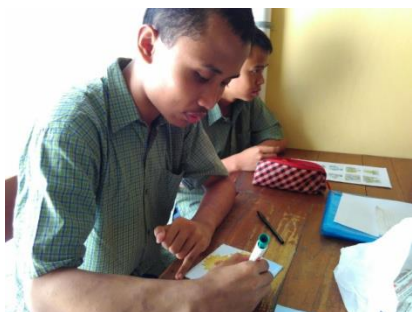
Proses menghias kap lampu