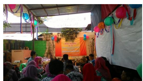
Dies Natalis SLB Autisma Dian Amanah