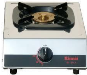
kompor untuk melorot