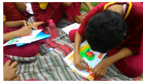
Lomba 17 Agustus – Mewarnai