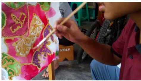
siswa mewarnai kain dengan kuas