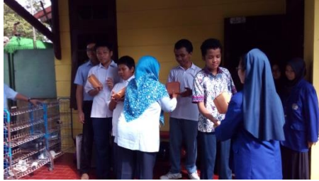
Pembagian Hadiah Lomba Mewarnai