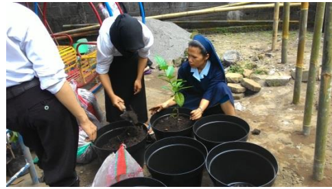
Program Sekolah Sehat (menanam)