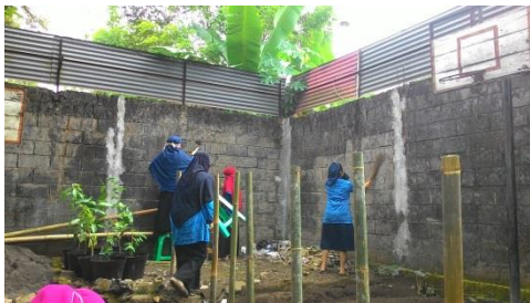
Sekolah Sehat (membersihkan tembok)