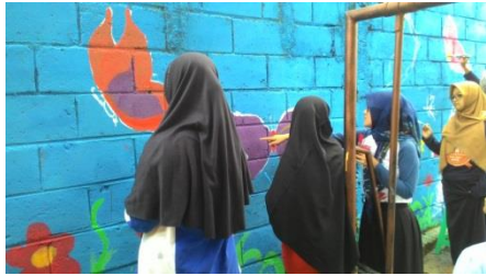
Sekolah Sehat (menggambar)