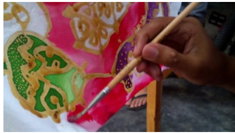
siswa mewarnai kain dengan kuas