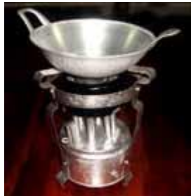
Kompor dan wajan

Lihat gambar, sebut dan tunjuk nama-nama benda pada gambar dengan benar!