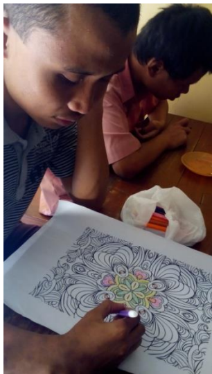
Pointilis oleh siswa