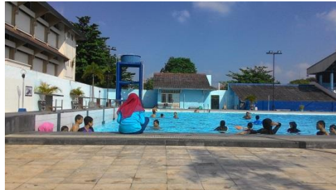
Mendampingi Anak Berenang