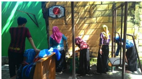
Sekolah Sehat (mengecat tembok)