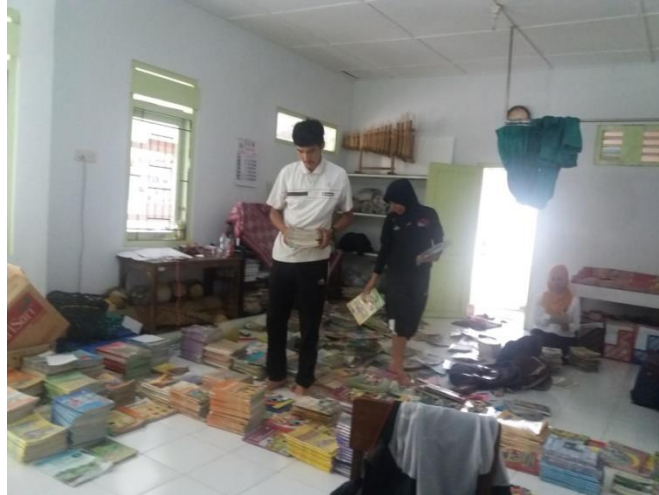
Pendataan buku-buku perpustakaan