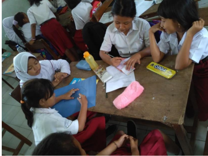
Pembelajaran di Kelas IV