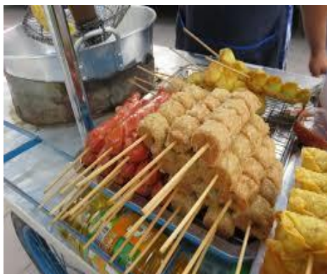
Gamb 1. Makanan tidak sehat