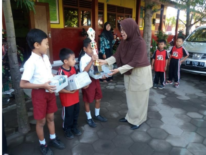
Pembagian Hadiah Lomba