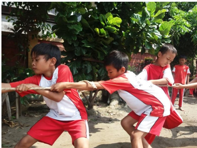
Lomba Tarik Tambang