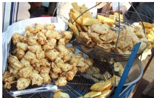
Gamb 2. Makanan tidak sehat