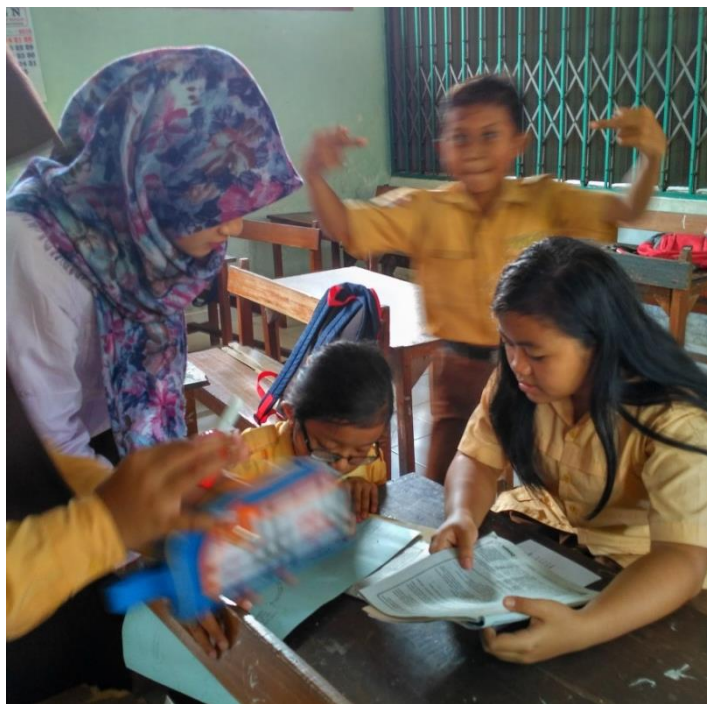
Pembelajaran di Kelas VI