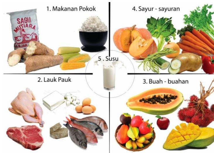
Gamb. 3 makanan sehat