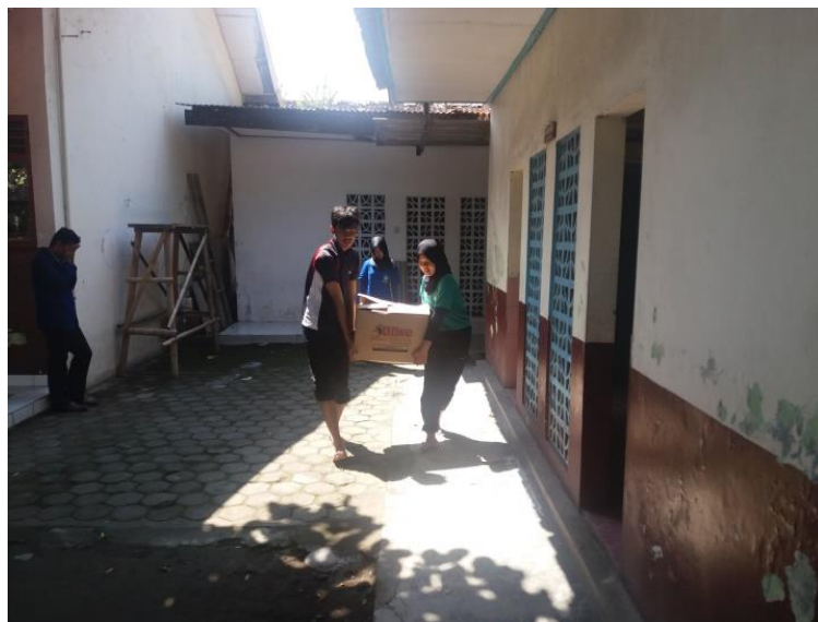
Memindahkan barang-barang dari perpustakaan ke ruang transit PPL