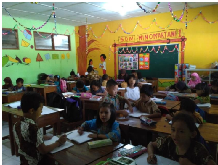
Pembelajaran di Kelas I