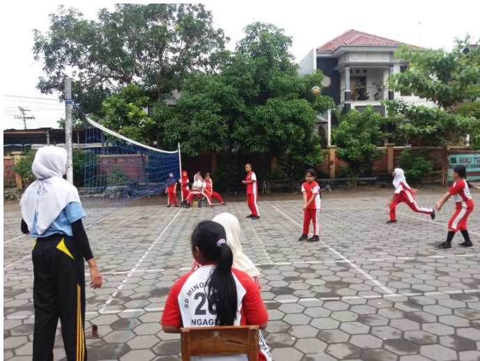
Lomba Voly Putri