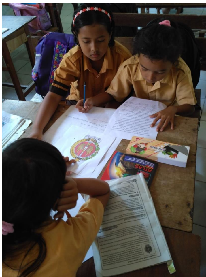
Pembelajaran di Kelas IV