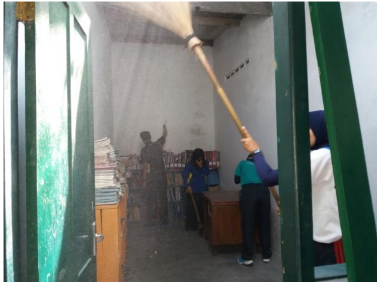
Membersihkan ruang perpustakaan