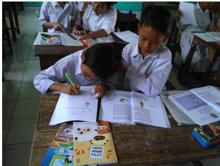
Pembelajaran di Kelas V