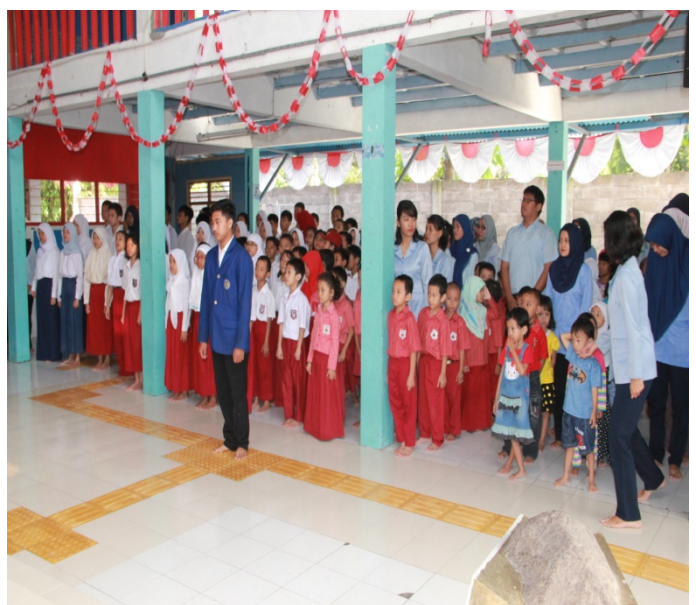
Upacara HUT RI ke 71