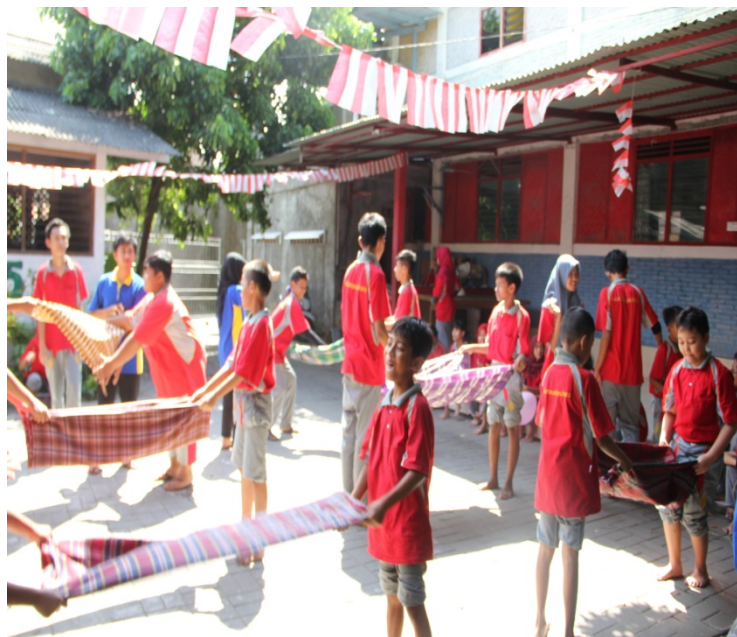
Perlombaan Perayaan HUT RI ke 71