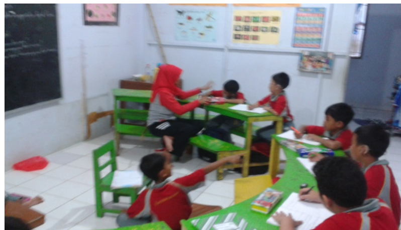
Pendampingan Praktik Mengajar