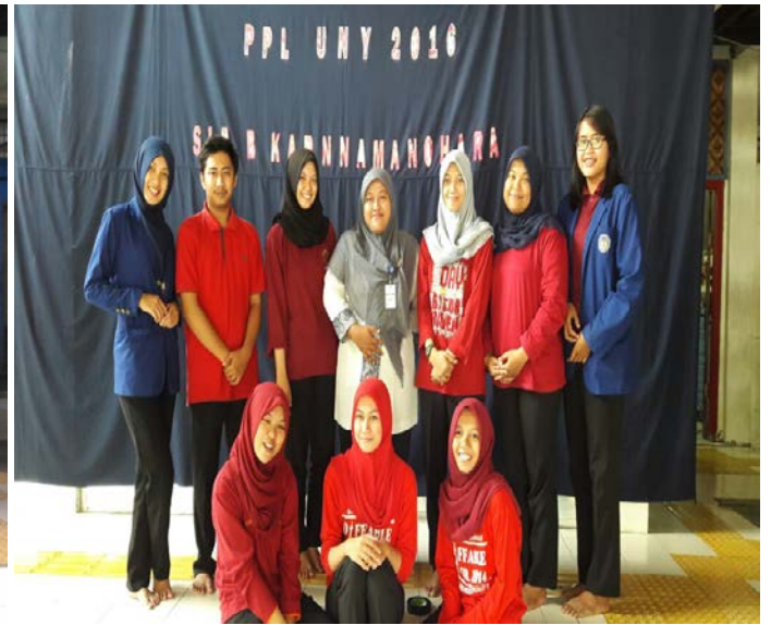
Perpisahan dan Penarikan Mahasiswa PPL