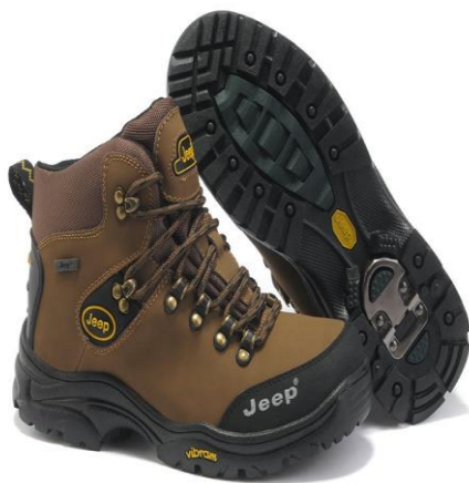
For hiking Brown