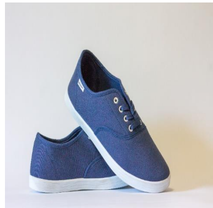
For attending a concert Blue