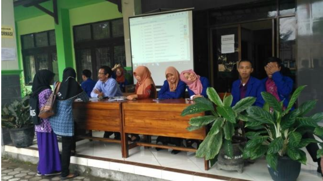
Penerimaan Peserta Didik Baru