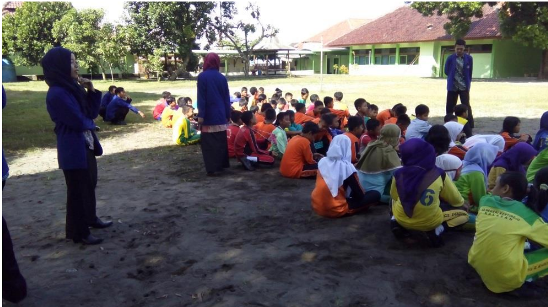
Masa Pengenalan Lingkungan Sekolah