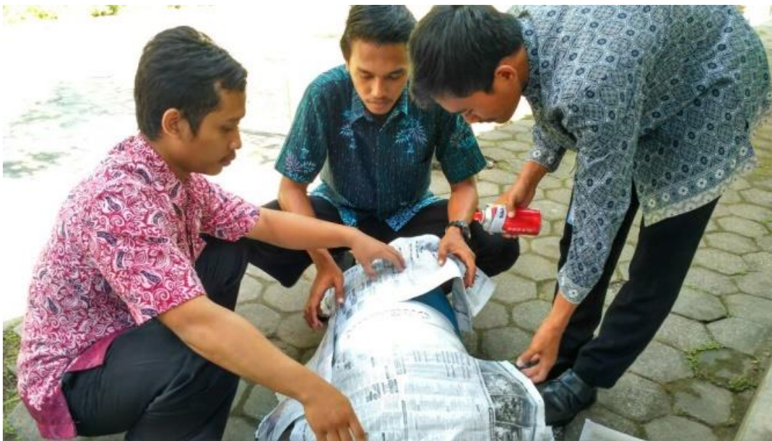
pengecatan tong sampah dalam rangka lomba Adiwiyata