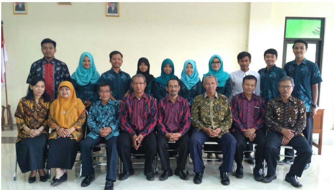
Penarikan Mahasiswa PPL UNY 2016 SMP N 1 Ngeplak